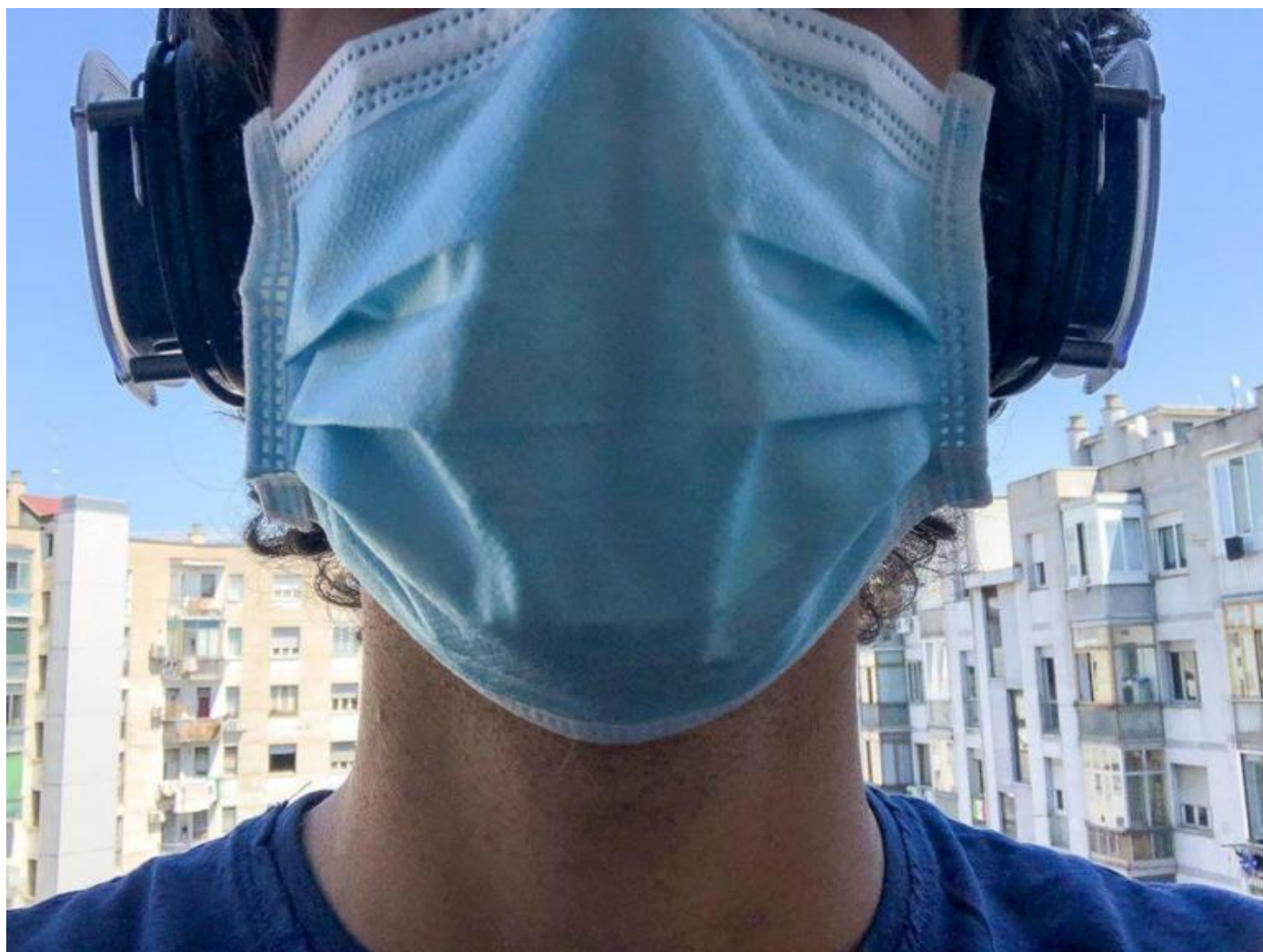
Kepler-452, Lapsus urbano.

strutture. Gli artisti che devono parlare alla radio, ad esempio, devono reinventarsi un linguaggio per quel mezzo. Allora la radio arriva dappertutto, parla direttamente alle persone, a tu per tu, recupera quello statuto privilegiato. Ecco questo è un modo interessante di utilizzare questo tempo di sospensione».