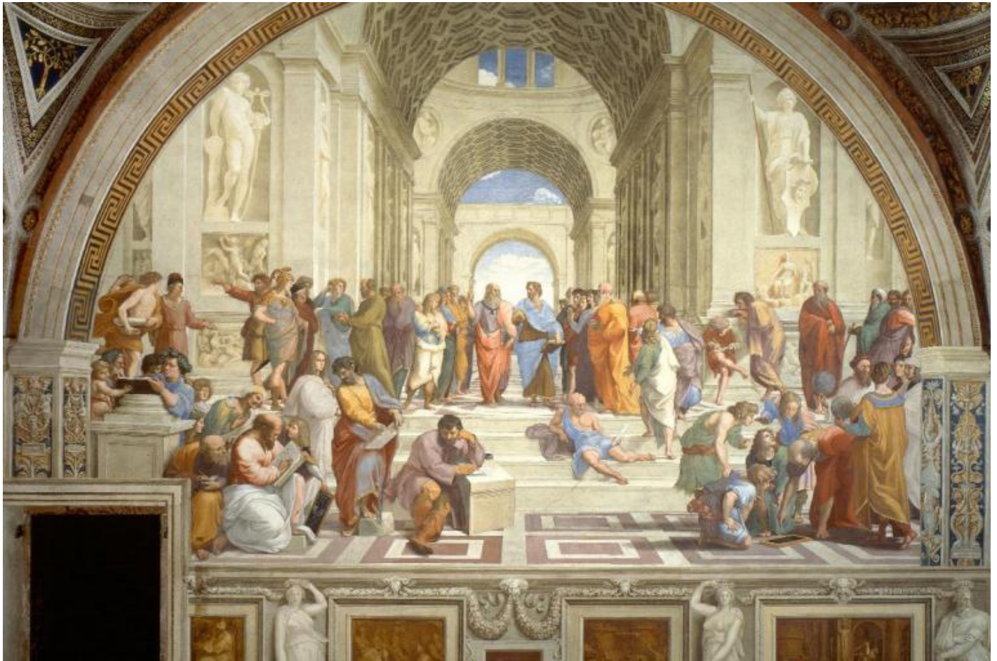
Raffaello, Scuola di Atene, 1509-1511, Stanza della Segnatura, Città del Vaticano, Musei Vaticani.