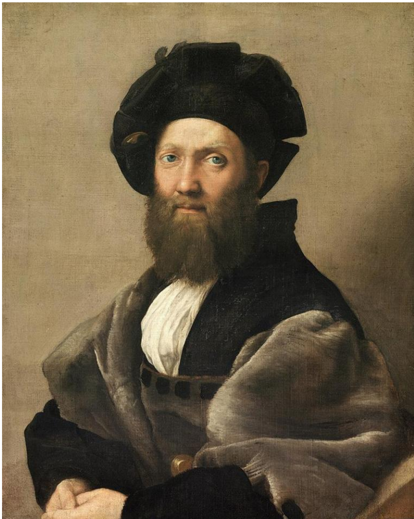
Raffaello, Ritratto di Baldassare Castiglione, 1513 circa, Parigi, Musée du Louvre.