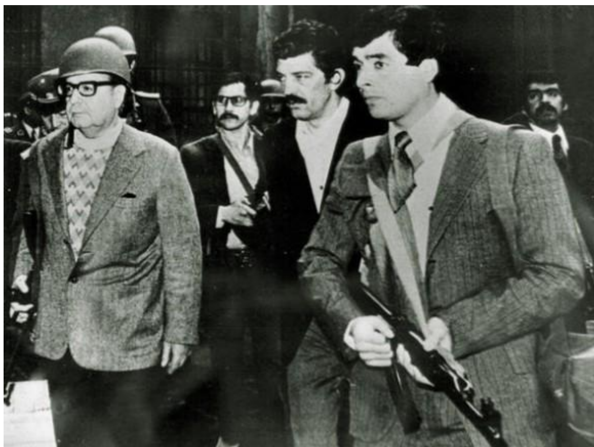
Salvador Allende, 11 settembre 1973