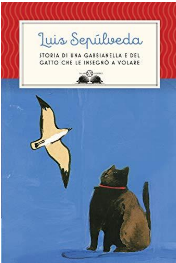
Storia di una gabbianella e del gatto che le insegnò a volare

In quegli anni pubblica due romanzi, Un nome da torero e Diario di un killer sentimentale , e i 24 racconti di Incontro d’amore in un paese in guerra , storie sudamericane di anarchici, banditi, marinai, ricercati politici in fuga, tra legami di amicizia e di amore, voglia di libertà e speranze di fuga.