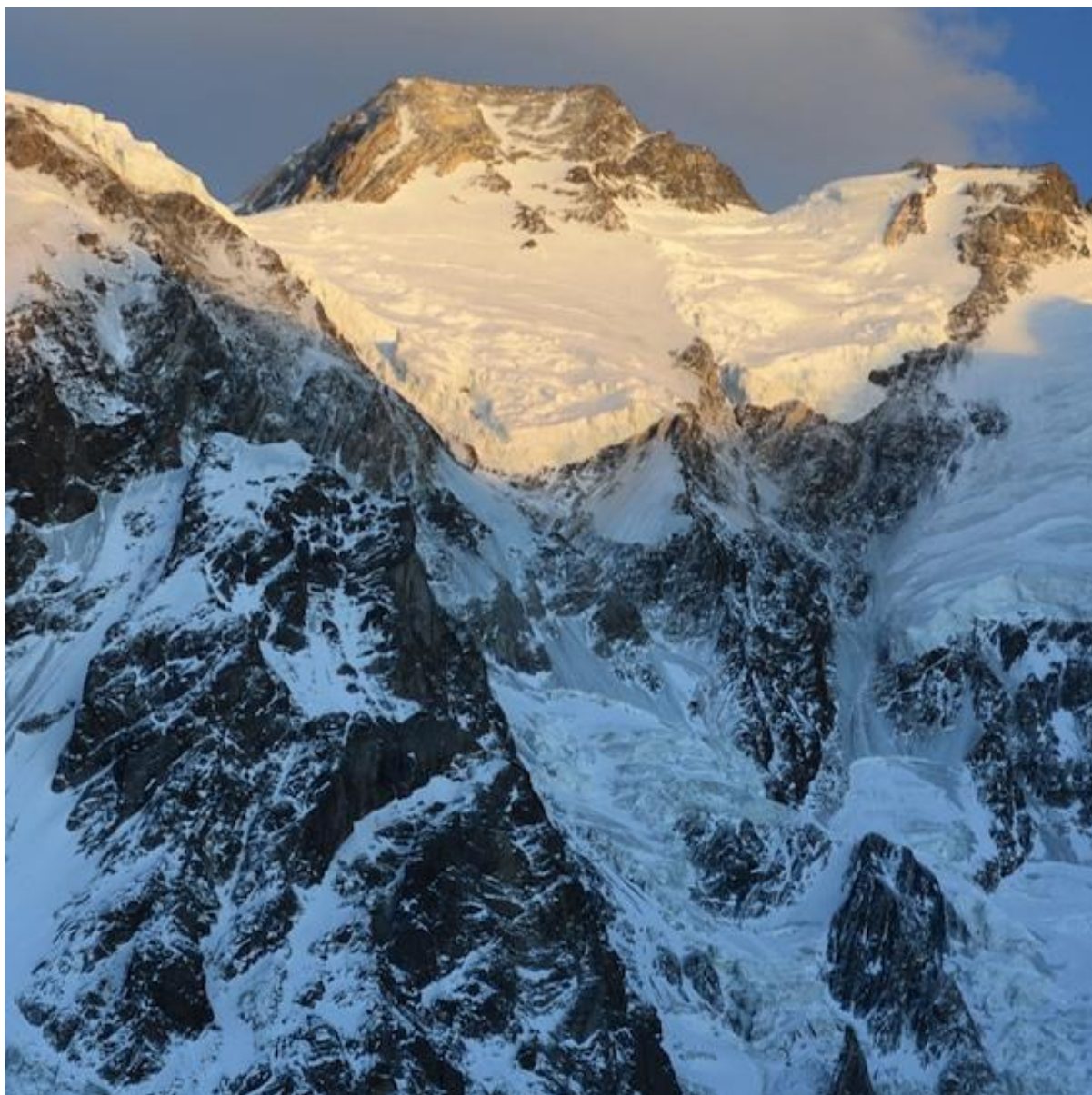
Il Nanga Parbat, sulla sinistra lo sperone Mummery.