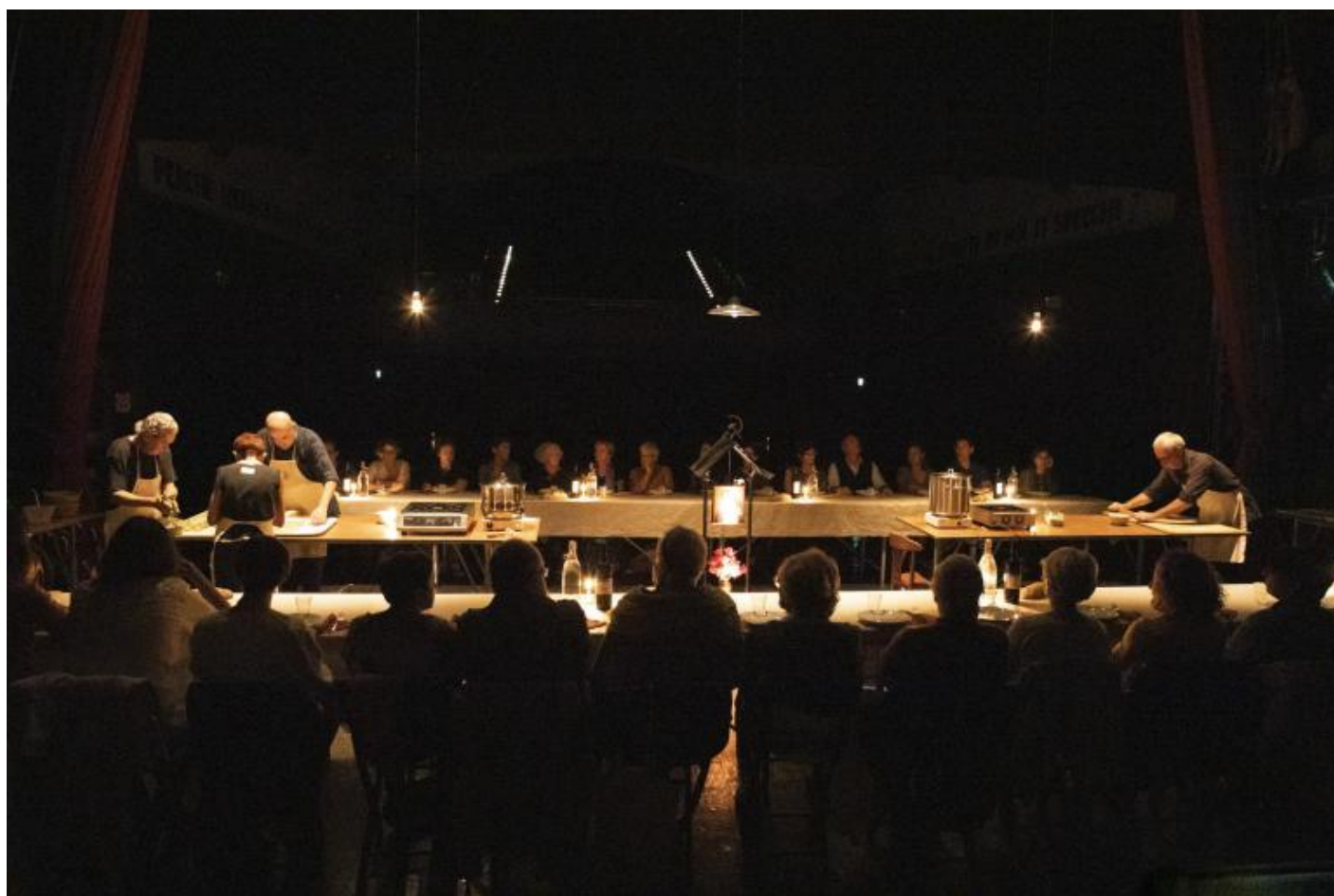
Pane e petrolio, ph. Marco Caselli Nirmal.

Certo, molti sono i casi di vere e proprie sciagure: c'è lo spettacolo tanto atteso che salta, e chissà se si potrà recuperare, per esempio Rezza-Mastrella a Bologna; intere nutrite compagnie bloccate, come quella che stava portando in tournée When the Rain Stops Falling , uno dei premi Ubu, titolo cancellato dalla programmazione dell'Emilia Romagna e incappato subito dopo nella chiusura del Teatro di Roma; o come quella di Va pensiero del ravennate Teatro della Albe, dieci attori in scena, più tecnici e amministrativi, una ripresa che doveva girare in questo periodo: cancellata. E ancora più doloroso forse è l'annullamento di uno spettacolo piccolo (ma intenso), Pane e petrolio , coproduzione Teatro delle Ariette e Albe, con Gigio Dadina delle Albe, un canto cucinato sulle derive della nostra civilizzazione, a stretto contatto di spettatori, "intavolati": doveva fare alcune recite spostandosi in diverse case del popolo, dopo una tessitura di rapporti durata a lungo, e si è dovuto bloccare.