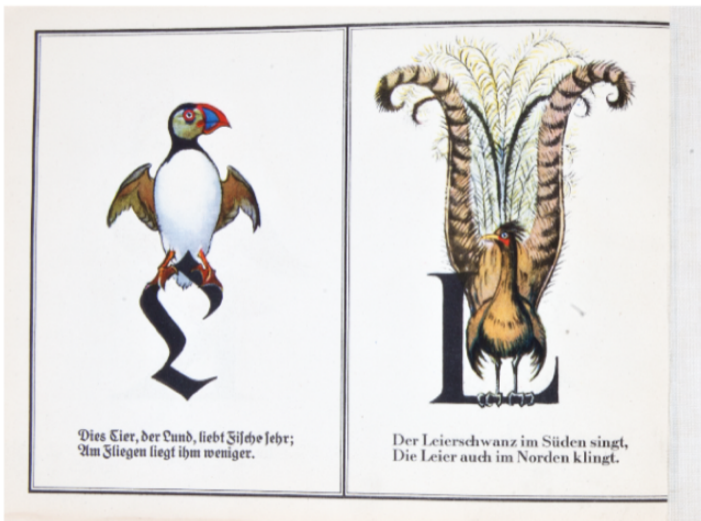
Friedrich Wilhelm Kleukens, Vogel ABC , Stalling Verlag, Oldenburg 1925.

Parallela a questo filone di indagine, troviamo nel libro una ricerca etimologica: Maurizio Bettini ci spiega il significato della parola latina ornamentum , che non corrisponde esattamente alla semantica dell'italiano, poiché indica anche l'equipaggiamento di un'unità militare o di una nave e persino i finimenti del cavallo, ma anche la bull a del ragazzo e il paludamentum del console che, oltre all'aspetto estetico, definivano il rango del personaggio in questione. L'etimo di ornare si collega poi al verbo ordinare : «l'ornamento non è un semplice abbellimento, ma una forma di “ordinamento”» ed è parente dell'ordito. Non si tratta quindi di un capriccio: l' ornamentum manifesta un ordine, come il greco kosmos , che indica l'adornare, ma anche l'ordine delle parole in un discorso, i modi del comportamento, la struttura della comunità e dello Stato e, infine, l'ordine dell'universo (pp. 95-96, vedi anche la voce 'kosmos' di Paolo Cesaretti).