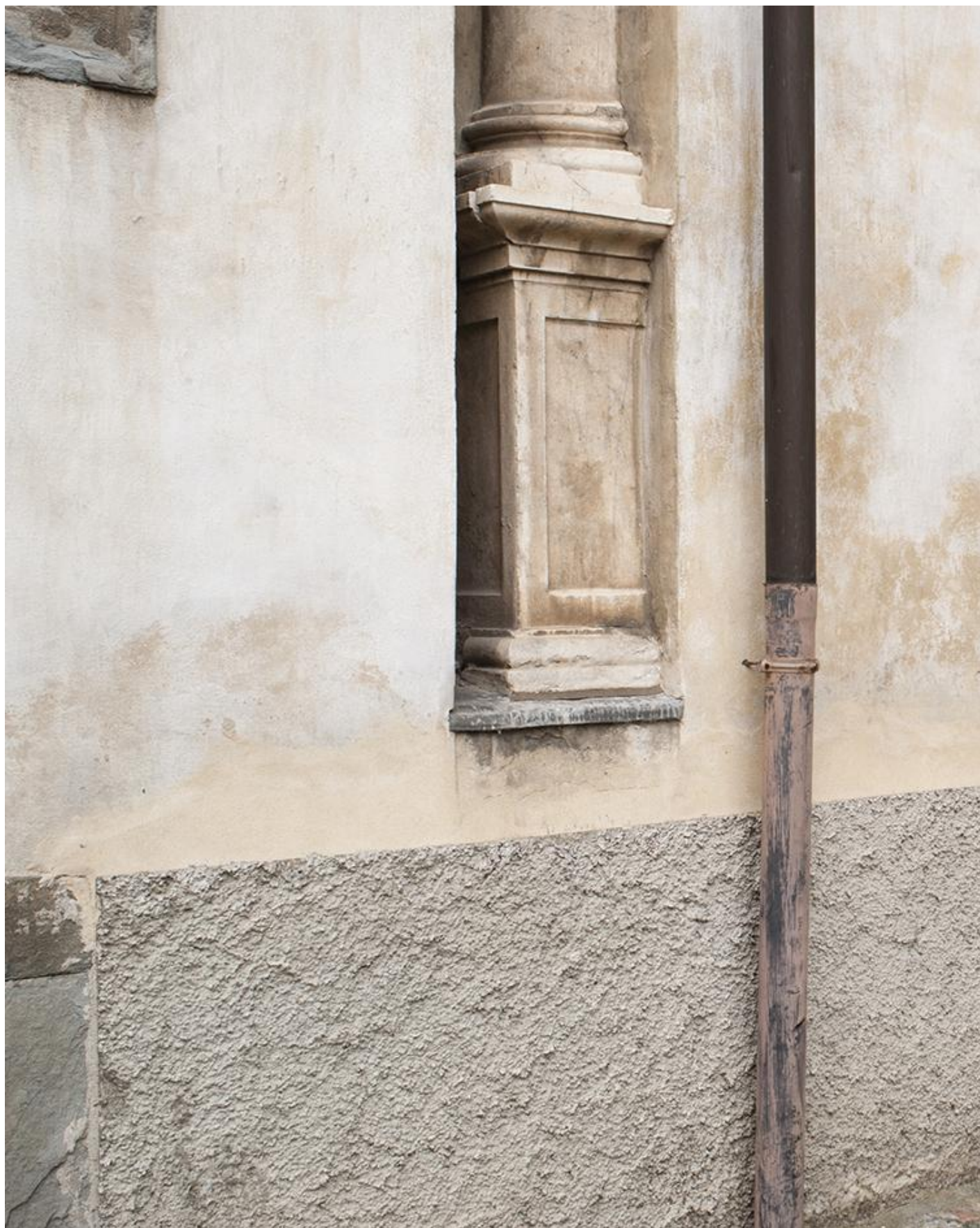
Enrico Bedolo, Bergamo, 2017 #1