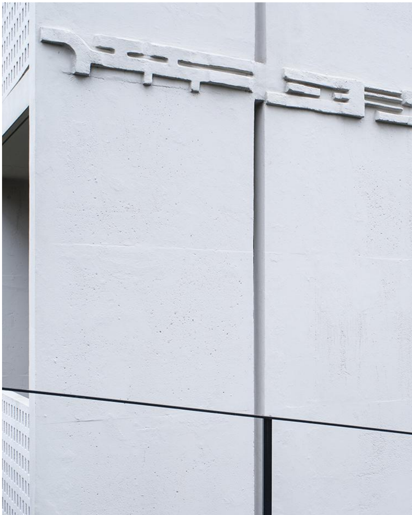
Enrico Bedolo, Bergamo, 2017 #7