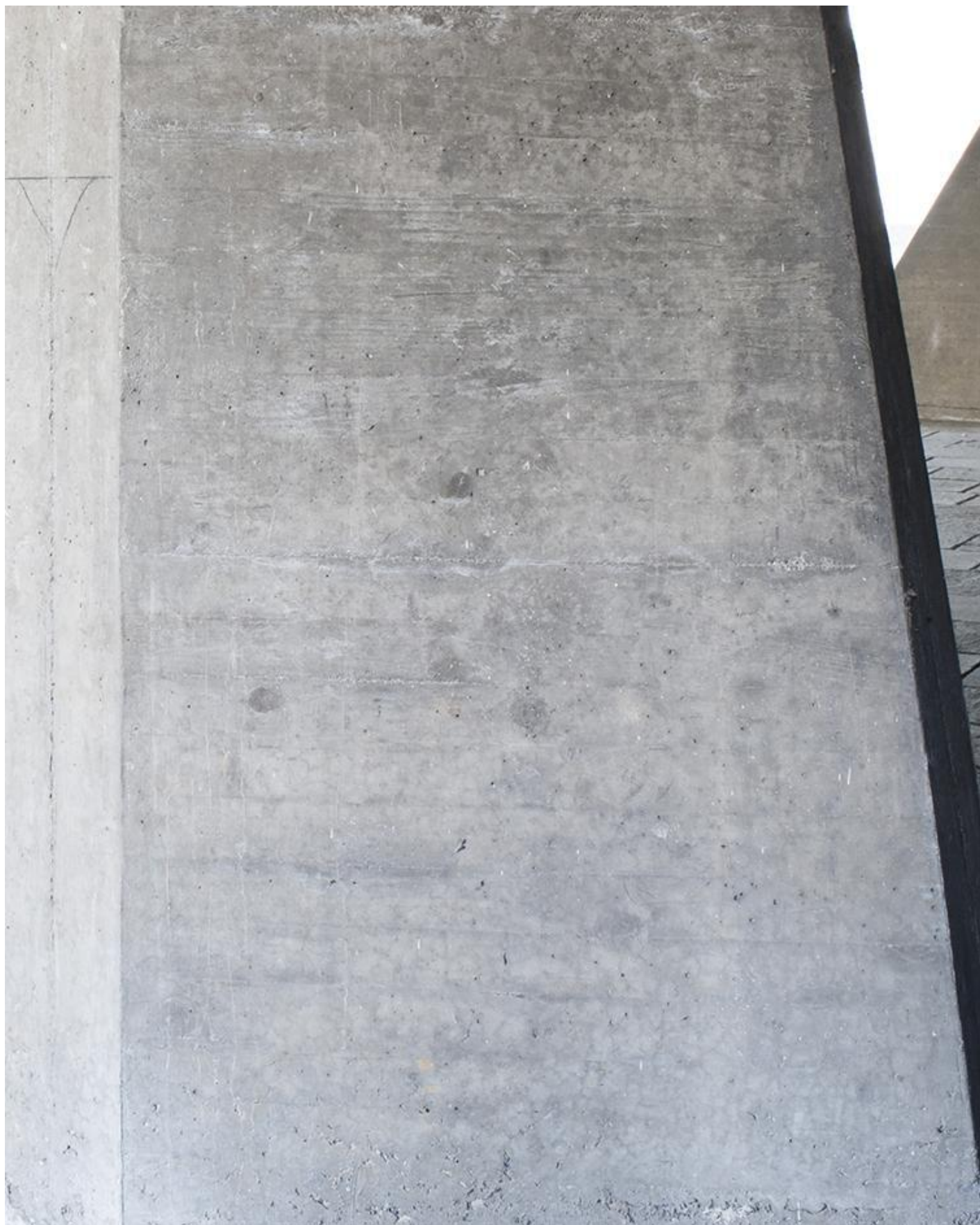
Enrico Bedolo, Bergamo, 2017 #5