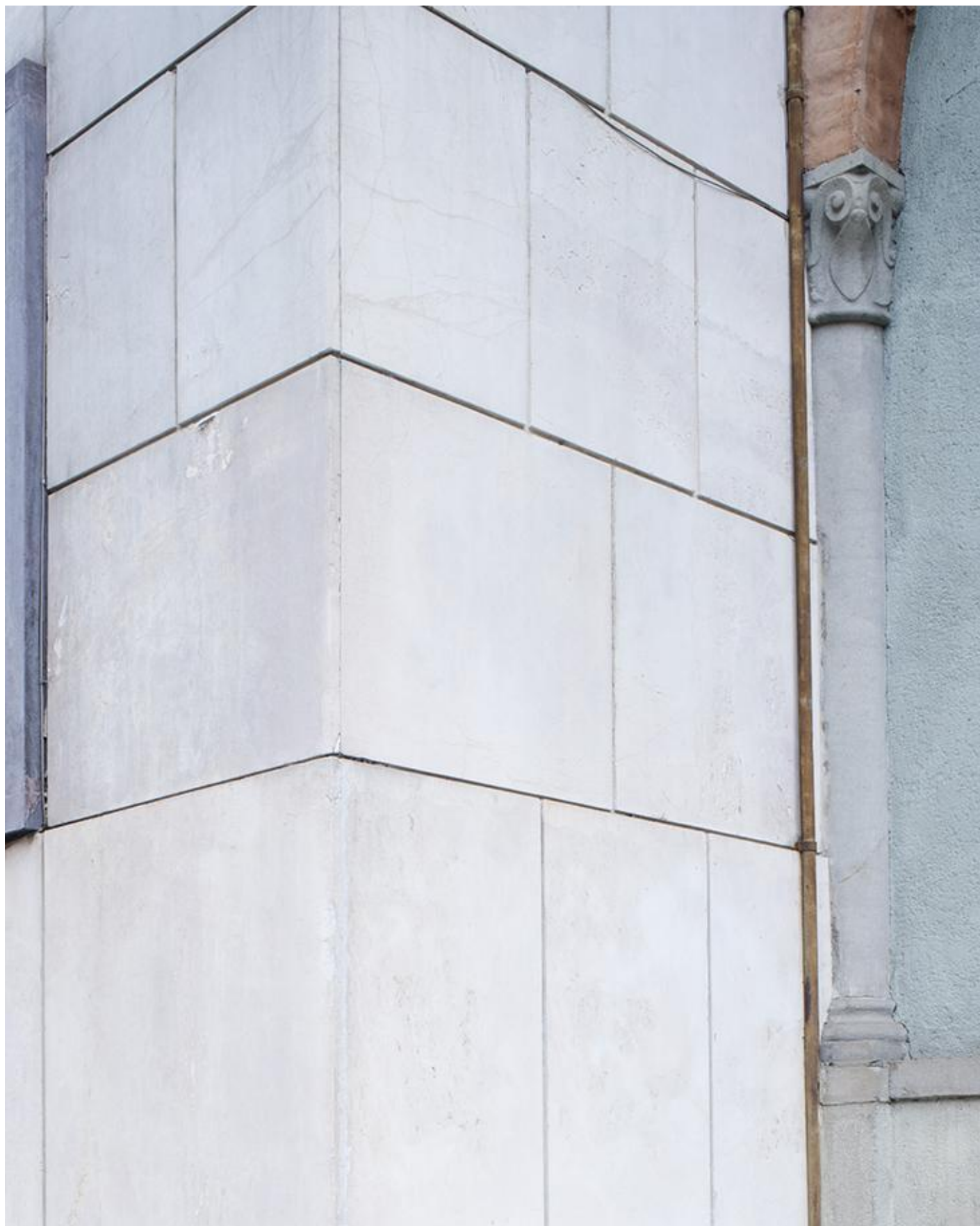
Enrico Bedolo, Bergamo, 2017 #4