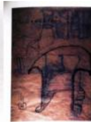
Gastano Pece, poltrona

Progetta come linguaggio, forma come illusione: il design italiano lavora sul valore semantico degli oggetti, ma è ancora un progetto fatto di materia, che costringe la tecnologia a spingersi in territori ancora in parte inesplorati.