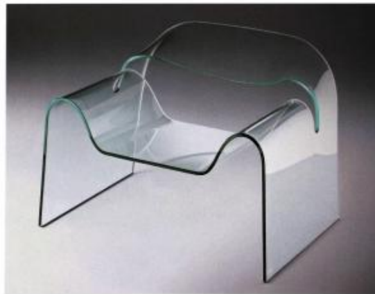
Cini Boeri, poltrona Ghost,