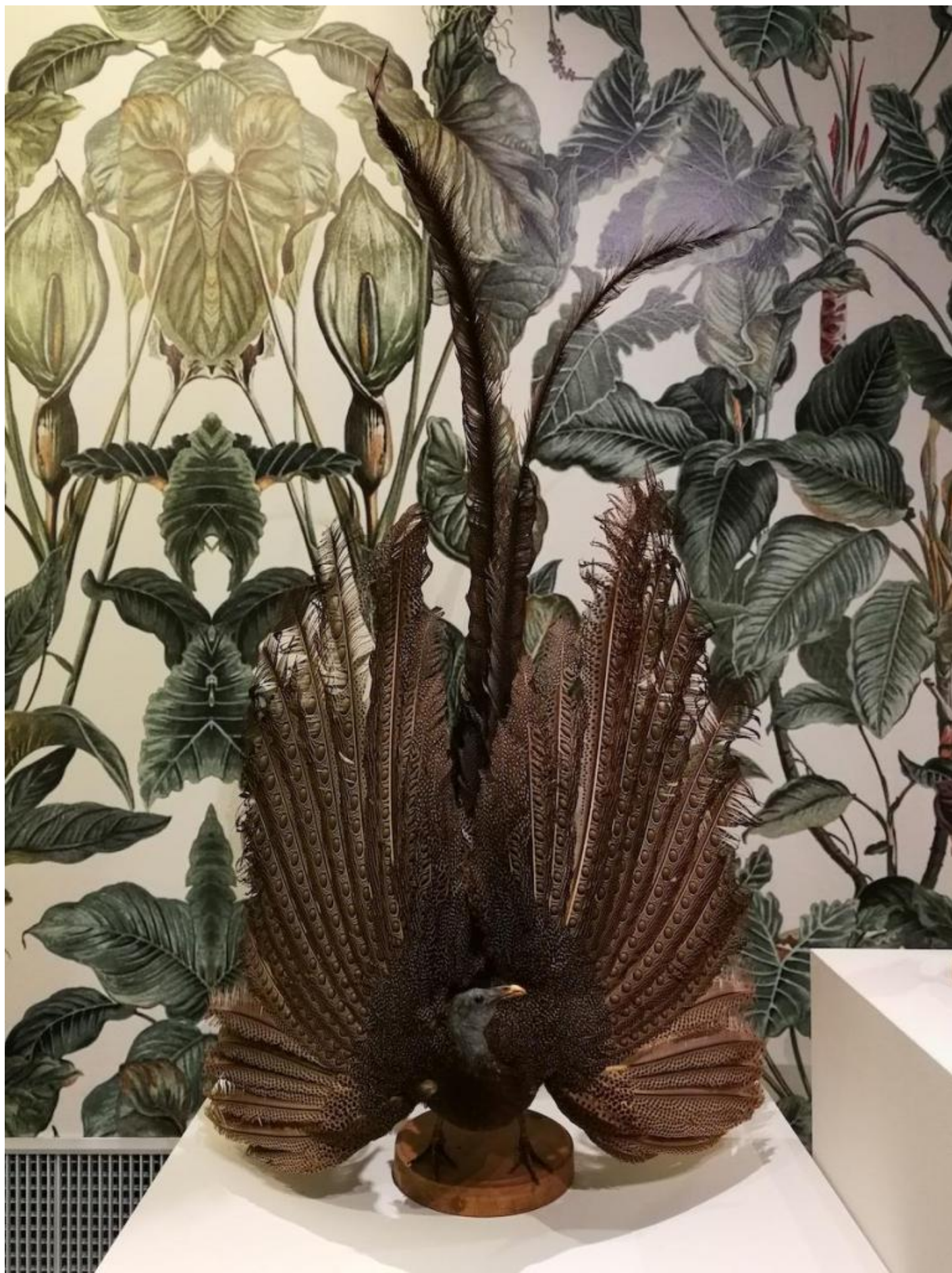
Fagiano argo , Musei Civici, Reggio Emilia.