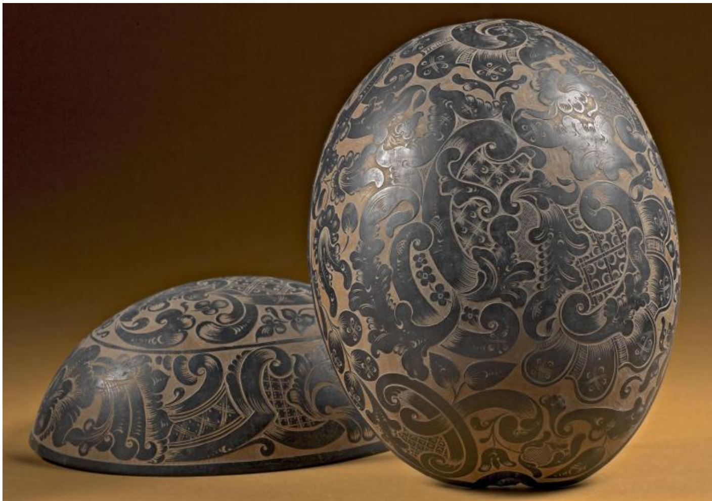
Noce di cocco, gusci intagliati, dalla collezione di Lazzaro Spallanzani, seconda metà del XVIII sec., Reggio Emilia, Musei Civici © foto Carlo Vannini.

della mente di sapersi districare lungo un percorso abilmente tracciato.