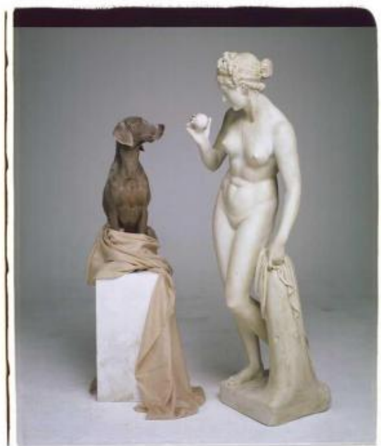
William Wegman, On base, 2007.

Sosto davanti a “Casual”, foto del 2002 che è stata scelta come locandina della mostra. La testa del Weimaraner è leggermente inclinata verso la sua destra, lo sguardo esprime un’attenzione disinvolta, amichevole. Uno stare al mondo senza troppi pensieri. La stessa idea che arriva dalle braccia che corrono lungo il corpo per infilarsi in tasca. Sono braccia vuote, che simulano gli arti umani. Ma, pur non essendoci, si leggono come segnali di abbassamento della guardia, di resa soddisfatta al ritmo diverso di una giornata non lavorativa. Collana rossa e calzoni dello stesso colore si abbinano alla maglia e suggeriscono sensazioni di pomeridiana stravaganza, eleganti soluzioni estemporanee di un gentiluomo di campagna.