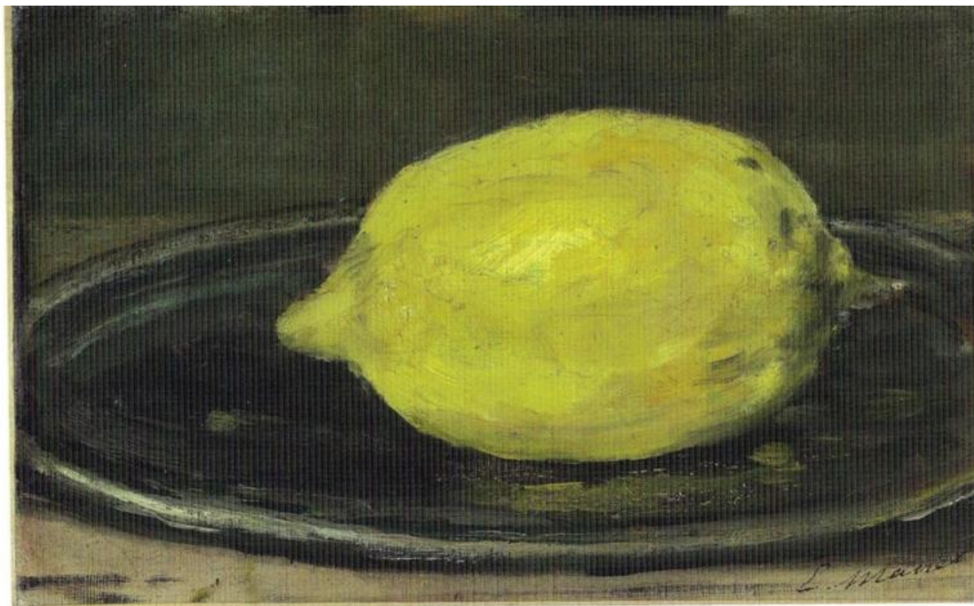
Édouard Manet, Il limone (1880).

Il carattere equivoco del giallo diventa, a partire dal secolo VI, una vera e propria polarità: quasi assente nella Bibbia e nel culto cristiano, in cui viene spesso sostituito dall'oro, diretta rappresentazione della luce divina e, insieme, vero e proprio colore, nei mosaici bizantini, nella pittura e nella miniatura, il giudizio sul giallo ricompare nella liturgia e nell'araldica. Pastoureaux esamina, tra altri, un interessante testo, dal titolo De sacro sancti altaris mysterio , del giovane Lotario, futuro papa Innocenzo III, nel quale vengono stabiliti, in base alla tradizione, i colori della liturgia e in cui trova posto appunto l'oro, mentre mancano il giallo e il blu. Nello stesso periodo il giallo si appresta invece a sostituire l'oro nei colori del blasone, entrando a pieno titolo nei sei colori fondamentali dei quali si stabiliscono le regole di combinazione: bianco, rosso, nero, verde, giallo, blu.