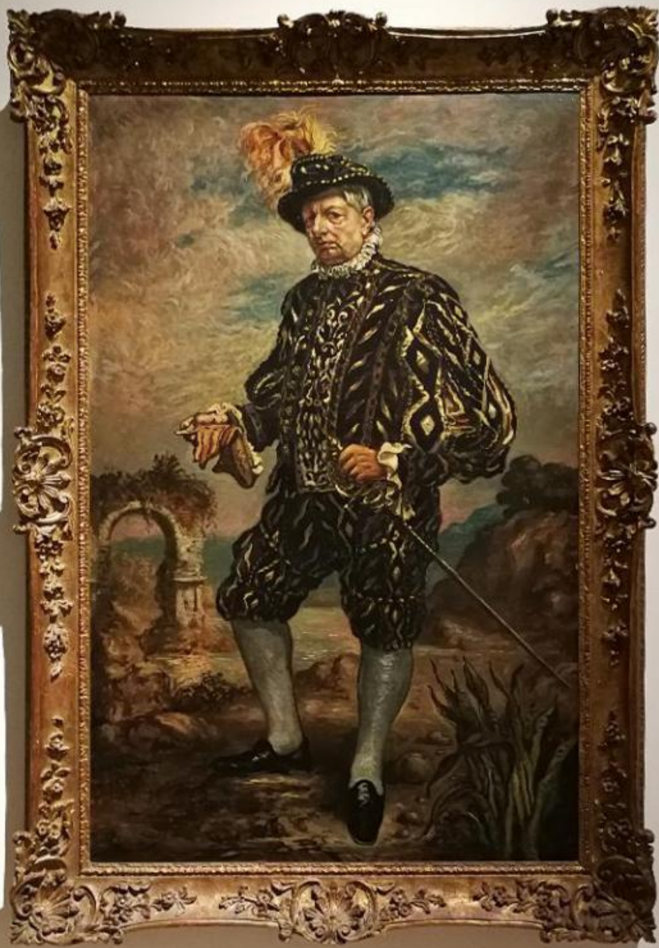
Auto-retrato in costume nero Self-Portrait in Black Costume 1544

Oil on cloth, 144 x 100 cm Rome, Galleria Nazionale d'Arte Moderna