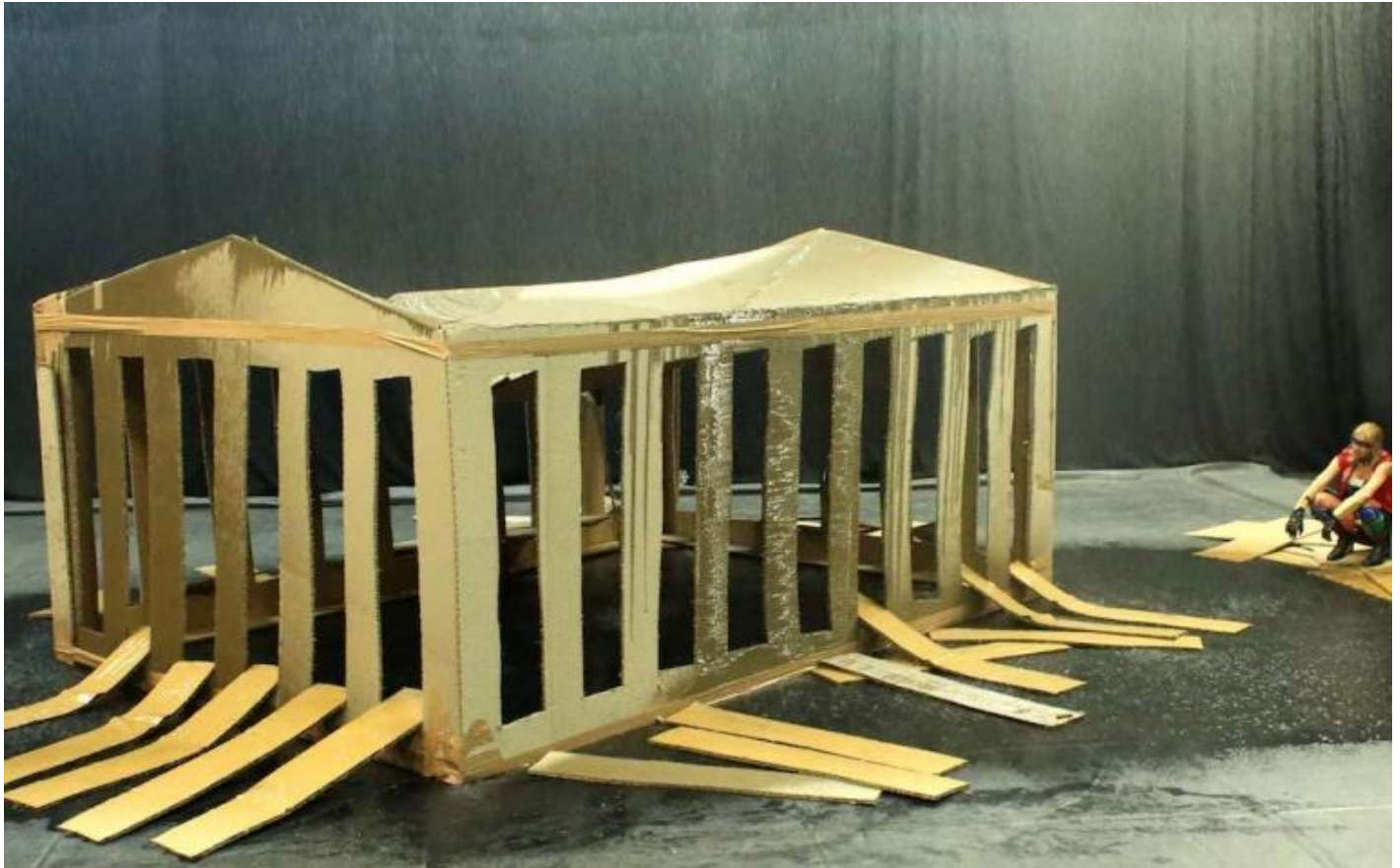
Phia Ménard, Maison-Mère, ph. Jean-Luc-Beaujault.

Alla fine, fra le macerie sature di un fumo che impedisce quasi del tutto la visione (non solo della scena), costretti ad affinare – tecnicamente – lo sguardo, ci rendiamo conto che lo spostamento profondo a cui Phia Ménard ci conduce con pazienza riguarda soprattutto la posizione e la prospettiva dello spettatore, nel teatro come nella vita: provando a smuoverci da una modalità di fruizione canonica in uso soprattutto nella ricerca, fondata sulla dimensione concettuale, analitica, interpretativa e intellettuale; a un coinvolgimento il meno mediato possibile, che mira a colpire su un piano soprattutto sensoriale o emotivo, non tanto o non solo per la suggestione degli “effetti speciali” ma per un lavoro sulla costruzione e manipolazione del tempo – su pause e durate, messe in posa e abbandono alla contingenza, caso e volontà –, che rende l'azione il campo in cui artista e pubblico momentaneamente convivono, partecipando insieme di un percorso interiore e scenico in continuo sviluppo.