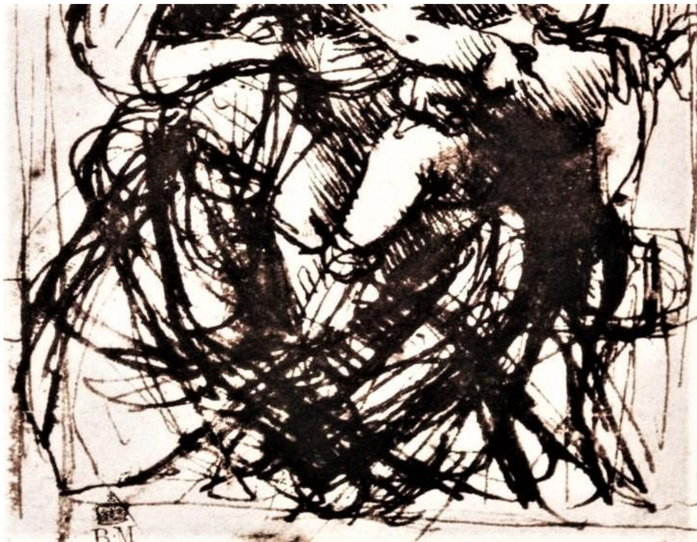
Leonardo Da Vinci, Schizzo per la madonna del gatto, 1478/81.

La necessità di verificare diverse soluzioni, di grandezza, di numero, di posizione e di forma di alcune parti o componenti di una composizione, sovrapponendole nello stesso disegno una sopra l'altra in trasparenza, oppure quella di rivedere, ritornare su di una decisione mutandone delle parti, che nella trattatistica vengono definiti "pentimenti", danno luogo ad un tipo di disegno in buona parte scarabocchiato e confuso, che invero, però, una inattesa forza espressiva, così spiccata da invogliare i pittori a non rimuovere o nascondere le correzioni, lasciando i propri disegni fluttuare tra queste sorprendenti indecisioni, come nel caso della serie dei disegni a penna in cui Leonardo raffigura diverse soluzioni relative alla posizione della testa della Madonna del gatto .