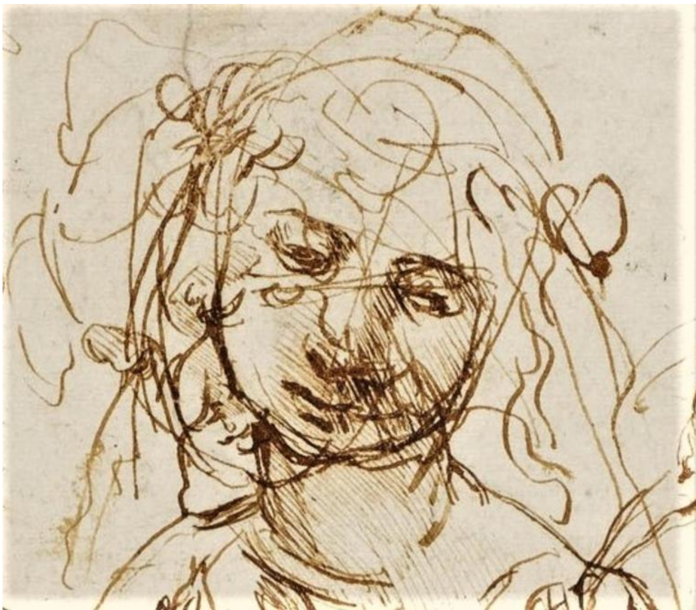
Leonardo Da Vinci, Madonna con bambino e Giovanni, 1778.