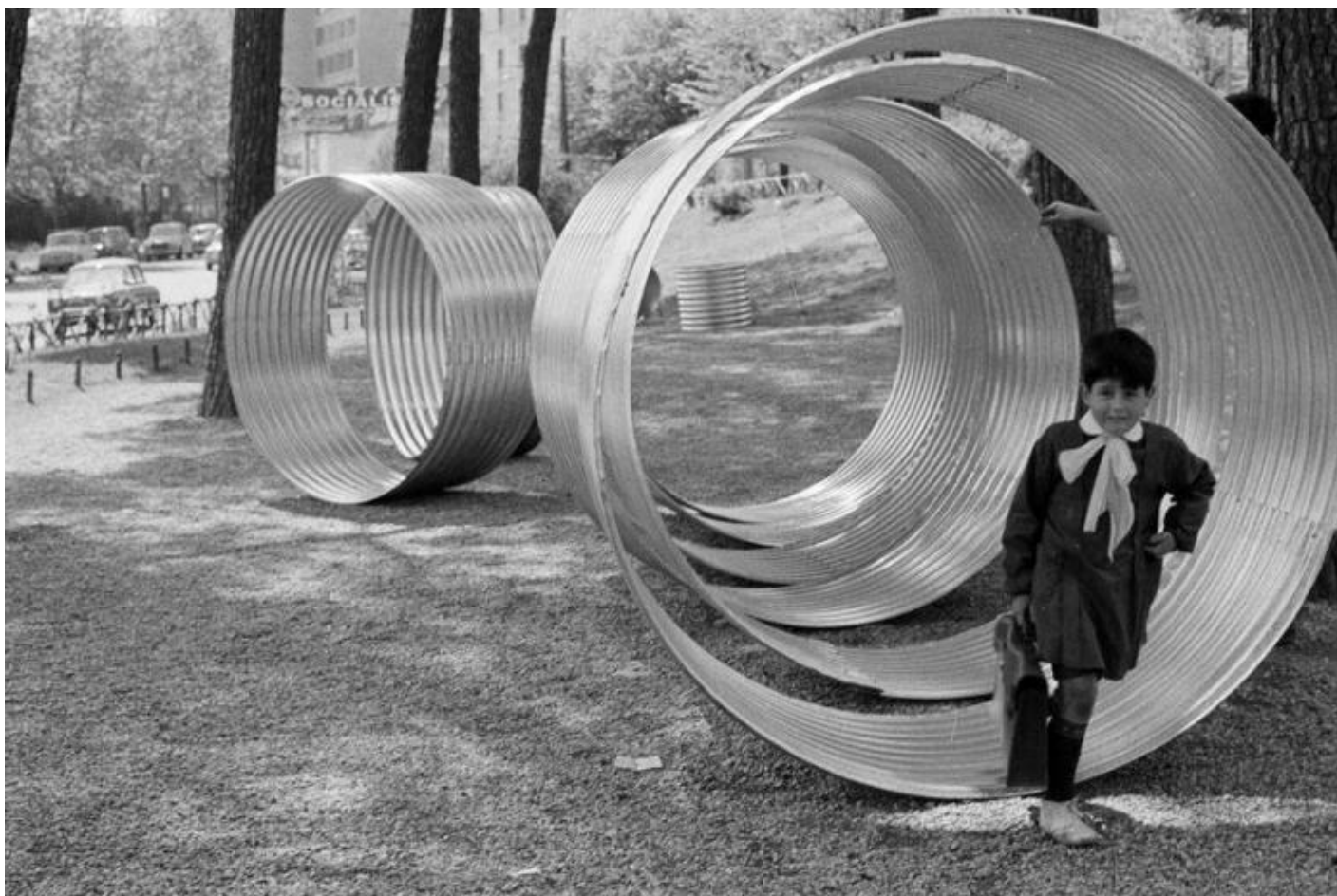
I Cilindri praticabili allestiti nel Parco Nomentano, Roma, 1968

Il 1° marzo 1969, a distanza di due mesi dall'azione dei Dodici cavalli vivi di Kounellis, Mattiacci entra nel garage di via Beccaria, il nuovo spazio di Sargentini, su un compressore arancione e blu e spiana della terra pozzolana per creare un percorso-sentiero vibrante e accidentato che si estende dall'ingresso all'interno. Leggendo oggi questo intervento in relazione con il coevo scenario earthworks americano, sembra che Mattiacci abbia fornito la propria risposta e critica alle grandi operazioni sul paesaggio compiute dagli artisti d'oltreoceano. Se alla base delle azioni di accumulazione, scavo, scaricamento, incisione, demarcazione condotte sul paesaggio dagli artisti americani vi è l'utilizzo di mezzi meccanici, Mattiacci nella sua azione trasforma il rullo compressore in una sorta di grande ready-made, ancora una volta un oggetto-giocattolo che depotenzia la tecnologia e conferisce "qualità misteriose" all'azione.