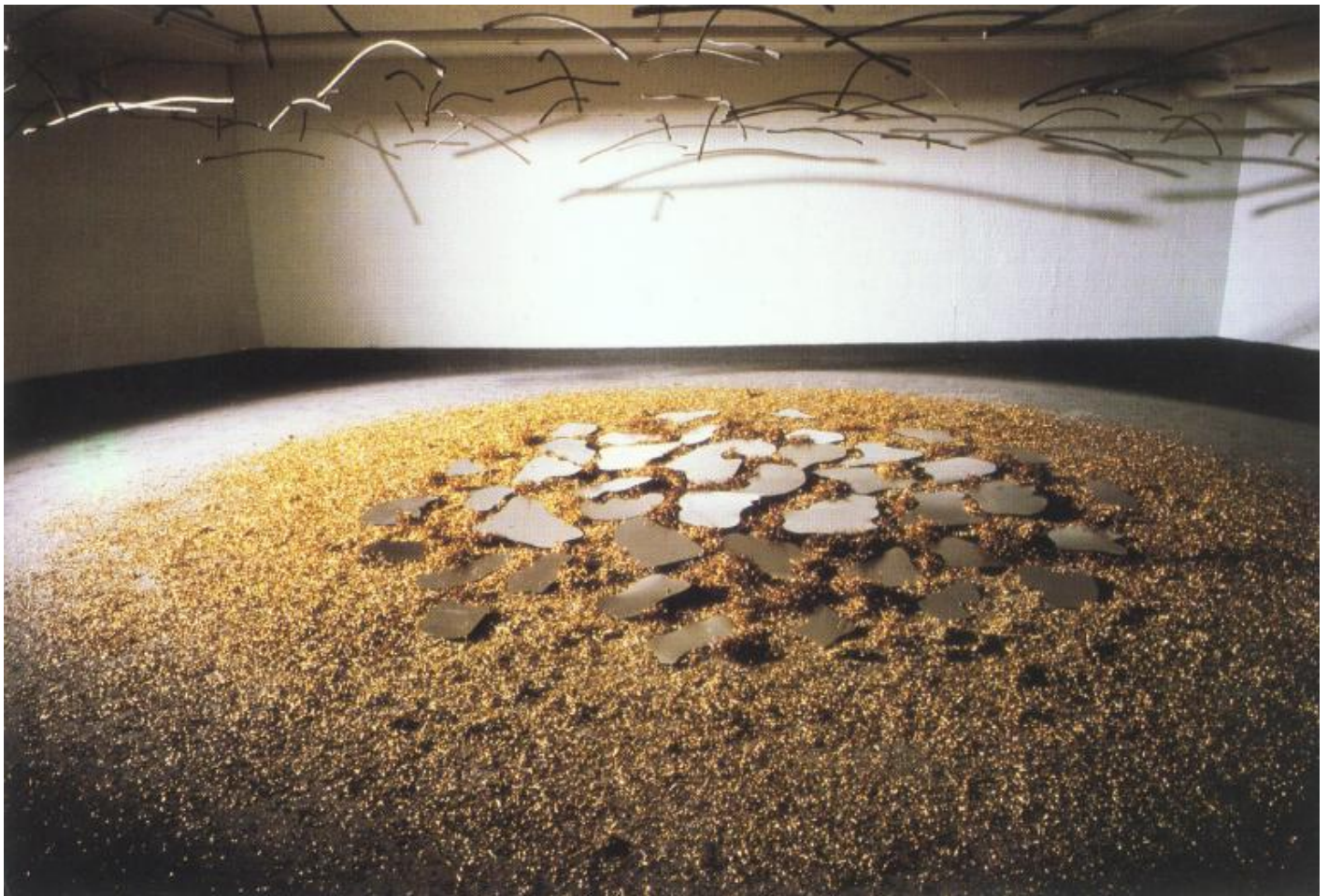
Alta tensione astronomica, 1984

A ragione Fabrizio D'Amico, che a Mattiacci ha dedicato pagine tra le sue più intense, ha letto queste riflessioni come rivelatrici di tanta scultura a venire, quando a partire dagli anni Ottanta nuovi interessi cosmico-astronomici rivitalizzano il suo rapporto con la materia, con l'immagine plastica, con l'idea di scultura.