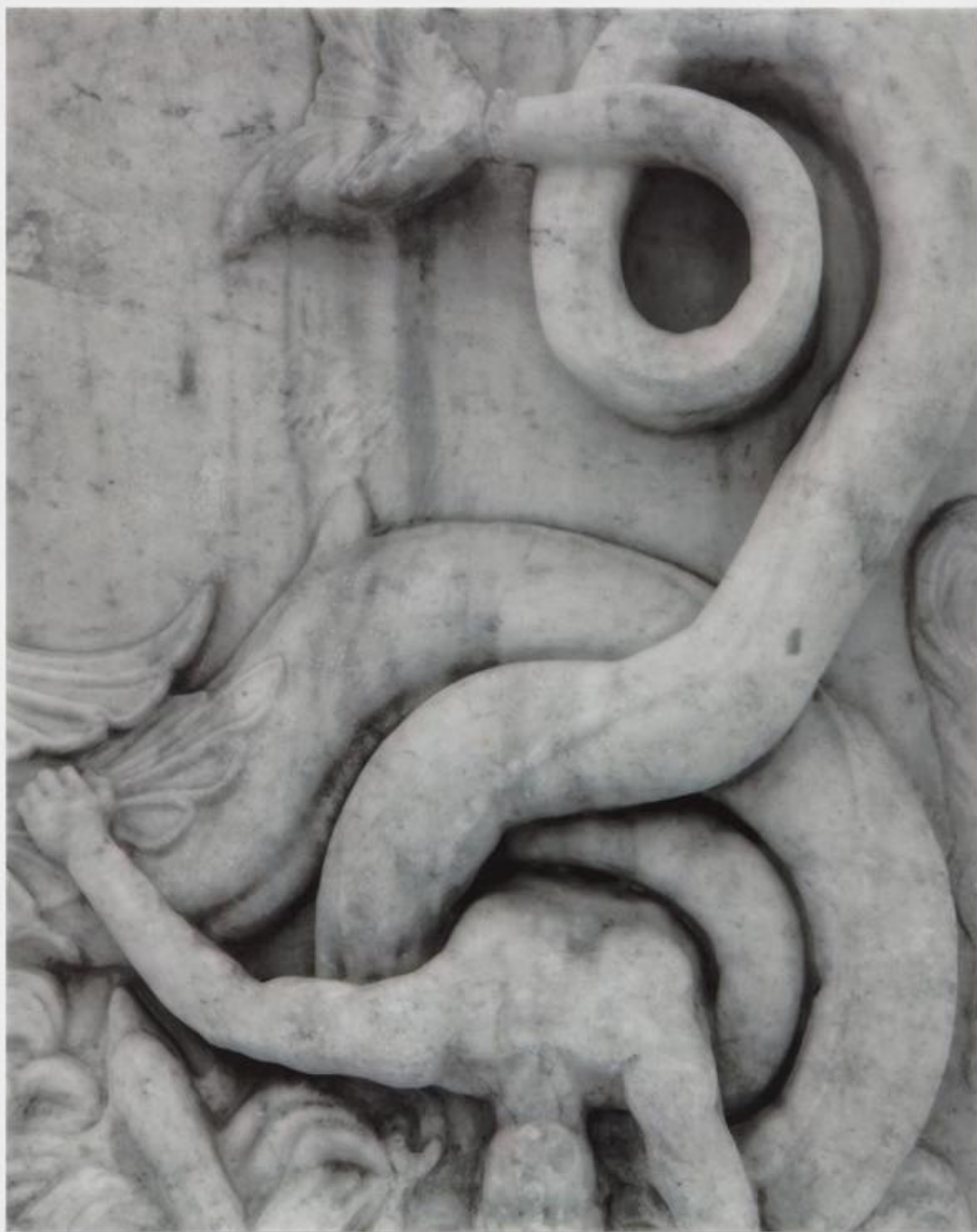
Untitled (9074), 2018 100 x 80 x 4 cm Fotografia stampata su marmo Su concessione del Ministero per i Beni e le Attività Culturali - Museo Archeologico Nazionale di Napoli.