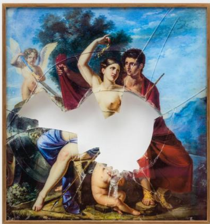
Untitled (9355), 2018 44 x 42 x 2 cm Fotografia stampata su vetro.

Sighicelli sembra invitarci a cogliere la spina e lasciare la rosa, facendoci avvolgere da un'ambiguità irrisolvibile che pure ci ammalia. Cosa stiamo guardando? Il trapezoforo è un fotografia stampata su marmo, un oggetto dove supporto e immagine si fondono, le venature della pietra traggono in inganno o forse rivelano qualcosa che era invisibile agli occhi, addomesticati dalla consuetudine. Il processo di hypermediacy aggiunge un livello di sofisticazione alle opere, evidenziando la compresenza di media diversi (pittura, scultura, fotografia, stampa etc.) intrecciati, di cui si perdono i confini specifici.