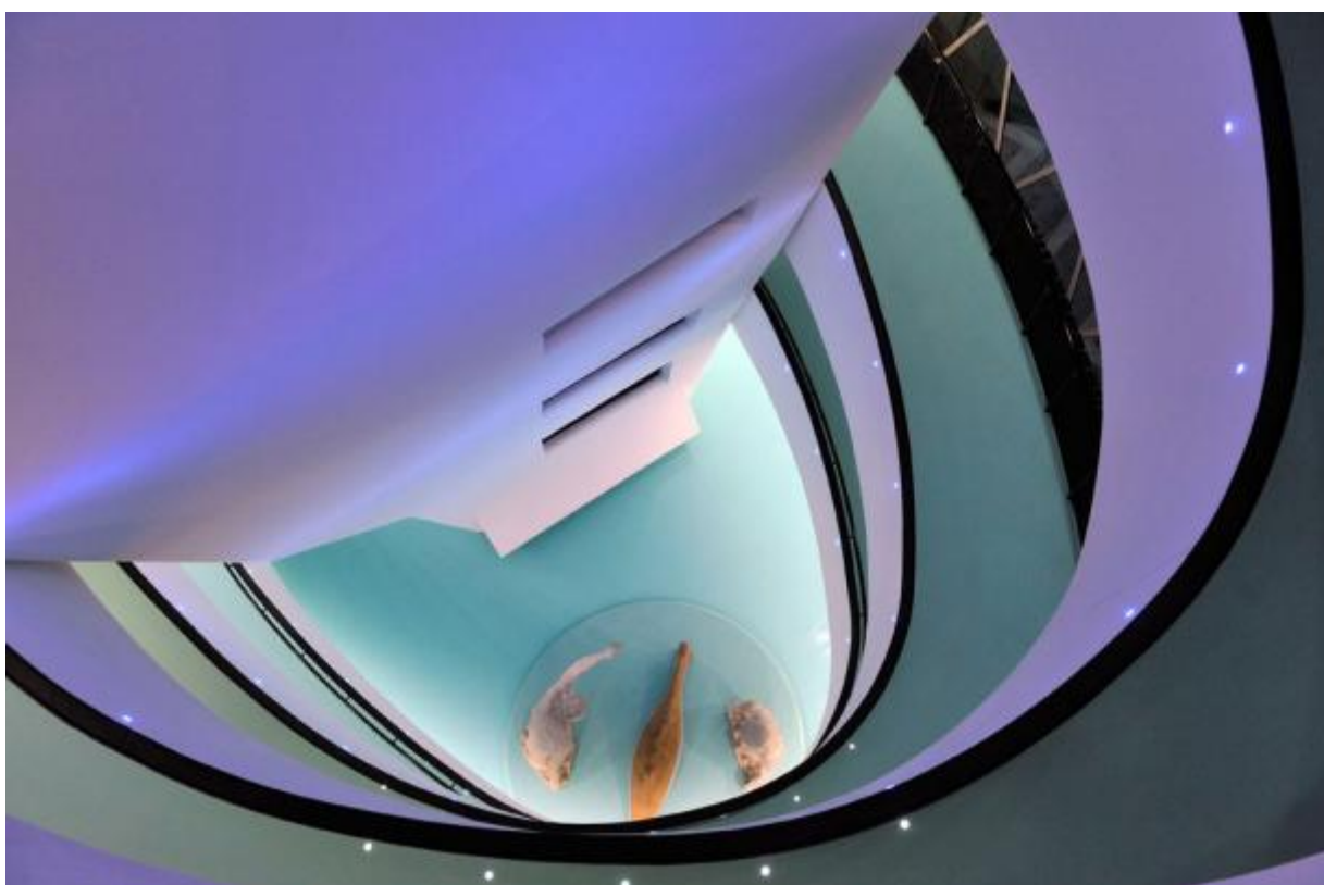
004 Museo del Novecento, Milano

Se continuiamo a tenere vivo questo spazio è grazie a te. Anche un solo euro per noi significa molto. Torna presto a leggerci e SOSTIENI DOPPIOZERO