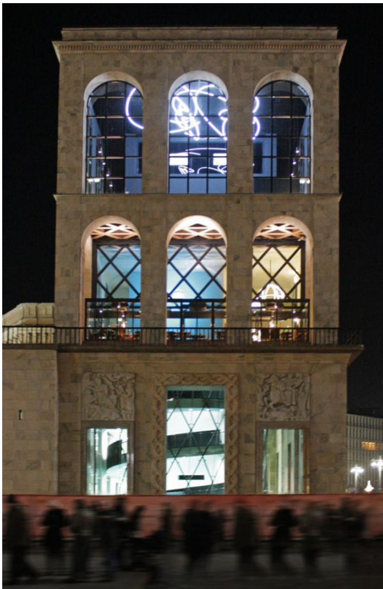
Museo del Novecento, Milano