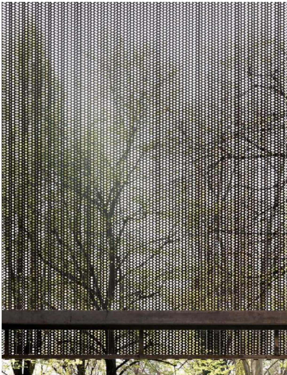
Studio Dordoni, Edificio per uffici, Milano