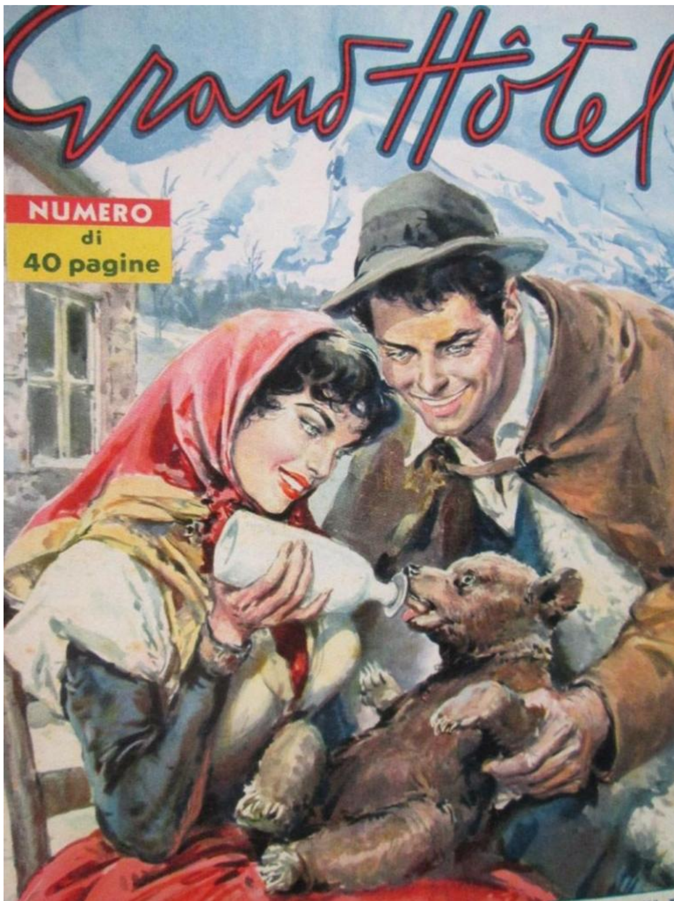
Walter Molino, L'orsetto sperduto , illustrazione di copertina per Grand'Hotel , 16 febbraio 1957.