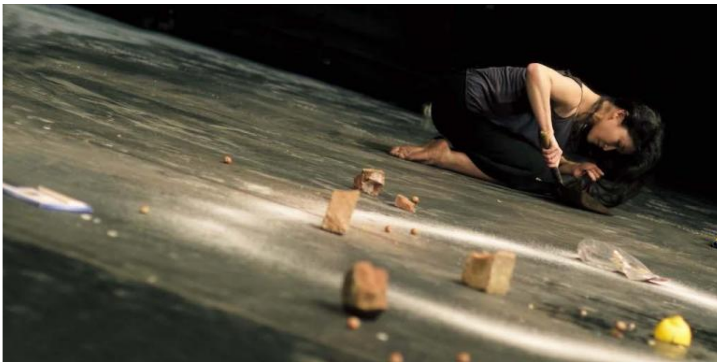
“Palermo Palermo”, 1989.

Nei suoi numerosi viaggi di produzione in tutto il mondo, che consistevano in residenze di ricerca e di creazione di alcune settimane in città e paesi che hanno co-prodotto i suoi spettacoli a partire dalla metà degli anni Ottanta (la prima fu Roma, nel 1985, per la produzione dello spettacolo Viktor ), Pina Bausch andava rigorosamente all'incontro dell'altro, senza mai stancarsi. I suoi spettacoli, d'altro canto, sembrano proprio parlare di questo suo desiderio di inclusione senza bisogno di ulteriori commenti come testimoniano storicamente i suoi programmi di sala, scarni e composti solo dai crediti dello spettacolo e da qualche fotografia.