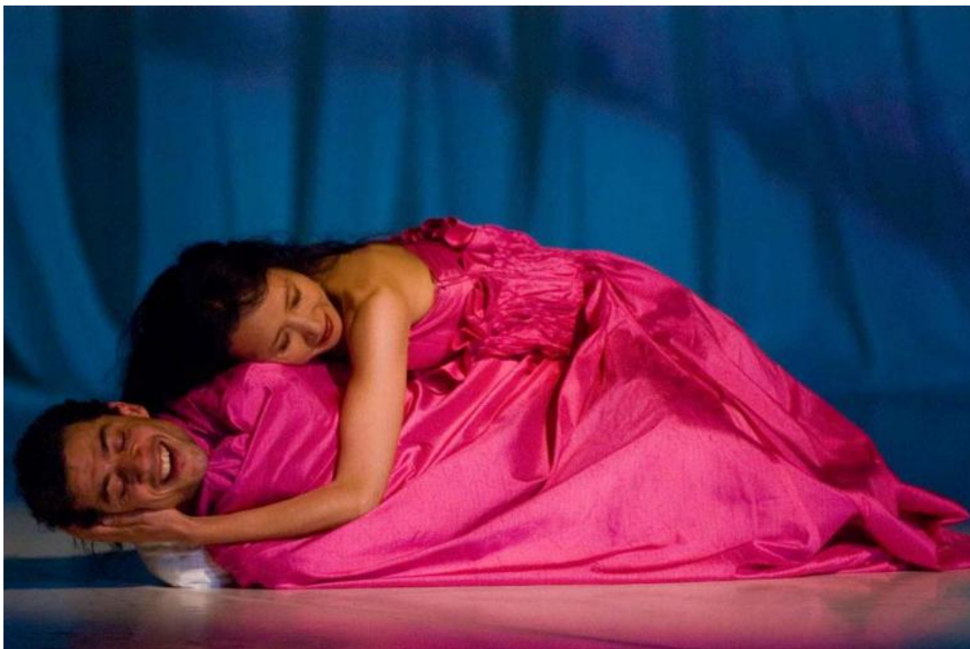
“Bamboo Blues”, 2007.

Eppure, la sua forza creatrice è stata tale che, per estremo, chiunque abbia varcato, foss'anche una sola volta, la soglia di un teatro è oggi parte della comunità allargata dei suoi eredi. La particolarità della sua fondamentale esperienza artistica risiede, in parte, nel fatto che da subito ha saputo porsi in modo tale da essere irrifiutabile. Nonostante le difficoltà di ricezione dei primi anni, quando nel giro di una manciata di stagioni Pina Bausch ha trasformato il tradizionale Ballett Wuppertal in una compagnia che sperimentava in maniera cross-disciplinare danza, teatro e opera, i lavori di Pina Bausch hanno avuto la qualità di chi è in grado di indurre un disarmo. Gli spettatori, la critica, la comunità artistica nel senso più esteso si sono dischiusi di fronte all'opera di Pina Bausch. E a dieci anni dalla sua morte Pina Bausch ancora non smette di incantare, l'eco del suo lavoro è trasversalmente presente nelle arti del contemporaneo, non solo nella danza e nel teatro. Della sua persona abbiamo mitizzato ogni aspetto, facendo del suo corpo di danzatrice e coreografa un corpus nel quale non ha spazio il cadavere che ancora tutti rifiutiamo, offrendo a questo suo ricordo di conseguenza l'alone del sacro.