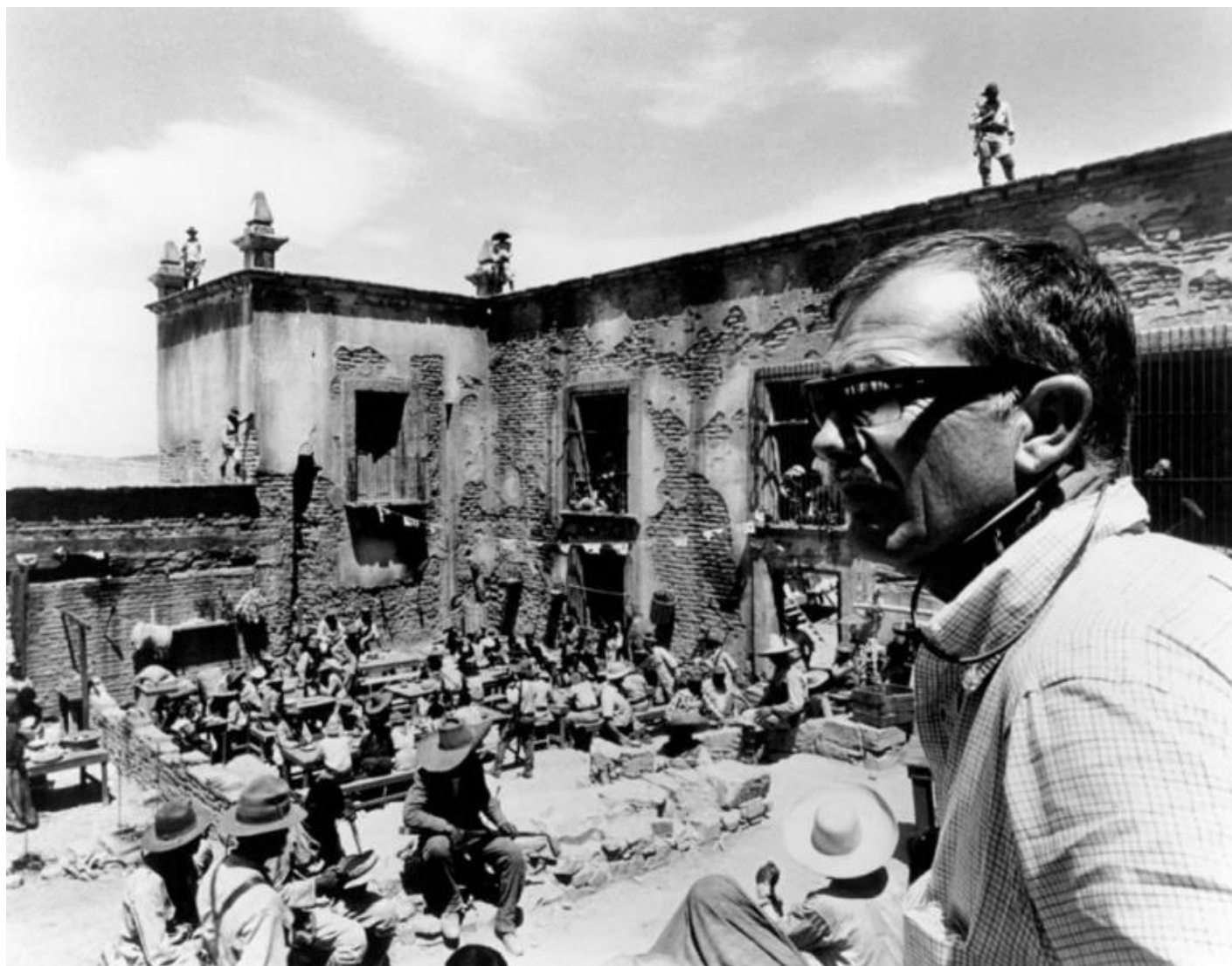
Sam Peckinpah sul set.

Ritornando solo per un attimo agli anni della sua prima uscita trascrivo un mio ricordo personale: The Wild Bunch , già negli anni '70 e prima delle proteste settantasettine, era film di culto tra estremisti di sinistra, in particolare nei vari (si chiamavano così) Servizi d'ordine. Ci sarebbe da riflettere su questa categoria allora diffusa e popolare ("il mio ragazzo è prima fila del servizio d'ordine...") ma qui ci interessa soltanto perché in sintonia con il tema vero del film: la violenza. Il sangue sgorga a fiumi, in The Wild Bunch . Ricordo che da ragazzini uscendo dal cinema contavamo i morti ammazzati. Peckinpah annuncia la morte sin dai titoli di testa. Con una morte insolita: quella di un temuto predatore. Uno scorpione viene sbranato dalle formiche. Un divertimento per i bambini straccioni che appariranno in quasi tutte le sequenze, sfondo costante di un mondo miserabile, ai confini estremi da tutto, sprofondata da sempre nel caos.