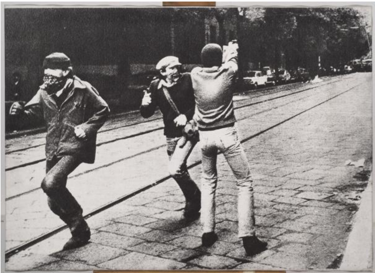
Mimmo Rotella, Scontro armato , 1980

Un diverso caso di prelievo e riuso dello scatto di via De Amicis si ritrova in Lui piange (1977), opera su tela emulsionata con interventi pittorici dell'artista toscano Gianni Bertini (1922-2010) che, a differenza di Rotella, modifica e riambienta la foto originaria attraverso un processo di montaggio, in cui immagini di natura e provenienza eterogenea vengono accostate, correlate, giustapposte, al fine di creare soluzioni visive inedite, altamente traumatizzanti. L'opera fa parte del ciclo Abbaco , titolo volutamente desueto scelto da Bertini per indicare il desiderio di ricominciare un discorso partendo dalla base, dall' abc , il cui fulcro centrale, seguendo le parole dell'artista, sia la rappresentazione del nucleo più elementare "l'uomo, la donna e il bambino in rapporto a una società dove l'orrore è quotidiano". La foto degli scontri milanesi, al pari delle altre immagini di catastrofi o guerre introdotte da Bertini in questa serie, viene ad assumere un valore assoluto di violenza, autodistruzione, morte.