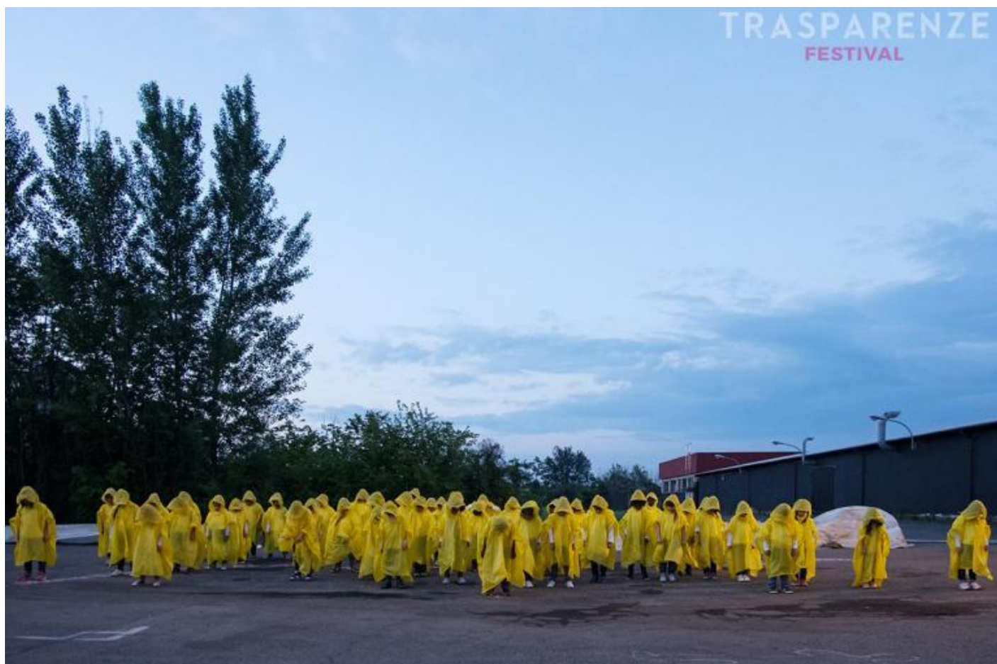
I bambini di “Moby Dick”, Teatro dei Venti, ph. Chiara Ferrin.

In effetti, questo titolo Crepa continua sotterraneamente a ispirare molti dei lavori che questa edizione di Trasparenze ha selezionato. Sono molti gli spettacoli che hanno un qualche legame, discreto o diretto, con la morte o la finitezza e la necessità di affrontarla. Si possono menzionare, al riguardo, almeno quattro dei lavori ospitati dal festival. Si può cominciare da Pragma di Teatro Akropolis, che evoca con una pantomima senza parole lo sprofondamento nell’Ade di Persefone, l’incontro di questa con la madre Demetra e la nascita di Dioniso, divinità in cui gli opposti della cura e della distruzione coincidono. Si può poi passare a Divine di Danio Manfredini, riscrittura del romanzo Nostra signora dei fiori di Genet, popolato da travestiti e prostitute che muoiono o si consumano per amore, e allo stesso Moby Dick di Teatro dei Venti , dove la caccia alla fantastica balena bianca si conclude con un naufragio della nave Pequod e una discesa nell’abisso. Infine, si può ricordare Un.Habitants di Caterina Moroni: una performance ambientata in un cimitero, in cui 20 spettatori alla volta sono messi in contatto con i morti che sono lì sepolti, o che forse dormono per risorgere in futuro, attraverso delle cuffie che trasmettono delle istruzioni e delle riflessioni che i defunti vogliono lasciare ai vivi.