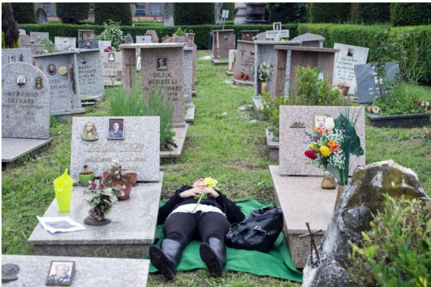
“Un.Habitants” di Caterina Moroni, ph. Chiara Ferrin.

Non sarebbe allora peregrino supporre, entro questa prospettiva, che questa edizione di Trasparenze suggerisca che il teatro possa essere definito come una “arte del crepare”, nel doppio senso di arte che spezza il comodo guscio di noce delle nostre sicurezze e che fa da tramite per raggiungere una buona morte. Come infatti ci sono molti modi e stili di vita, così ci sono altrettanti modi e stili del morire. Se immaginiamo di volare sulla schiena di un grande uccello e di planare sopra tutta la terra abitata, osserveremmo una umanità variegata e mai uniforme. Alcuni esseri umani muoiono così come sono vissuti: in modo piatto e senza intensità, centellinando i loro affetti e i loro pensieri con un cucchiaino da caffè. Altri sono più generosi ma disperdono le loro energie, lasciando così dietro di sé solo un ricordo di un’esistenza disordinata e confusa. Altri ancora nuocciono e fanno del male, o vivono per distruggere. La casistica potrebbe continuare potenzialmente all’infinito, tanto che il nostro ipotetico uccello non ce la farebbe a un certo punto più a proseguire nel suo volo di ricognizione e stramazzerrebbe stanco in basso, sulla terra ruvida o dentro un segmento dell’oceano.