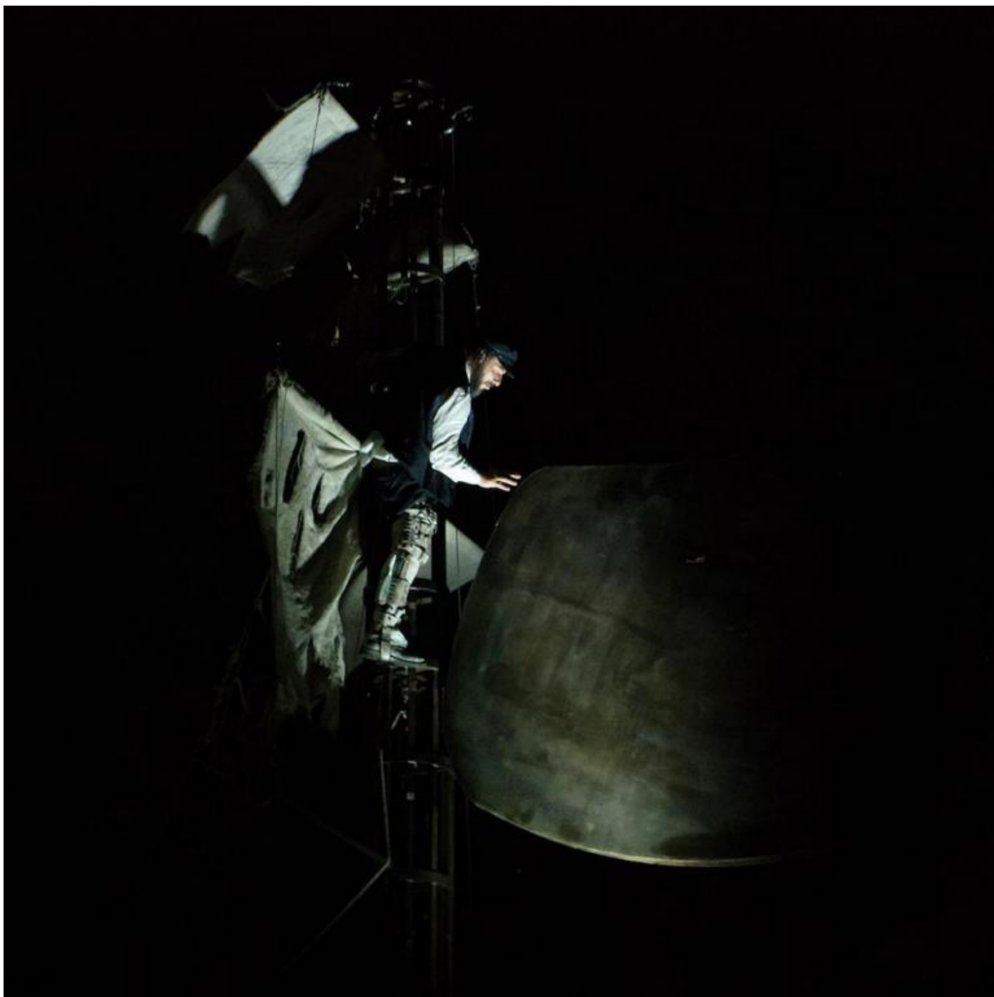
“Moby Dick”, Teatro dei Venti, ph. Chiara Ferrin.

Questa importanza della delicatezza a teatro permette di evitare un possibile equivoco su quanto si diceva all'inizio. Quando si supponeva che la bellezza non si lascia toccare dai deboli di spirito, non si intendeva dire che allora il bello lo esperisce chi esercita la forza e la violenza. Ci vuole dopo tutto più coraggio, studio e creatività per dare o ricevere una carezza che per commettere atrocità su scala planetaria. Anche i dementi e gli imbecilli sono capaci di strangolare, accoltellare, bombardare, squartare, torturare, calciare, violentare, dissanguare, sterminare, segregare, e via dicendo con altri verbi attinenti al lessico dell'orrore. Gli atti delicati di cui è capace il teatro sono resi possibili, invece, solo tramite un lavoro continuo, congiunto, a volte disperato e sempre pieno di difficoltà degli artisti col loro pubblico, che spesso rasenta la frustrazione e il fallimento. Ma se non è del tutto assurdo pensare che questo sforzo comune conduca a una sorta di eternità, il rischio risulta essere bello e il tormento o l'amarezza che esso porta con sé sembra apparire più dolce di ogni delizia terrena.