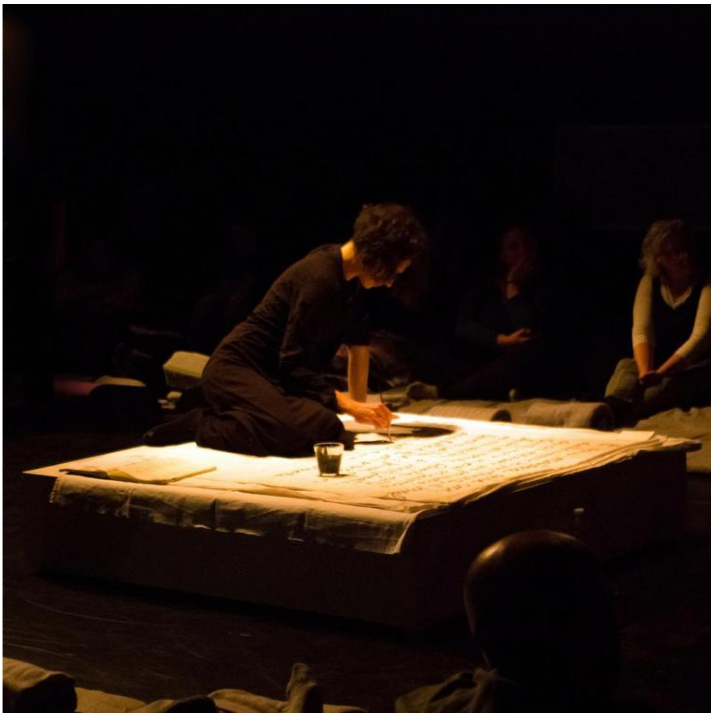
“Elementare”, Collettivo Amigdala