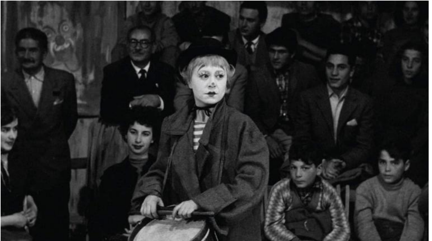
Giulietta Masina ne “La strada” (1954).

Niente e nessuno è più nudo di quella maschera reinventata dal film, che costruisce e ferma la visione, dilatandola, come uno spazio vuoto, muto eppure eloquente. E così, soprattutto in quel punto, ma anche altrove, Dumbo non ci impressiona soltanto per gli effetti speciali, ma per la particolare forma di “empatia” tra umani e animali che il film persegue. Possiamo allora indugiare su quell’empatia, perché forse in essa lavorano gli aspetti più riusciti del film, e dunque vale la pena di considerarla meglio. Dumbo è un lavoro del 2019, vale a dire nato da un’epoca, per esempio, in cui non si guarda più con indifferenza a un circo in cui sono tenuti e maltrattati degli animali; è un mondo in cui l’ecologia (ne parla Scaffai in un suo libro ) è diventata non solo uno dei saperi, ma anche una relazione narrativa e identitaria tra le più diffuse. Un mondo che sa che potrebbe essere l’ultimo a poter vedere, realmente, gli elefanti, «il loro carattere, il modo in cui si comportano e tengono unita la famiglia», persino il modo in cui si divertono a fare gli scemi , come ci fa considerare uno dei saggi più belli usciti lo scorso anno: Al di là delle parole , di Carl Safina.