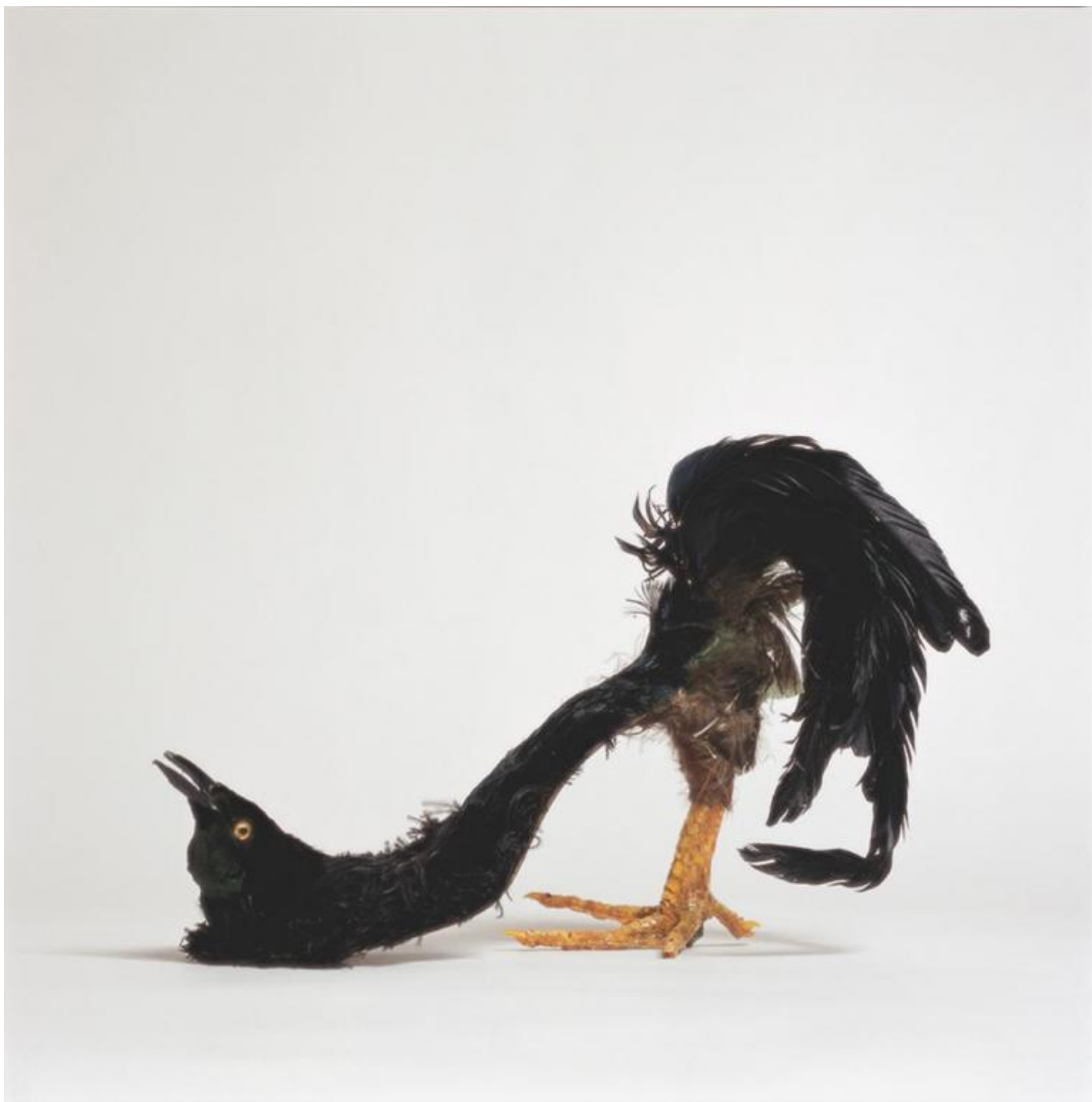
Birgit Jürgenssen Netter Raubvogelschuh / Bella Scarpa-Rapace, 1974-75 Metallo, piume, zampa di gallina Cm 30 x 23 x 13 Estate Birgit Jürgenssen (s9)

L'elemento organico si innesta nei simboli rassicuranti di una femminilità preordinata e li tramuta in organismi inquietanti, il quotidiano si mescola con il letterario e con la provocazione: Schwangerer Schuh ( La scarpa incinta ) del 1976 è un assemblaggio che ricorda certe metamorfosi alla Cronenberg, mentre Nest ( Nido , 1979) e Brautkleid ( Il vestito da sposa , 1979) rimandano a un immaginario surrealista più smaccato, o ancora il celebre Hausfrauen – Küchenschürze ( Grembiule da cucina da casalinghe , 1975), esposto alla collettiva voluta da Valie Export MAGNA – Femminismo: arte e creatività , tenutasi presso la Galerie nächst St. Stephan di Vienna nel 1975, diventata una delle opere simbolo del femminismo, un'icona di sapore pop che demolisce con ironia la figura della casalinga come angelo del focolare ma che mantiene un sottotesto