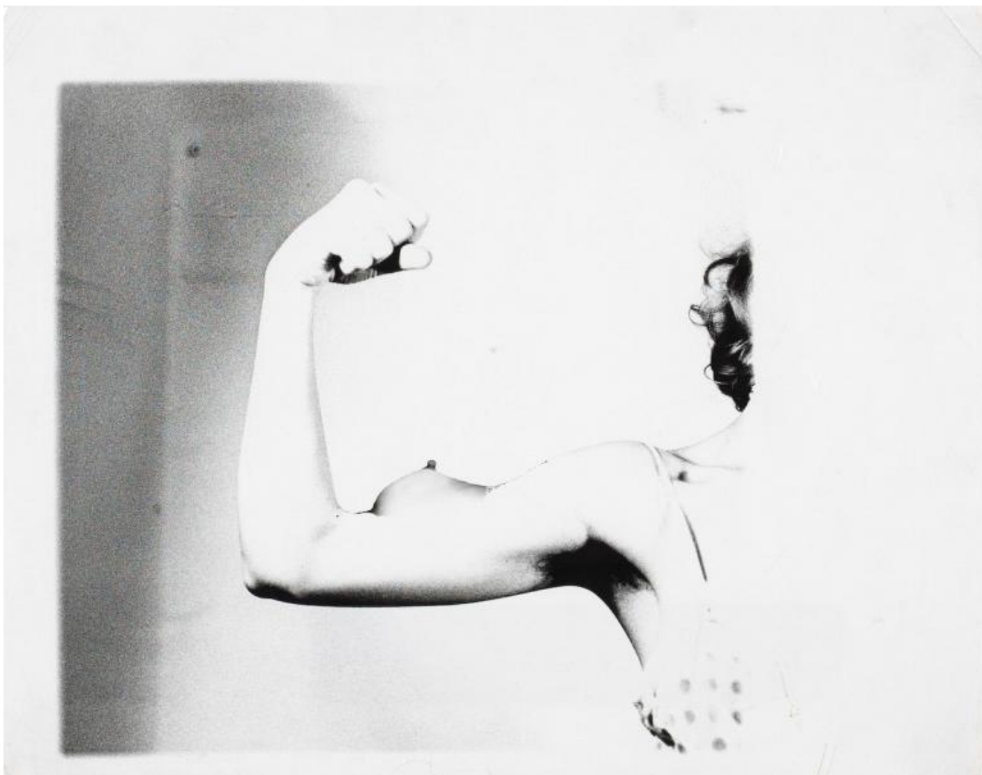
Birgit Jürgenssen Ohne Titel / Senza titolo, 1979 Fotografia in bianco e nero su carta baritata Cm 24 x 30 Estate Birgit Jürgenssen (ph23)