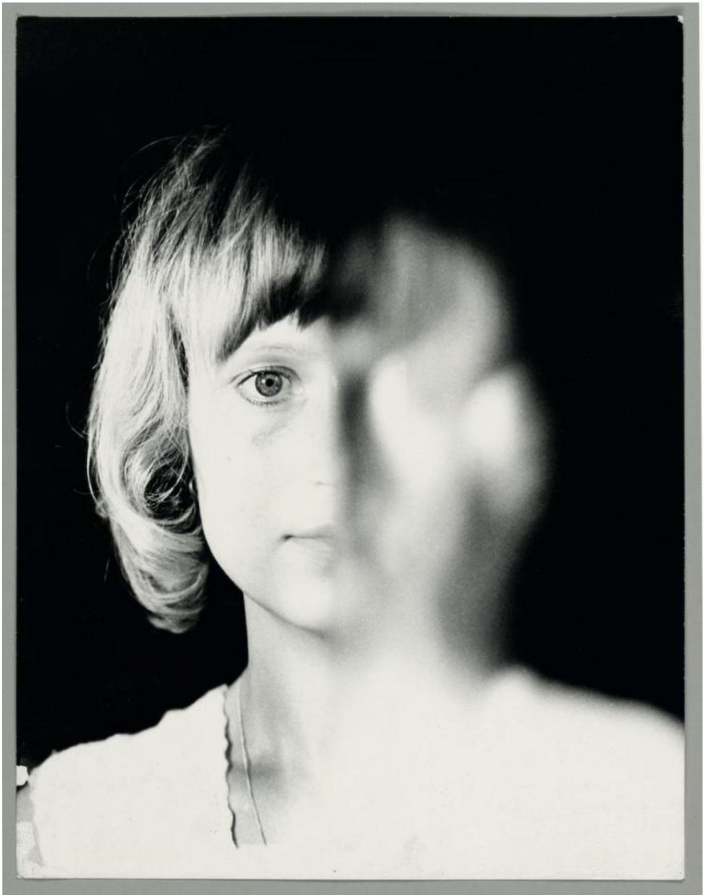
Birgit Jürgenssen Ohne Titel / Senza titolo, 1972 Materiale fotografico inedito Cm 24 x 18 Estate Birgit Jürgenssen Courtesy Galerie Hubert Winter, Vienna © Estate Birgit Jürgenssen by SIAE 2019.