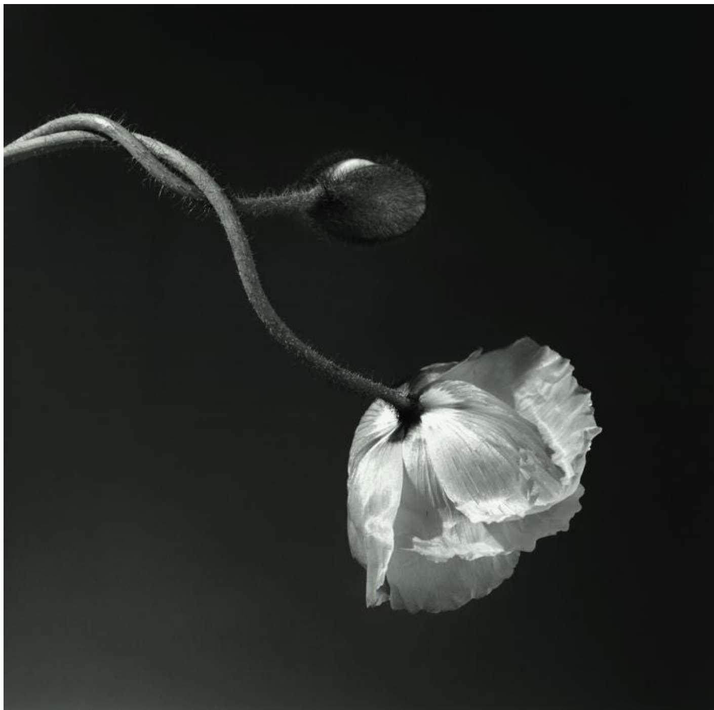
Poppy , 1988.

alcune immagini, una certa assonanza alla cultura partenopea (è stata organizzata dal gallerista Lucio Amelio la prima mostra personale dell'artista a Napoli nel 1984). Molto suggestivi, ad esempio, gli incroci tra i prestiti del Museo Archeologico Nazionale di Napoli e alcuni scatti di Mapplethorpe che sono rivisitazioni contemporanee di un canone di bellezza fondato sulle proporzioni, le geometrie delle pose, l'incanto del disegno scultoreo-fotografico, come nello splendido nudo che ritrae la modella-culturista Lisa Lyon (1980) china a mostrare schiena, glutei e gambe, come fosse una Venere acefala e priva di braccia o il sofisticato torso Dennis Speight (1983); o, ancora, le fotografie in cui il corpo che danza è protagonista assoluto ( Philip , 1979).