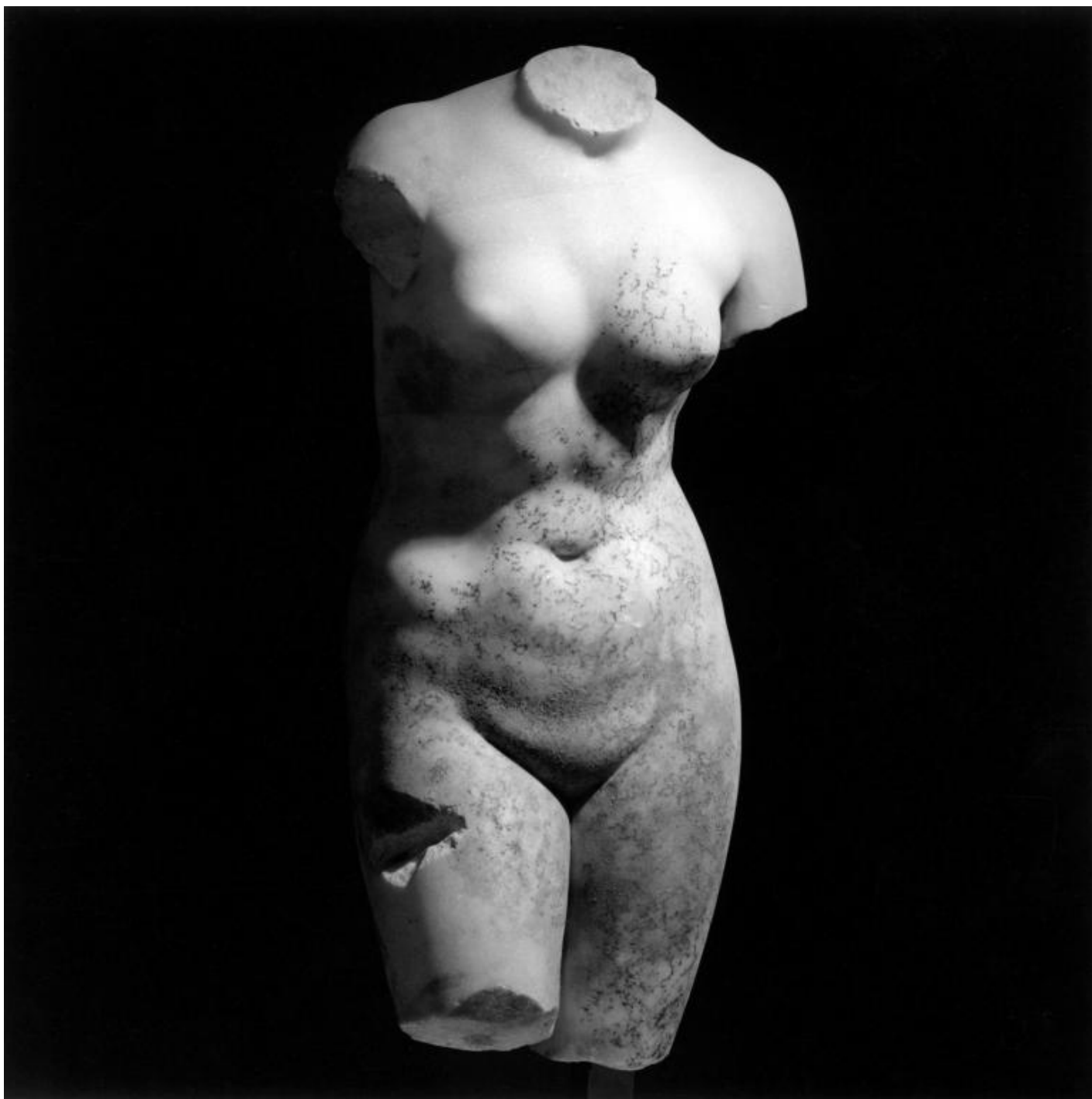
Female torso, 1978.