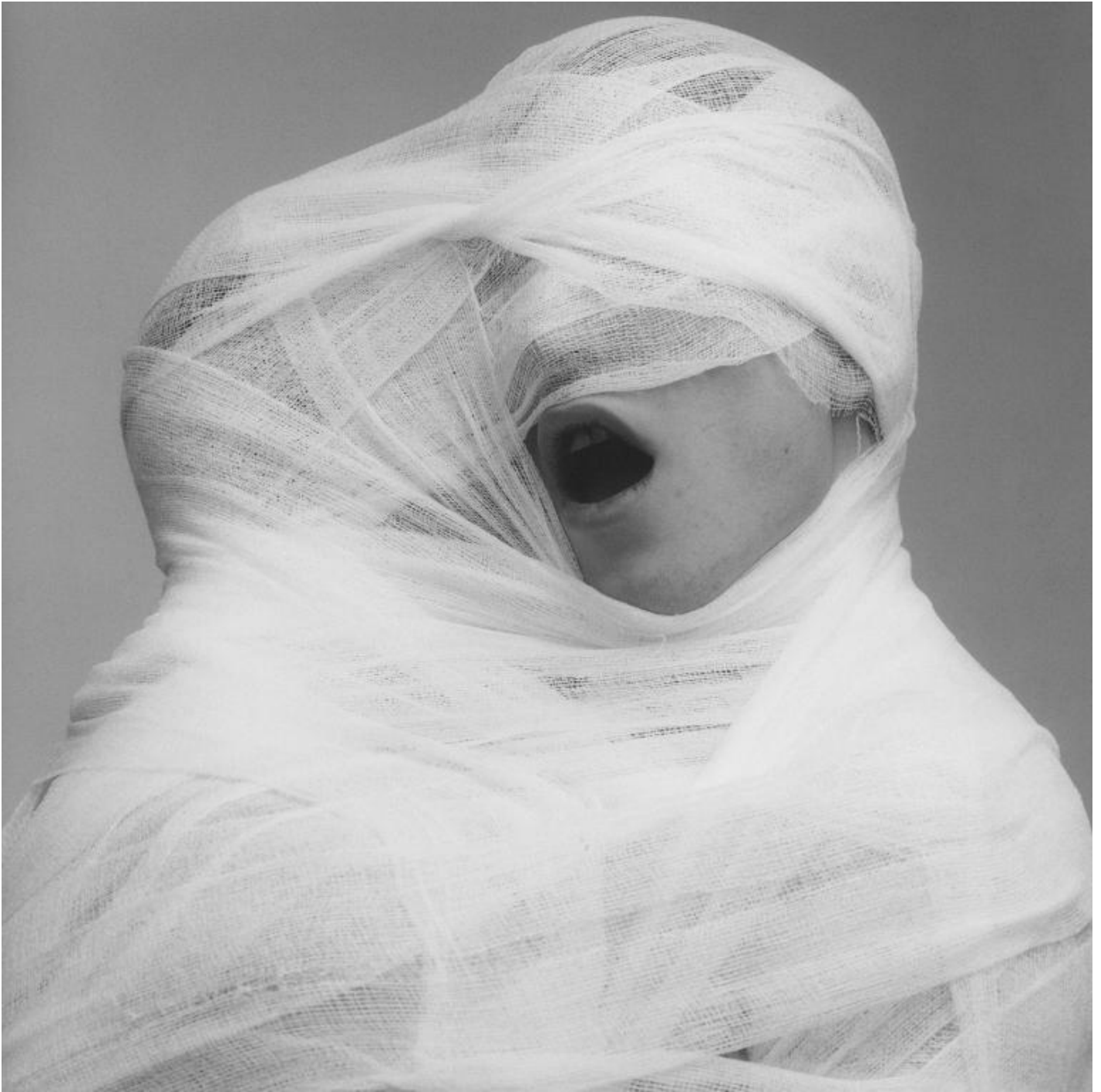
White gauze, 1984.