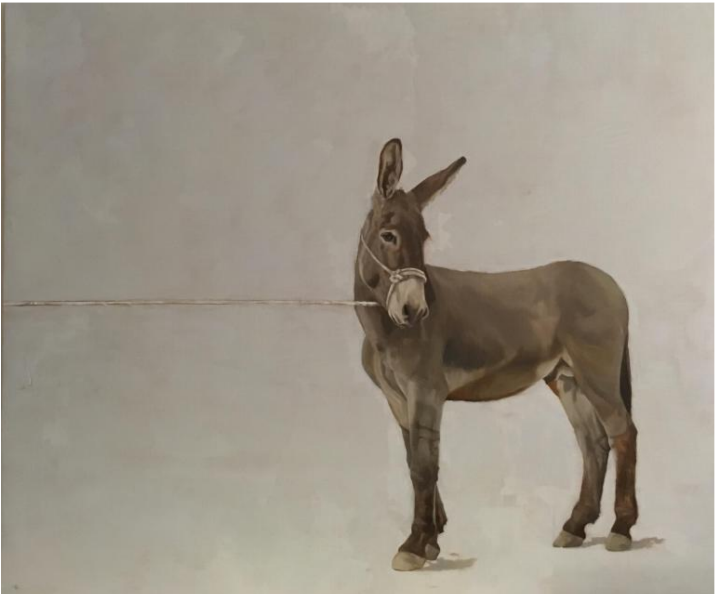
Marco Bettio, Un asino non è un cavallo, 2016, Olio su lino, cm 100x120, Collezione privata Courmayeur.

Trattare l'asino non solo come strumento da lavoro, ma – se non proprio come compagno – almeno come “vicino” ci consente di capirne meglio la natura. Credo che la grande domanda che noi possessori di asini ci facciamo sia: come fa un animale a essere così? Paziente al limite dell'indifferenza, ma insieme consapevolissimo di tutto quello che gli sta intorno.