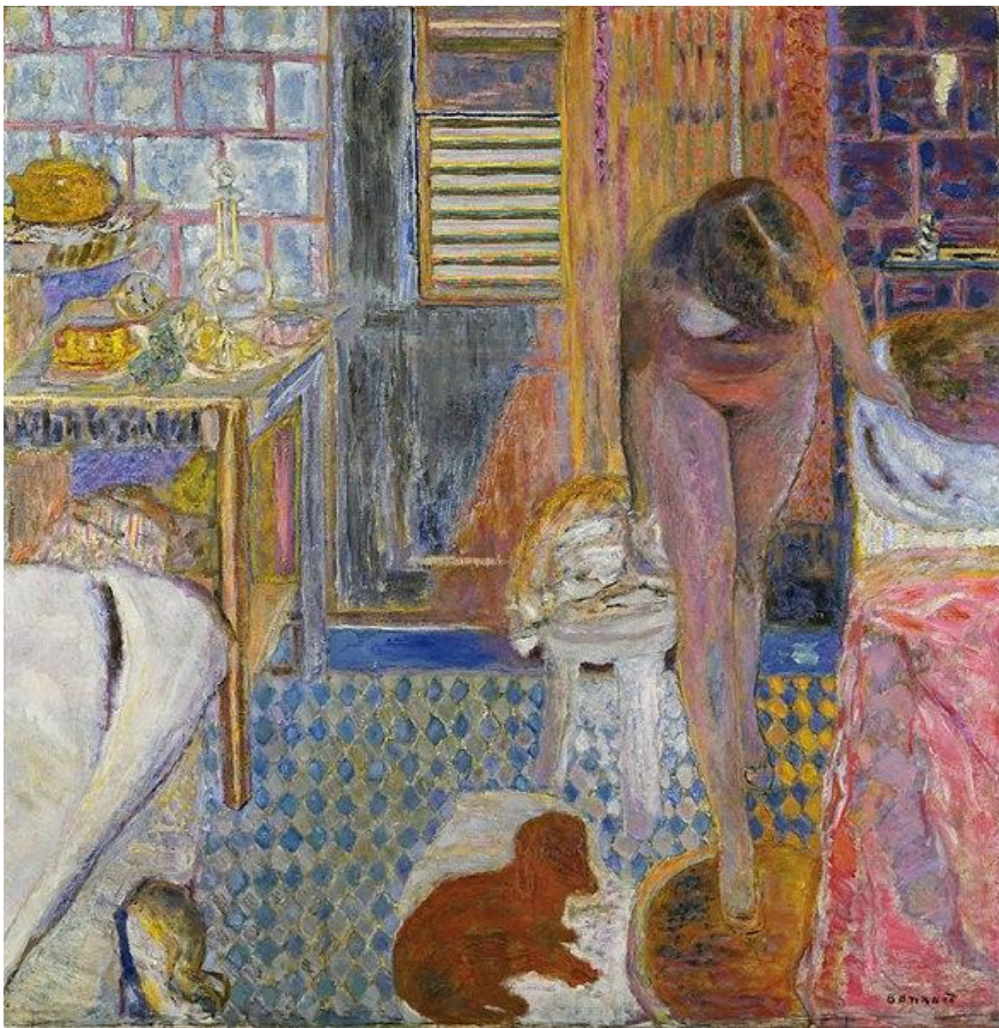
Pierre Bonnard, The bathroom, 1932.

È il condizionamento dello sguardo che gli sta a cuore, unico strumento per cogliere ciò che è dentro insieme a ciò che si vede. Alla Biennale di Venezia del 1926 si presenta con La Cheminée (1916), dove il fatto che l'immagine che vediamo sia in uno specchio dove né il pittore né noi appariamo ci obbliga o ad assumere la posa che è nel quadro o a sospendere il patto di finzione. In entrambi i casi il quadro parlerà a noi più che se c'invitasse alla pura contemplazione.