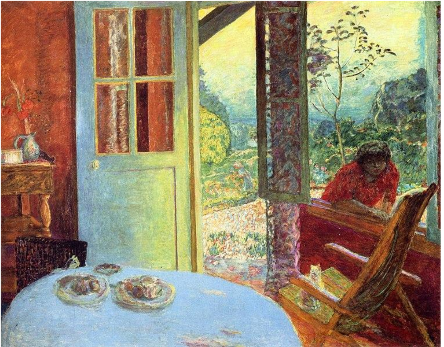
The diningroom in the country, Pierre Bonnard, 1913.

La mostra insiste inesorabilmente sulla scansione temporale e sulle occasioni esterne (i viaggi, la morte della madre, il tradimento di Marthe con Renée Montchaty), secondo il gusto del biografismo e dell'aneddotica tipico della critica anglosassone, ma ciò che colpisce di più qui è la straordinaria continuità dell'esperienza di Bonnard, che effettivamente lavora sempre sugli stessi temi e con la stessa tecnica.