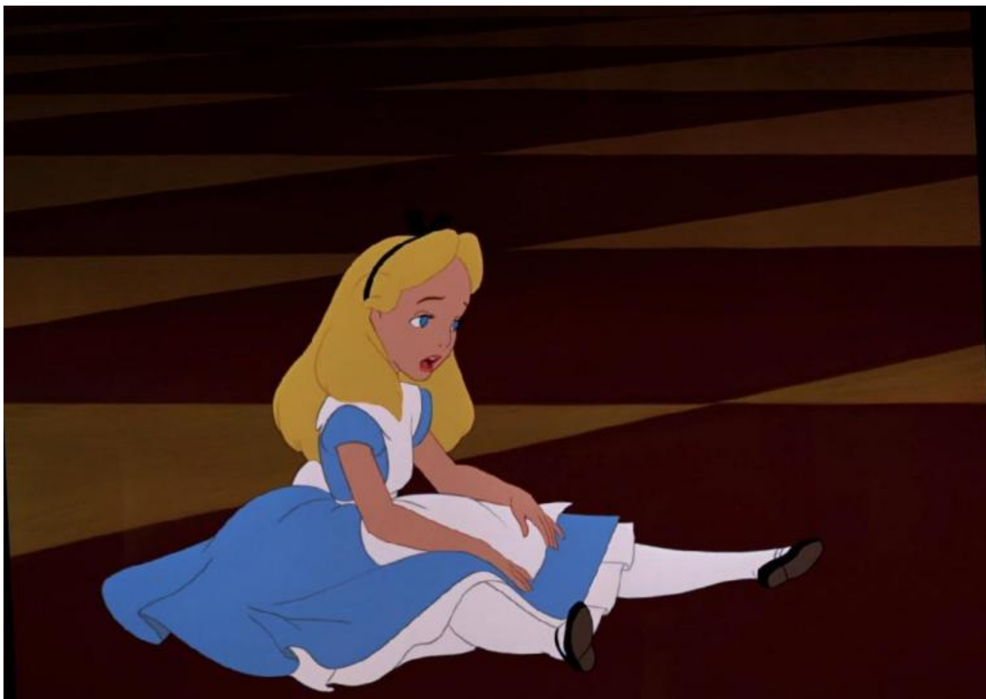
“Alice nel paese delle meraviglie”.