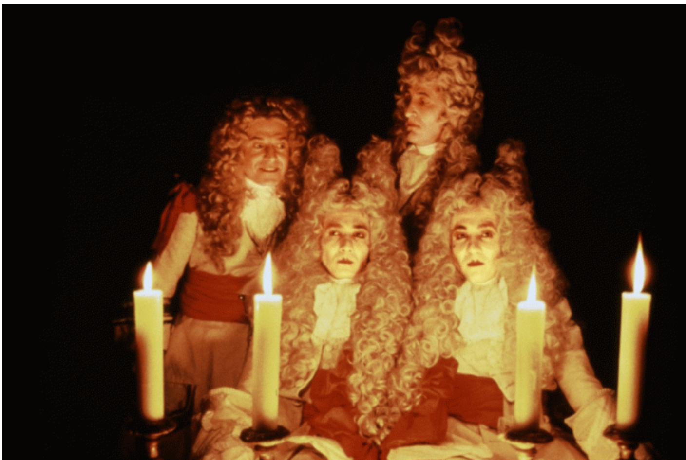
“I misteri del giardino di Compton House”.