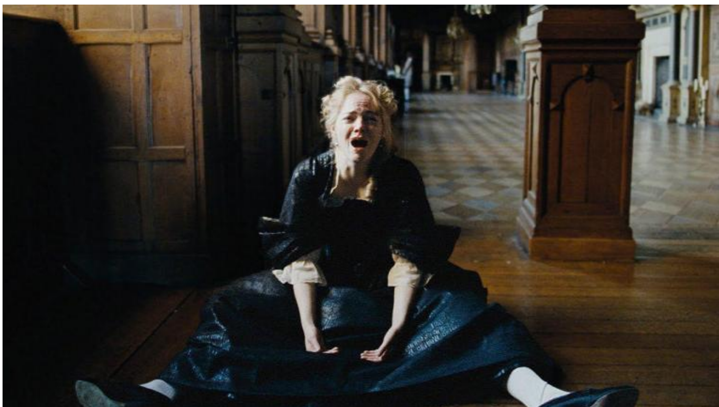
Emma Stone ne “La Favorita”.