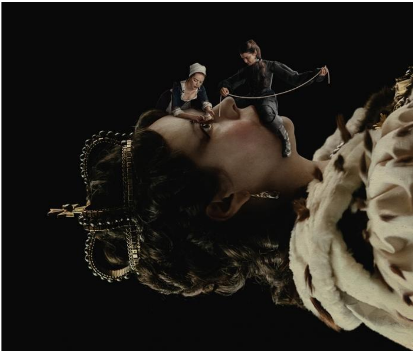
Particolare della locandina del film.