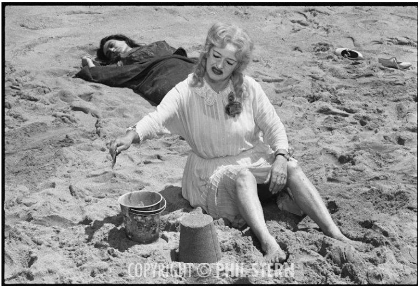
Bette Davis in “Che fine ha fatto Baby Jane?”.