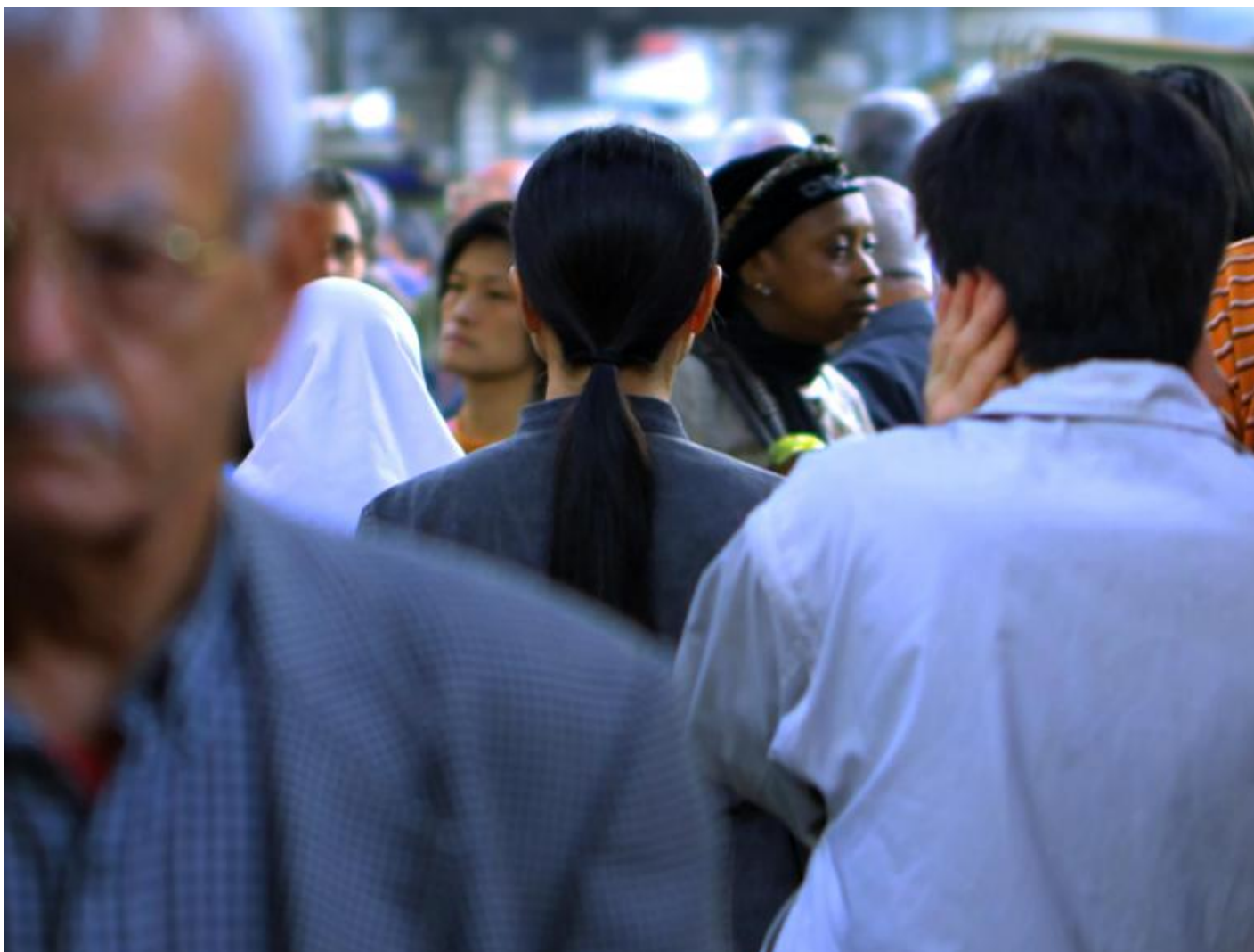
MAXXI, The street , Kimsooja.

La strada è una mostra da vedere, anche due volte: la successione incalzante delle opere, volutamente estenuante, conduce il pubblico verso dimensioni, spazi e tempi nuovi, talvolta imprevedibili, che pure mimano un movimento continuo di crocevia, luoghi e identità, familiari e non, un po' come avviene con An Embroidery of Voids di Daniel Crooks dove l'osservatore è portato a vivere il movimento fluido della telecamera attraversando un infinito corridoio urbano di scorci e angoli cittadini avvertendo insieme un effetto ipnotico e straniante. Attraversando la mostra, vedendo, ascoltando e sentendo 'fisicamente' nelle opere tutta la dimensione umana della strada, si osserva quanto proprio nelle strade, in ogni latitudine, le tensioni, anche quelle apparentemente minime, siano spesso portate all'estremo e quanto l'immaginazione e la creatività abbiano ancora il potere di trasformare e muovere.