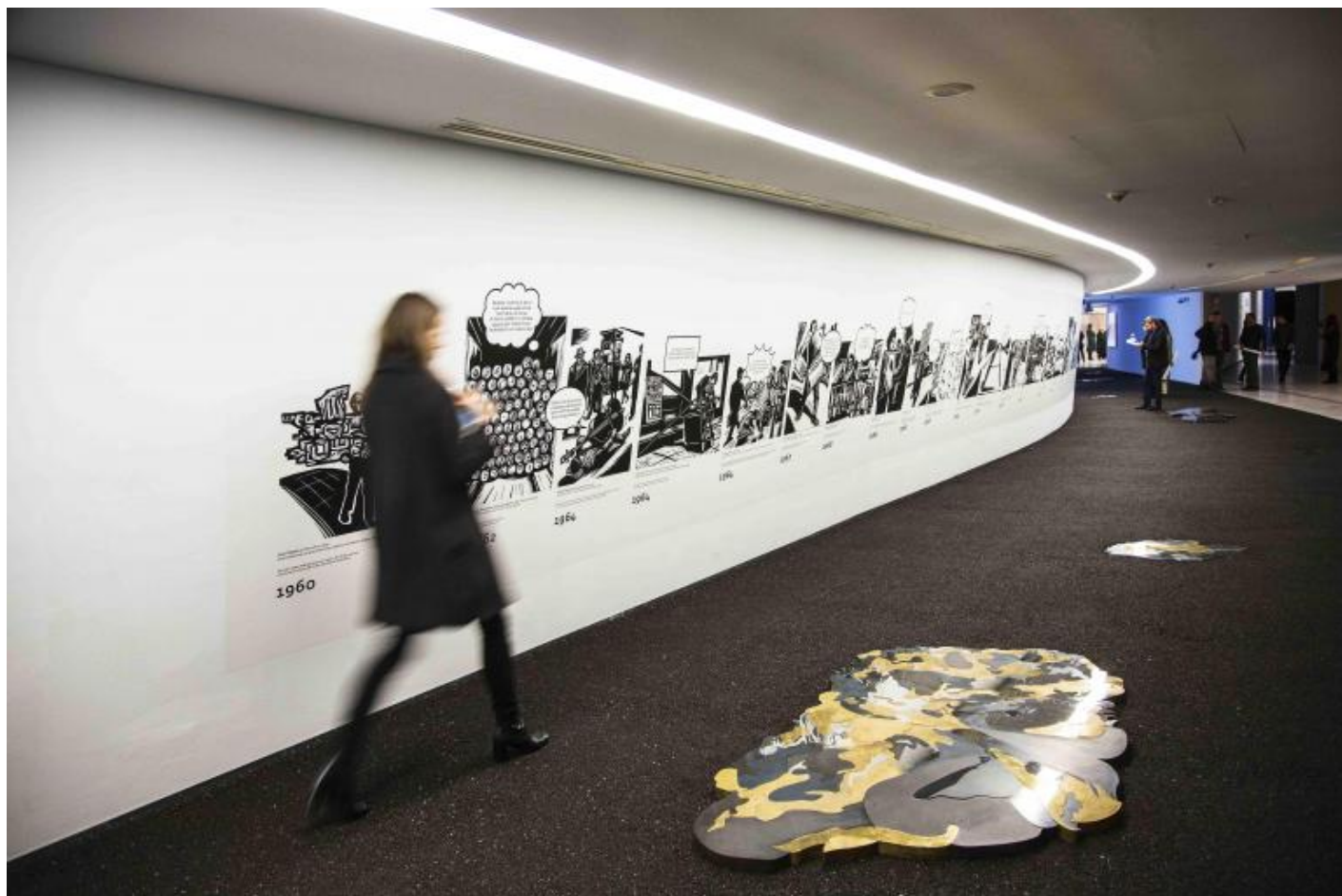
MAXXI, La strada .

Ancora, la strada si conferma teatro elettivo di azioni performative. Già nelle dérives urbane teorizzate dai situazionisti alla fine degli anni Cinquanta dello scorso secolo, i percorsi urbani diventavano oggetto di esplorazione fisica e psicoanalitica, dove camminare, cambiare direzione casualmente, perdersi; modi per costruire nuove mappature fisiche e affettive della città. Seguendo la traccia situazionista oggi alcuni artisti tentano di riaprire nella strada spazi di espressione e relazione, tra questi Yilin (Guangzhou, 1964) che nelle sue Golden Series , 2011-2012, raccoglie un ciclo di performance svolte nel 2011 a San Francisco dove l'artista, sdraiato a terra, percorre rotolando, ovvero usando la stessa azione fisica di base delle ruote dell'automobile, alcuni luoghi emblematici cittadini, preceduto da un gruppo di collaboratori che cammina lentamente aprendogli la strada. Cao Fei (Guangzhou (Cina), 1978), figura di spicco della "new generation" di artisti cinesi, con i suoi video ( Hip Hop: Guangzhou , 2003 ; Hip Hop: Fukuoka , 2005; Hip Hop: New York , 2006) racconta invece la gioia del quotidiano attraverso una carrellata di personaggi che balla felice in strada al ritmo di una traccia Hip Hop, genere musicale che nasce appunto nelle strade come mezzo di protesta delle classi disagiate.