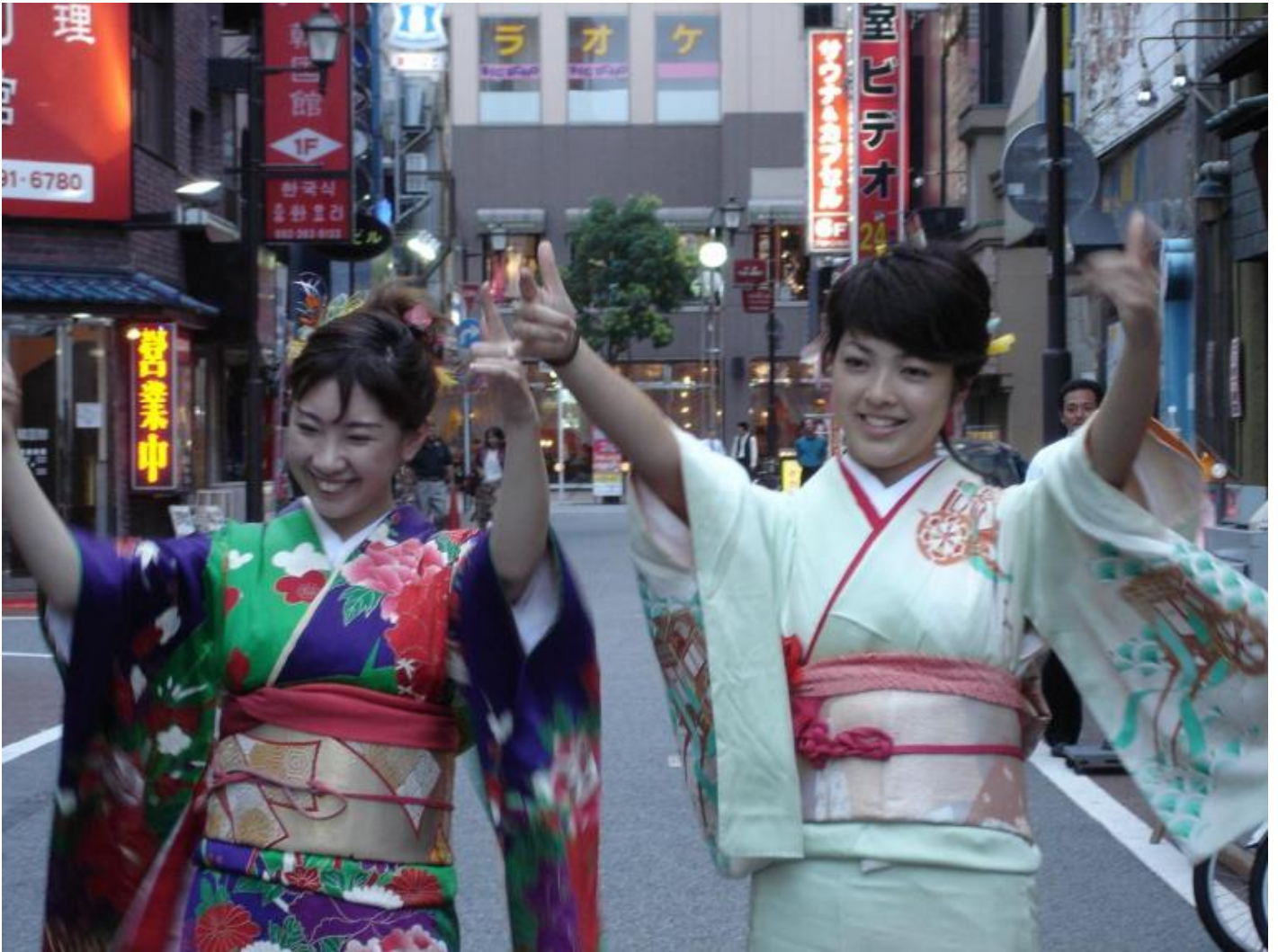
MAXXI, The street , Cao Fei, Hip Hop .

Di opera in opera, di nazione in nazione la strada si conferma luogo fondamentale per consentire alla comunità di sviluppare un'identità e una coscienza condivise e spazio per gli artisti per un'indagine dei confini fra pubblico e privato. Il conflitto sociale, il pregiudizio, l'immigrazione, le minoranze, in generale le relazioni interpersonali e il senso della comunità vengono vagliate, spesso in maniera disturbante, attraverso i lavori in mostra. Francis Alÿs (Anversa, 1959) con Paradox of Praxis 5 , (2013) esplora il tessuto urbano mediante il gesto inutile e metaforico di calciare un pallone infuocato camminando in strada: nel buio intravediamo la città Ciudad Juárez illuminata dal bagliore del fuoco. Pochi lavori dopo osserviamo Kimsooja (Taegu, 1957) ripetere un'esperienza legata alla propria infanzia nomade e posizionarsi di volta in volta nelle strade di Delhi, Lagos, New York, rinegoziando ogni volta la propria identità, trasformando la sua visione personale nella nostra (l'artista è di spalle), la presenza in assenza, il privato in pubblico, e così convertendo in uno sguardo il soggettivo in universale.