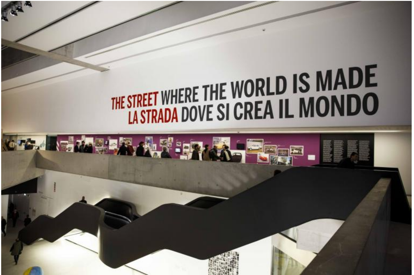
MAXXI, La strada.

Tra documento e ironia, si giunge al lavoro di Eric Baudelaire (Salt Lake City, USA, 1973) con il video Walked The Way Home (2018), girato a Roma durante la residenza dell'artista presso l'Accademia di Francia. Qui il panorama è più familiare: l'artista mostra con garbo l'inquietante presenza dei presidi militari, organizzati nelle città europee a seguito degli attacchi terroristici nelle grandi capitali: strade e piazze cittadine si trasformano nei luoghi di una stranianti coabitazione tra civili e militari.