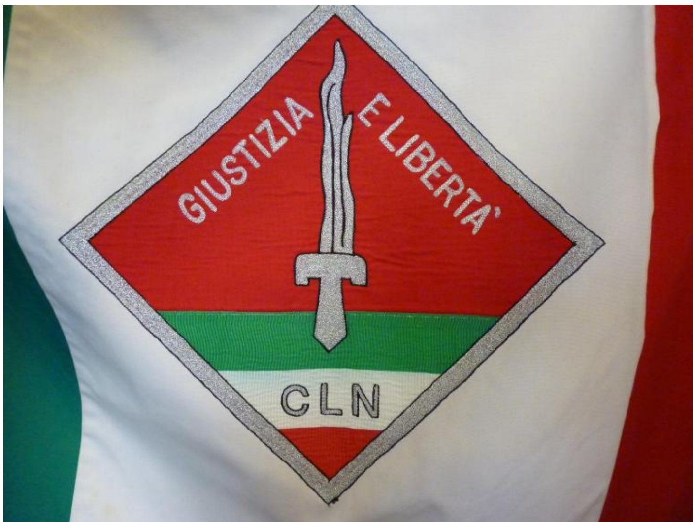
Una delle bandiere di giustizia e libertà.

All'improvviso l'animale si imbizzarrisce e scappa al galoppo. I partigiani temono che il ritorno del solo cavallo in caserma metta in allarme i tedeschi e scappano via attraverso i campi, verso il fiume. "Qui va a finire che i tedeschi ci arrivano addosso, ci siamo detti. E via di corsa".