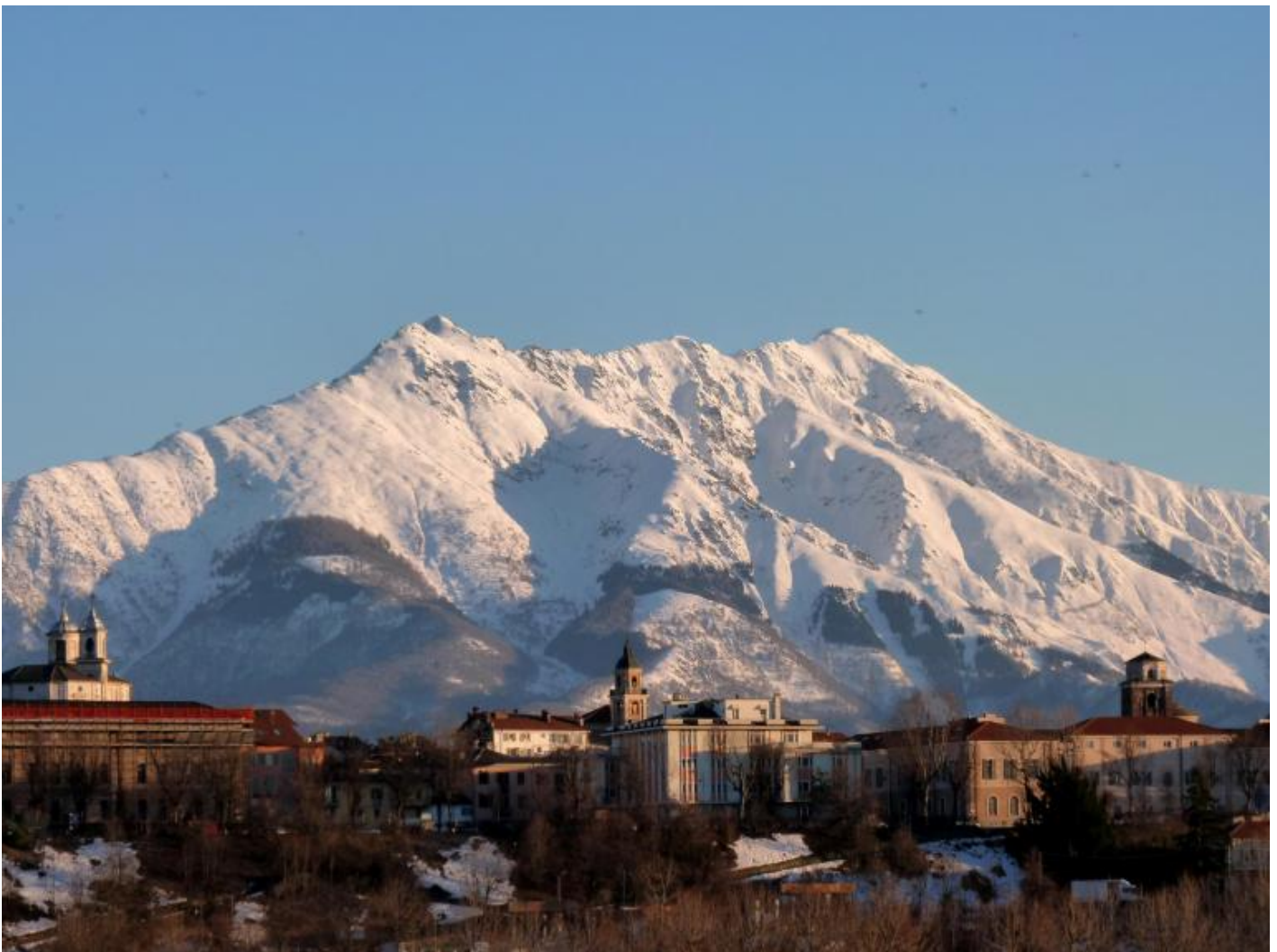
La Bisalta e Cuneo.

rapporti tra gli uomini della Resistenza e il mondo contadino, quest'ultimo gli racconta di un evento singolare. “Nell'estate del '44 avvenne un fatto che pochi ricordano e che forse neanche tu conosci. Un ufficiale tedesco tutte le mattine, alla stessa ora, usciva a cavallo dalla caserma di San Rocco, e seguendo sempre lo stesso itinerario raggiungeva la strada che unisce il santuario della Madonna degli Angeli alla cappella della Crocetta. Nei pressi di Tetto Graglia c'è una stradina che scende lungo la ripa e poi si perde nella striscia di terra compresa tra l'altopiano e il greto del Gesso. Il tedesco imboccava questa stradina, superava il sottopassaggio della ferrovia Cuneo-Borgo, poi si inoltrava nell'aperta campagna. Era un uomo tranquillo, sembrava una brava persona. A volte sostava sull'aia della nostra cascina, dove scambiava qualche parola con i bambini. La gente non lo temeva, si era abituata a vederlo comparire sempre alla stessa ora. Un mattino quel tedesco venne ucciso, non si è mai saputo da chi, poco lontano dalla nostra casa. Il suo cavallo ripercorse il solito itinerario e arrivò, solo, al cancello della caserma. Iniziò allora un rastrellamento che durò l'intera giornata, e meno male che non trovarono il morto, altrimenti sarebbe successo il finimondo. Avrebbero ucciso almeno dieci persone innocenti e bruciato tutte le case dei dintorni”.