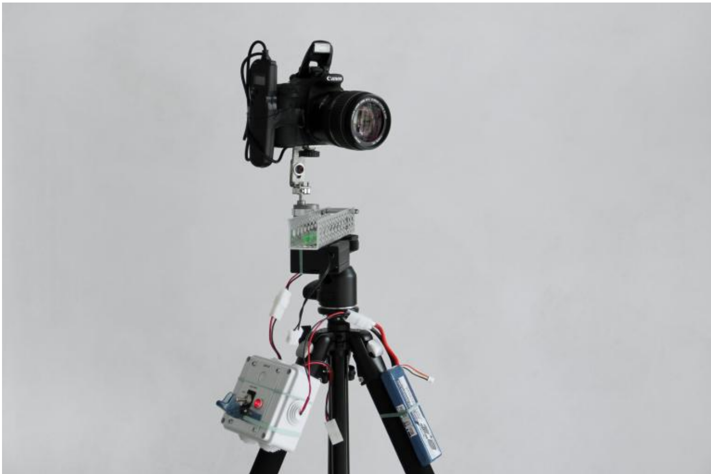
Irene Fenara, "Alta frequenza", 2015, multimedia installation, LocaleDue, Bologna.