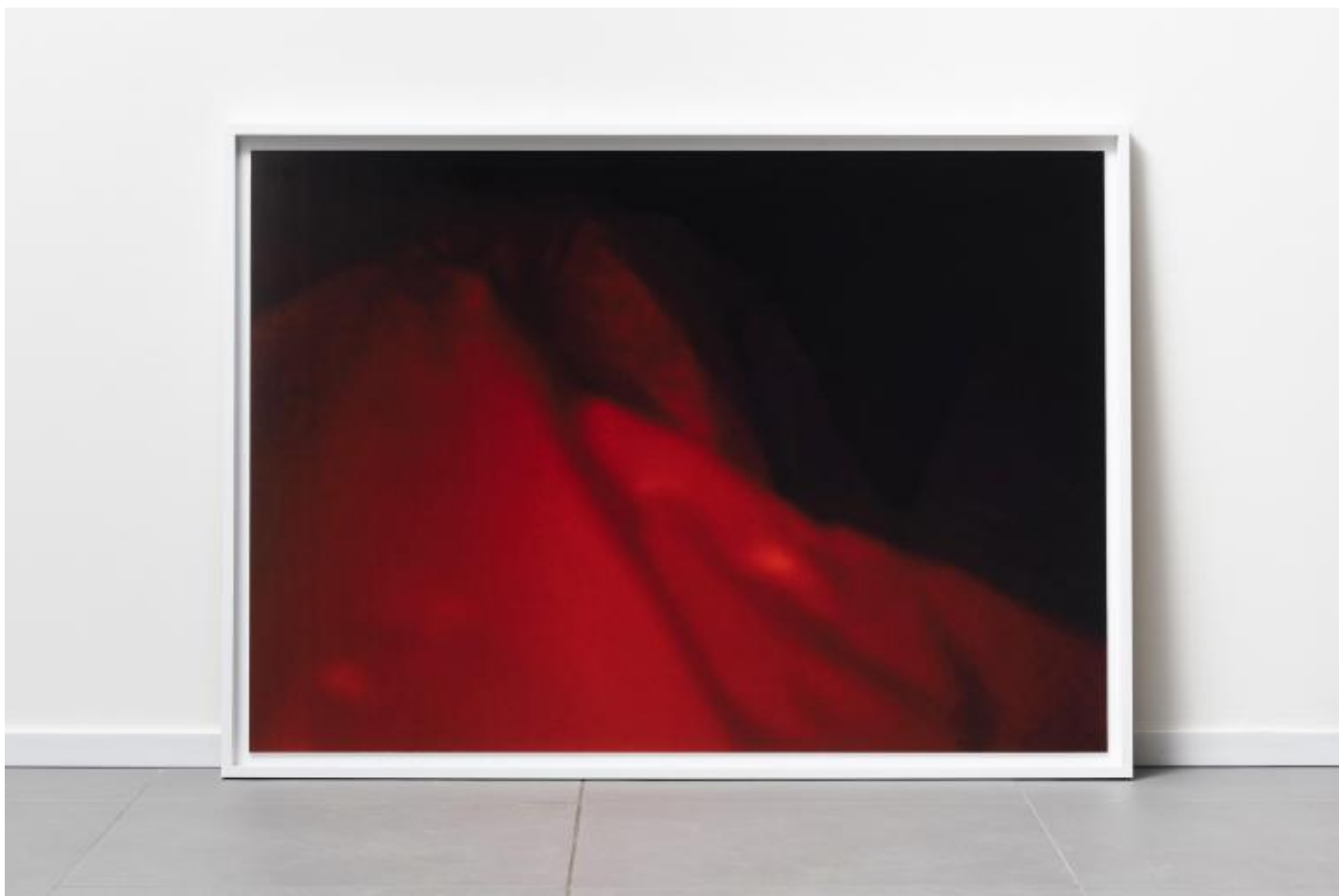
Irene Fenara “Supervision. photo from surveillance camera”, 2018, cm 85x120, installation view “Blind and other Cloudings, Spazio Leonardo, Milano, courtesy the artist and UNA (ph. credits Cosimo Filippini) .

Mi interesserebbe approfondire il tuo gesto del volere salvare immagini dalla sparizione. Come scegli le immagini che reputi interessanti per te, da salvare?