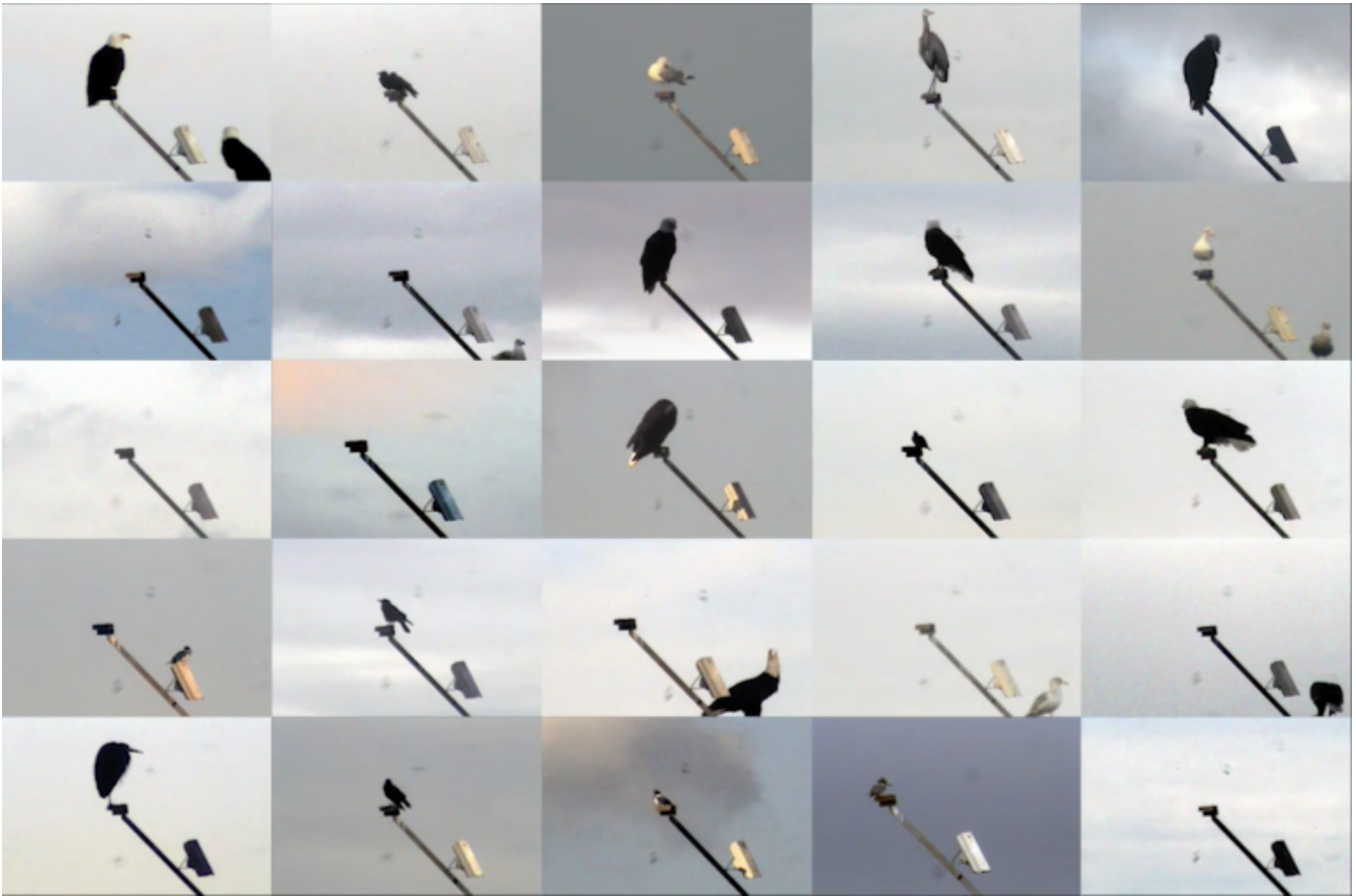
Irene Fenara, "21st Century Bird Watching", 2017, digital video, 7'00".

Lo scanner, a una distanza superiore ai due centimetri, non distingue più né forme né colori e li registra come variazioni di luminosità. Come hai diretto invece le conseguenze di ciò che accade oltre le lenti delle telecamere di sorveglianza? Cosa ti ha interessato del loro sguardo sul mondo sorvegliato?