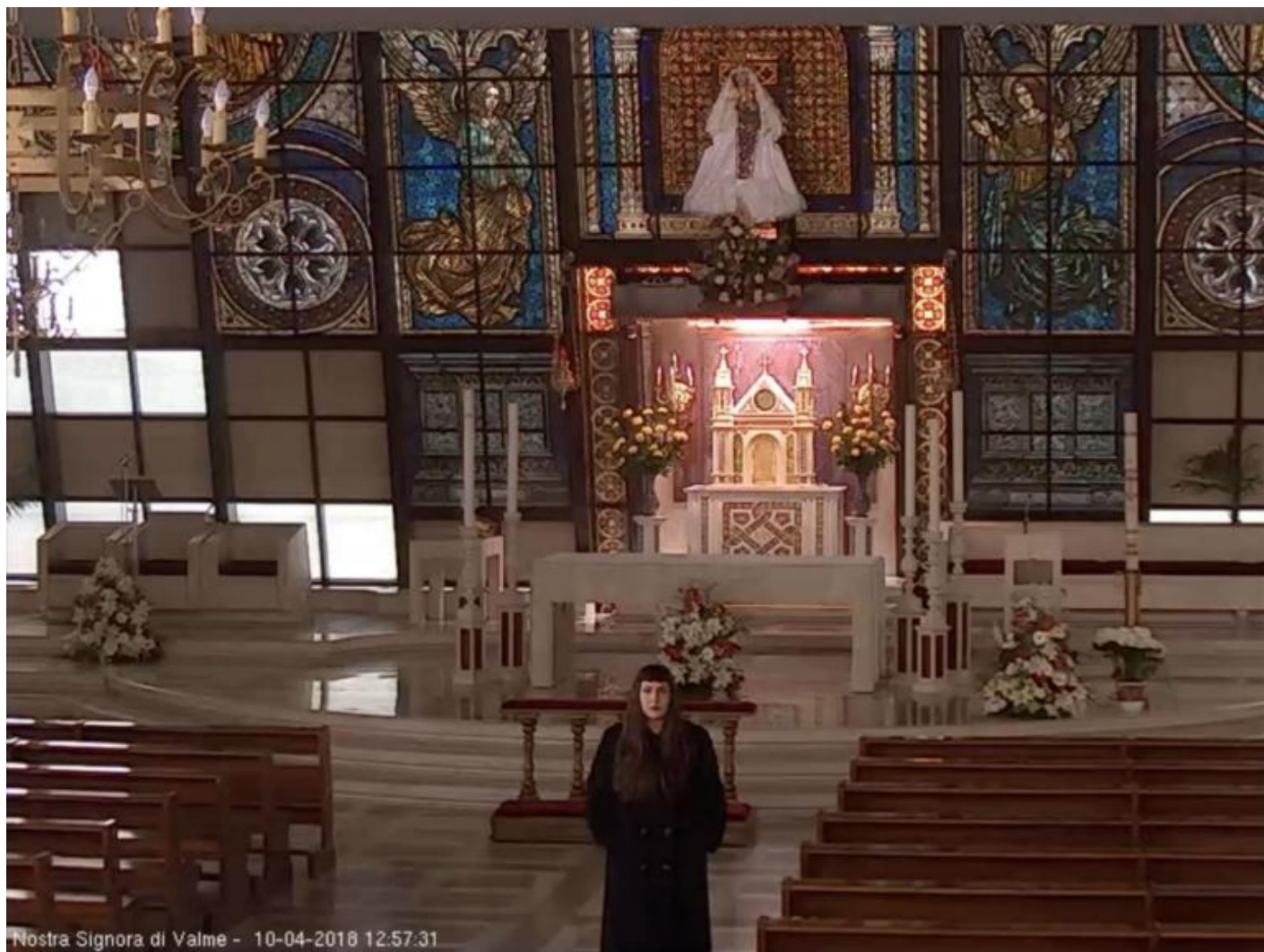
Irene Fenara, "self portrait from surveillance camera", 2018, cm 36 x 47, courtesy the artist and UNA.

I tuoi selfie da cctv hanno anche un intento politico, per abbattere la separazione regolata fra il privato e il pubblico?