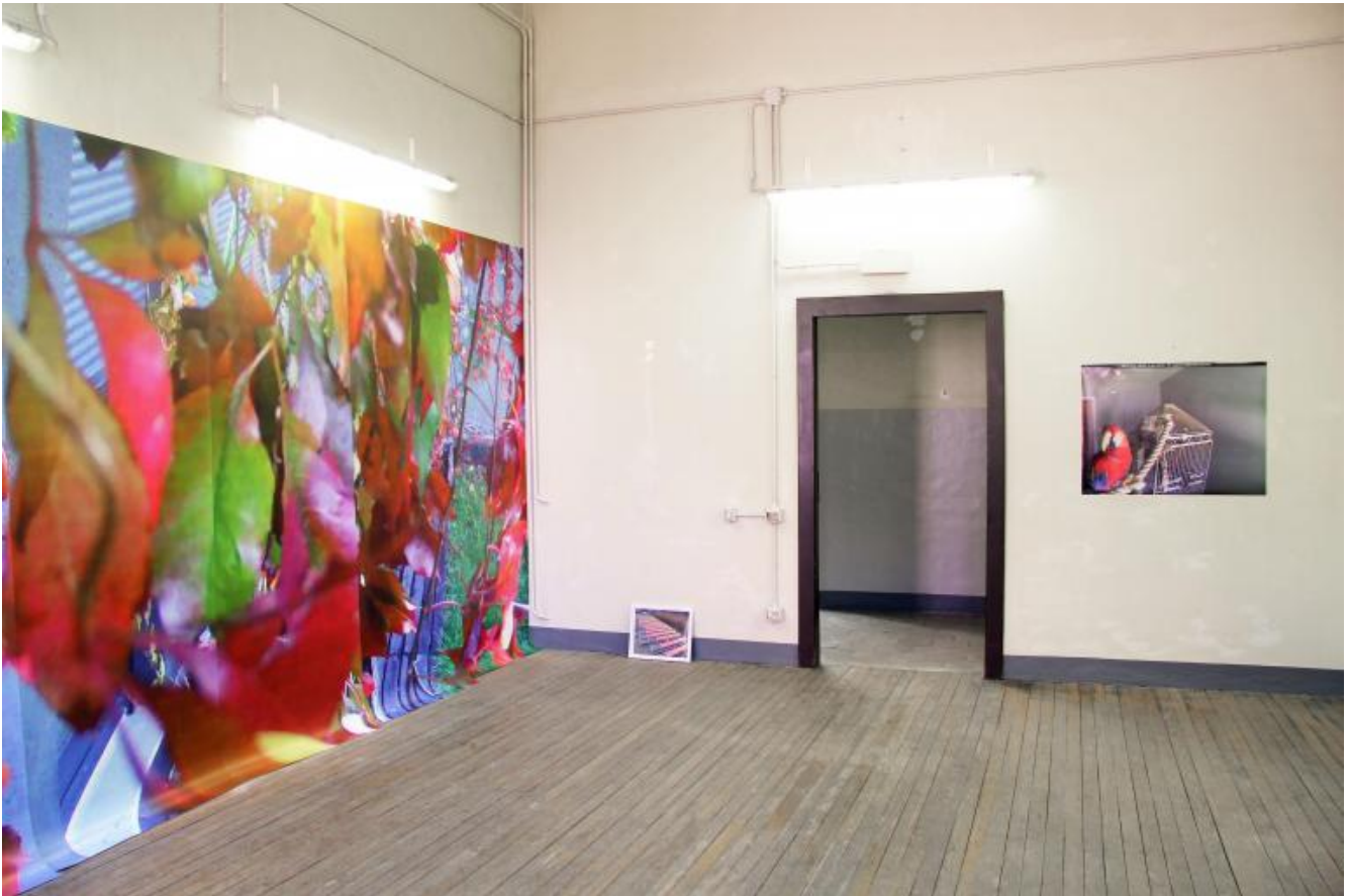
Irene Fenara "Supervision. photo from surveillance camera", 2018, photos from surveillance cameras installation view BACO Bergamo.

Possiamo anche prendere in considerazione il rapporto e l'intento inconscio di scegliere immagini che tu hai in qualche modo "rubato" da qualcuno che ne è inconsapevole? E soprattutto come nasce l'idea di "elevare" immagini di telecamere puntate su qualche cosa a cui viene dato un valore diverso rispetto a quello che può intendere un circuito dell'arte contemporanea, ed esporlo o renderlo visibile in un contesto museale?