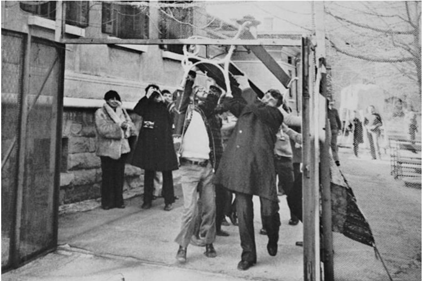
Franco Basaglia rompe i muri dell'op di Trieste per far uscire Marco Cavallo.

delicatissimo e la voce di Dell'Acqua in più punti si spezza: per la prima volta i 600 internati escono oltre le cinta rivendicando il loro diritto alla libertà e la loro appartenenza alla società e scendono in corteo fino al centro di Trieste. Difficile non commuoversi guardando l'epica fotografia di Basaglia che sfonda il cancello con una panchina per far uscire Marco Cavallo: era il marzo del 1973, il primo spiraglio, il primo sintomo dell'abbattimento del muro che sarebbe poi crollato nel 1978. Da quel giorno Marco Cavallo, il simbolo del riscatto, continua a girare il mondo per narrare che un'alternativa alla reclusione è possibile grazie all'arte.