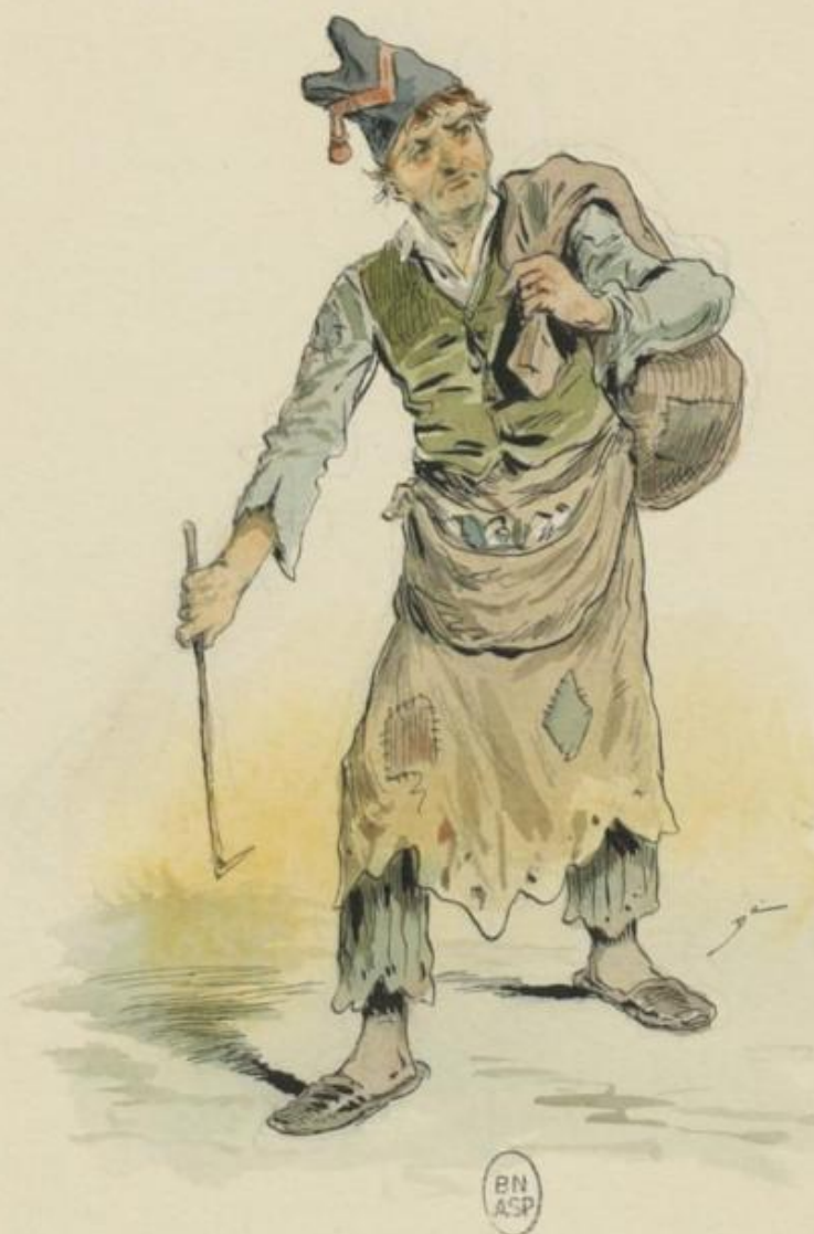
LE CHIFFONNIER DE PARIS (PORTE S t MARTIN 1847) LE PÈRE JEAN (FRÉDÉRIC LEMAÎTRE)