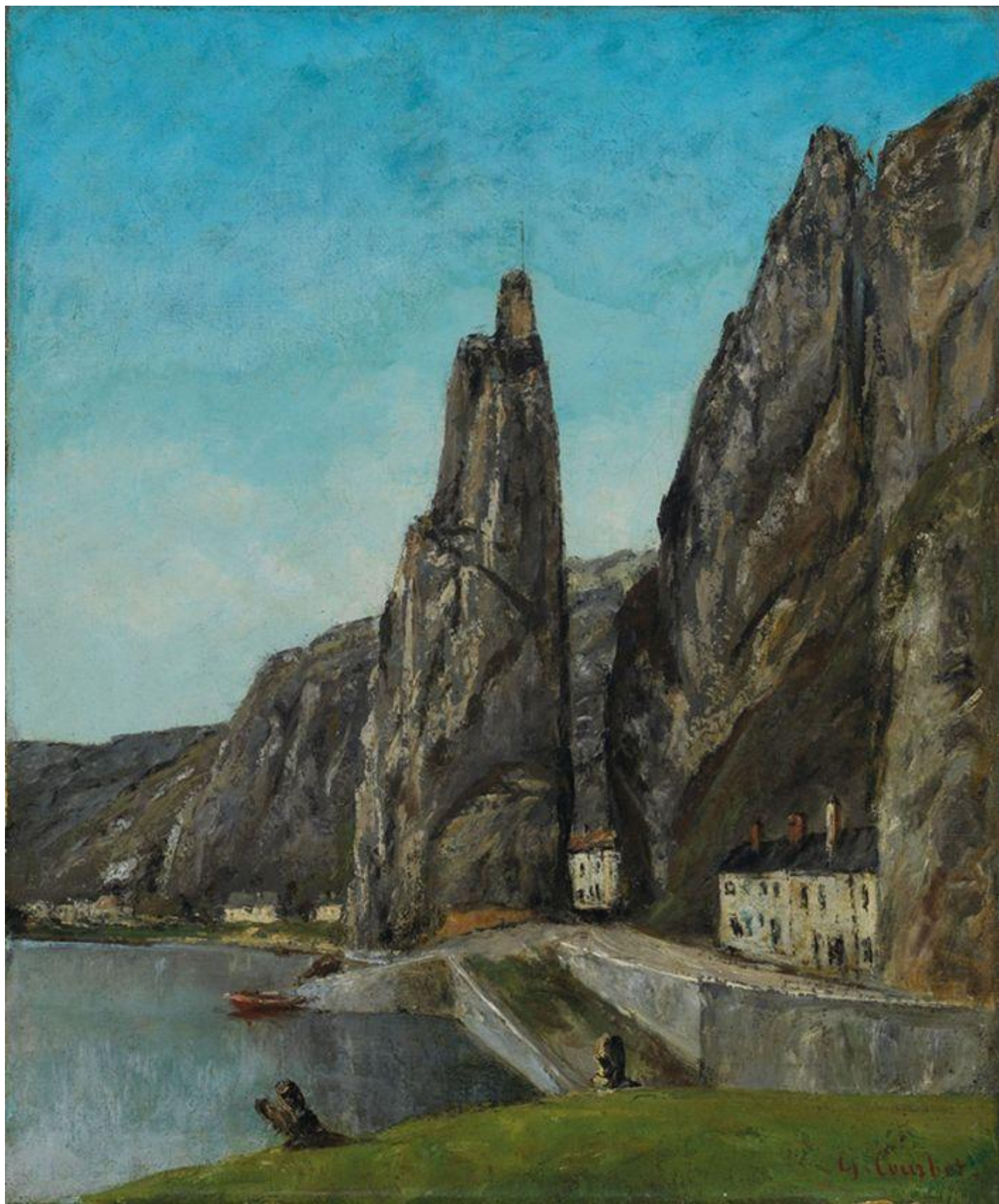
G. Courbet, La roccia di Bayard, Dinant.

«Ricordo che un giorno, davanti al pendio di fronte al quale sorge la collina di Marcil, egli mi indicò un oggetto lontano e disse: "Guarda quell'oggetto che ho appena dipinto. Io non so cosa sia". Si trattava di una certa forma grigia che da quella distanza non potevo identificare, ma, gettando lo sguardo sulla tela, vidi che