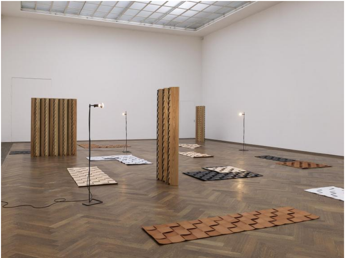
Leonor Antunes Veduta della mostra, "the last days in chimalistac", Kunsthalle Basel, Basilea, 2013

Vicende diverse nei luoghi e nel tempo che risuonano, una fitta rete di riferimenti, rimandi e consonanze, che dimostrano come l'arte che riflette su sé stessa non produca necessariamente tautologia, né sia un cul-de-sac da cui, esaurita l'indagine sul linguaggio, non rimanga che polvere. Antunes sa che le storie sono una materia viva in grado di iniettare sangue nel corpo (talvolta prossimo alla morte clinica) della scultura contemporanea e le utilizza come un mezzo per riflettere sulla pratica dell'arte, un mezzo da utilizzare per trascendere la dimensione narrativa e approdare a riflessione organica sulla forma.