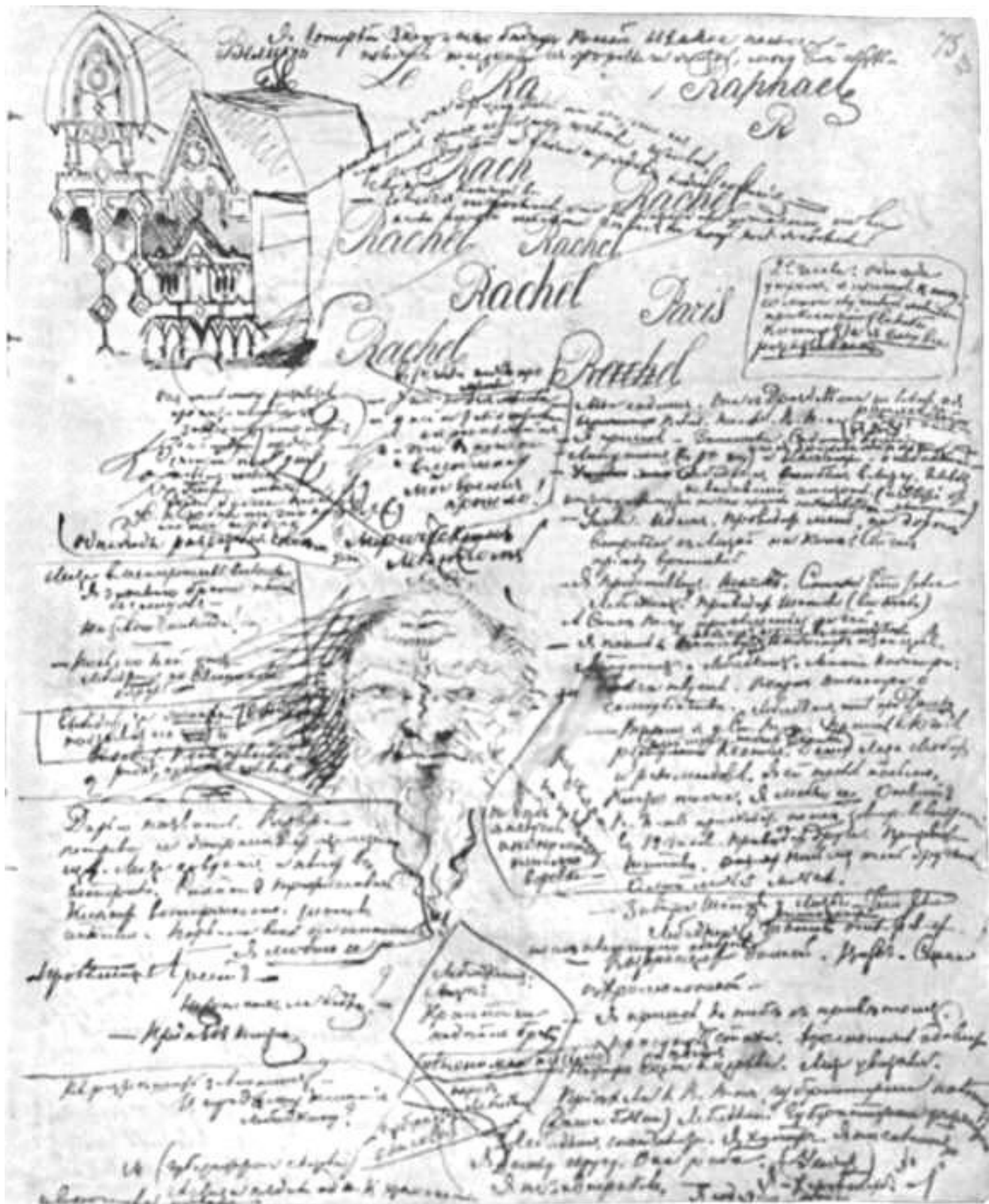
Gli scarabocchi di Dostoevskij