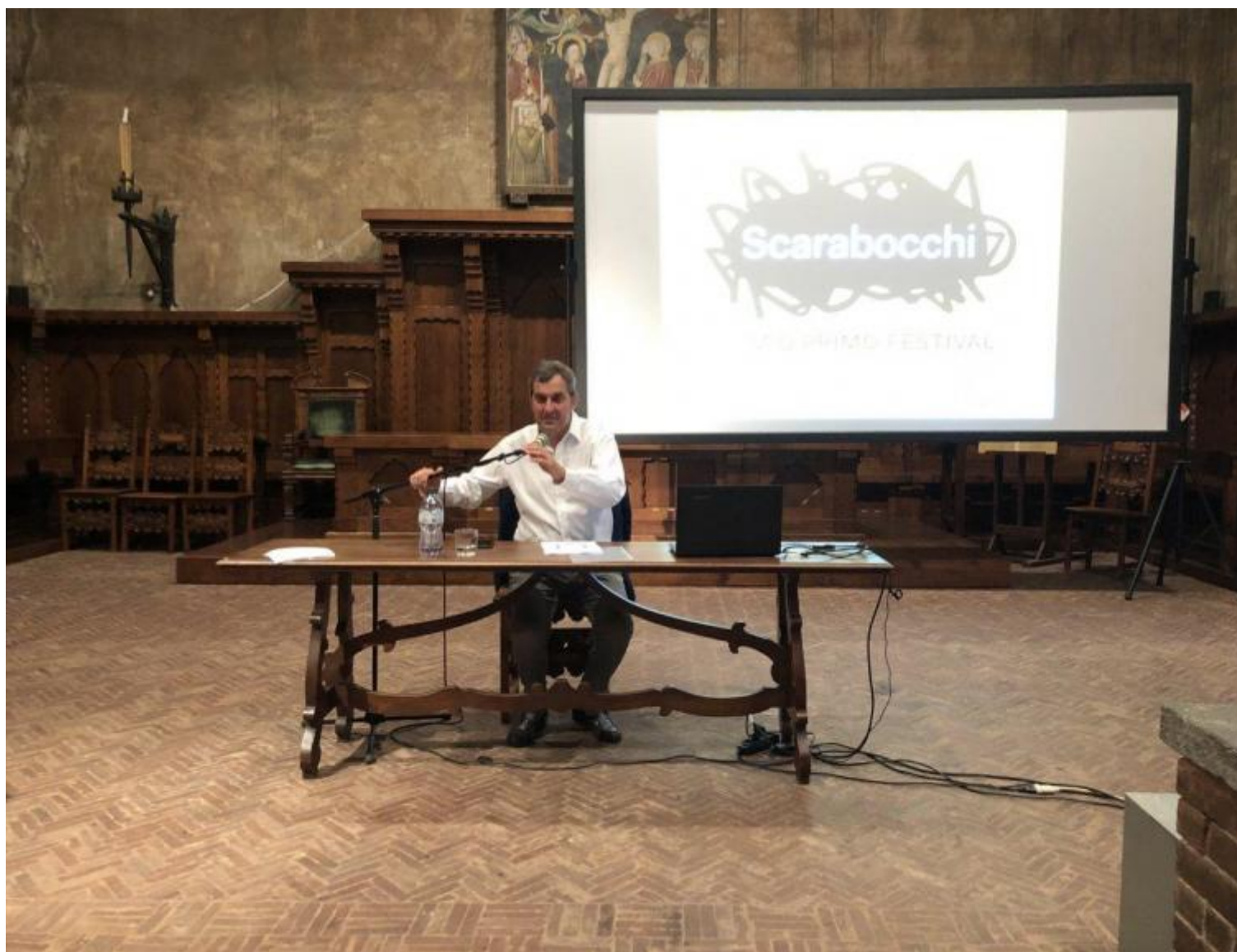
Mario Calabresi racconta Bruno Munari

In soli tre giorni a Novara si sono dati appuntamento per scarabocchiare insieme alcuni tra i più grandi illustratori e artisti italiani, i bambini hanno avuto accesso illimitato a colori, matite e tempere e si sono sbizzarriti in diversi laboratori, gli adulti hanno scoperto i significati degli scarabocchi o come gli scarabocchi nella sabbia possano dire qualcosa di noi, hanno guardato gli scarabocchi di famosi matematici e filosofi e interrogato questi gesti così semplici nel loro rapporto con il disegno.