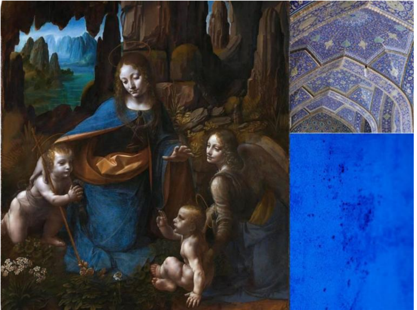
Leonardo da Vinci, La vergine delle rocce, 1483/1486, Musée du Louvre, Parigi; Motivi geometrici della Moschea del Venerdì di Isfahan, Iran, dettaglio della cupola; Yves Klein, Blue.

Del terzo episodio è protagonista un'altra bambina, vissuta in Australia nel 1050 a.C. e il suo e il nostro guardare sono cadenzati dall'intermittenza dallo sguardo e anche dalla direzione che esso assume.