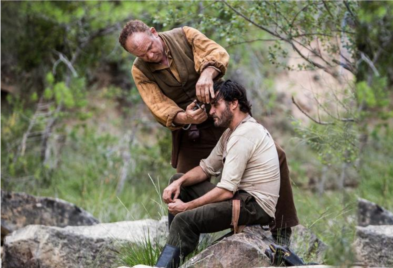
John C. Reilly e Joaquin Phoenix in The Sisters Brothers, di Jacques Audiard

Il film di Audiard, The Sisters Brothers , sfrutta proprio la libertà formale e narrativa che può sprigionarsi anche da uno sguardo mobile sulle identità di genere. E colpisce, anzi per certi aspetti può essere pure significativo, che quasi nessuno abbia notato finora che, come nel libro di Patrick deWitt (2011) da cui è tratto, i due fratelli protagonisti si chiamino “Sisters”, incarnando, anche nel nome, e in maniera umoristica, un destino narrativo di compresenza degli opposti: