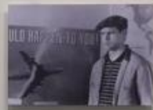
1998 55. Mostra Internazionale d'Arte Cinematografica