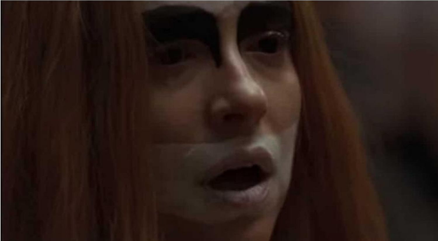
Dakota Johnson in Suspiria, di Luca Guadagnino

affaccia e si esibisce, nel “Magic Show”, uno struggente torso umano (Harry Melling), senza braccia e senza gambe, che un po’ pare uscito da Freaks (1932), un po’ sembra una surreale reinterpretazione della Venere di Milo, e con il volto coperto di biacca attacca a raccontare storie, sotto il cielo stellato. Quella è la culla del cinema: uno spazio da baraccone, dove un artista da strapazzo cerca di strabiliare un pubblico da fiera, stanco e bisognoso di sognare, di spaventarsi. Desiderio e paura sono la stoffa segreta del cinema: sono le emozioni più rudimentali, eppure quelle forse più indispensabili. Non possono essere completamente sostituite da sguardi di maniera sofisticati, eleganti, visivamente raffinati, ma incapaci di comunicare emozioni. Suspiria , di Guadagnino, procura un po’ questo effetto di ipersaturazione formale spinta oltre sé stessa, fino alla combustione. Chiede ammirazione, non emozione; è un cinema intransitivo, e per un film horror questo è un limite di codice.