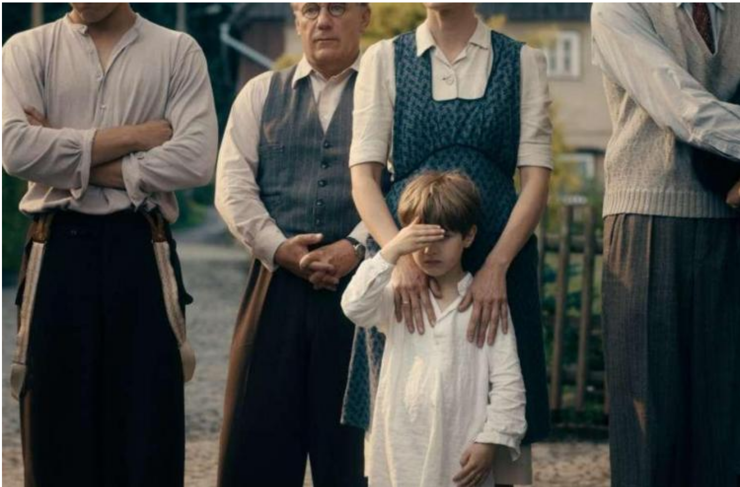
Opera senza autore ( Werk ohne Autor ), di Florian Henckel von Donnersmarck.

Tra l'altro, tutto questo accade in un momento in cui non solo il cinema d'autrice, ma d'autore mette continuamente in scena una domanda di narrazione e di sguardo rinnovati dal confronto con punti di vista altri, nuovi, occultati e restituiti alla luce. Di continuo i film di Venezia 75, per esempio, tornano sulle mappe dei grandi eventi della modernità (le guerre, il nazismo, il terrorismo) per riguardare la storia da prospettive differenti, trasformando questa urgenza in forma espressiva (attraverso usi sfocati dell'immagine, o dilatando i tempi di racconto, o usando piani sequenza rapidi continuamente attaccati a un unico personaggio). Vale per Peterloo , ma, sia pure assecondando progetti molto diversi, vale anche per i lavori in concorso Opera senza autore , di Florian Henckel von Donnersmarck (Oscar 2007 per Le vite degli altri ); e Napszállta ( Tramonto ), di László Nemes, l'autore di Il figlio di Saul (vincitore, nel 2015, del Grand Prix del Festival di Cannes e premiato con l'Oscar al miglior film straniero):