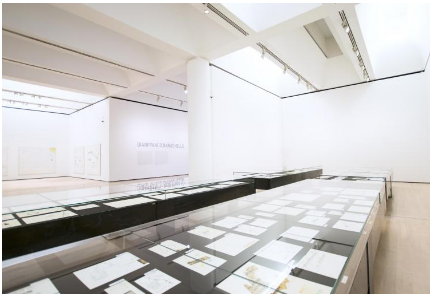
Gianfranco Baruchello, vista dell'allestimento, sala dei disegni

Un'attitudine testimoniata nella mostra a Rovereto anzitutto dalla serie di oltre duecento disegni datati dalla fine degli anni Cinquanta in avanti, in gran parte mai mostrati in precedenza, esposti in grandi teche orizzontali che permettono di coglierne a colpo d'occhio la qualità germinativa e sperimentale. In questo flusso di immagini intime e ininterrotte, un vero e proprio laboratorio in cui, foglio dopo foglio, è possibile scrutare sul nascere le invenzioni di Baruchello, l'affermarsi di una visione fuori dagli schemi, capace di combinare vena umoristica, intelligenza concettuale, con uno sguardo acuto e irriverente sulla realtà circostante, autobiografia poetica ed allusione erotica.