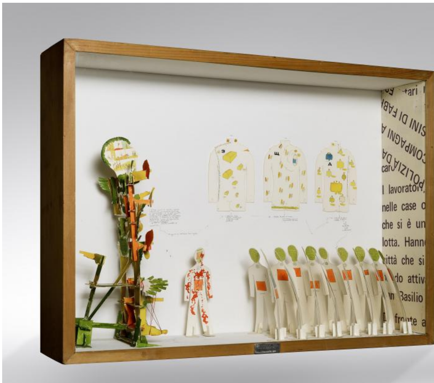
Gianfranco Baruchello, Autonomia della morte all'angolo di via Fiuminata il nove settembre 1974, 1974

assemblage , scrittura e bricolage (ancora qui da paragonare ai lavori tridimensionali di , compone brevi, ellittiche narrazioni sospese tra cronaca e immaginazione, in cui le allusioni al clima politico del tempo si trovano ancora una volta intrecciate a materiali onirici e libere associazioni.