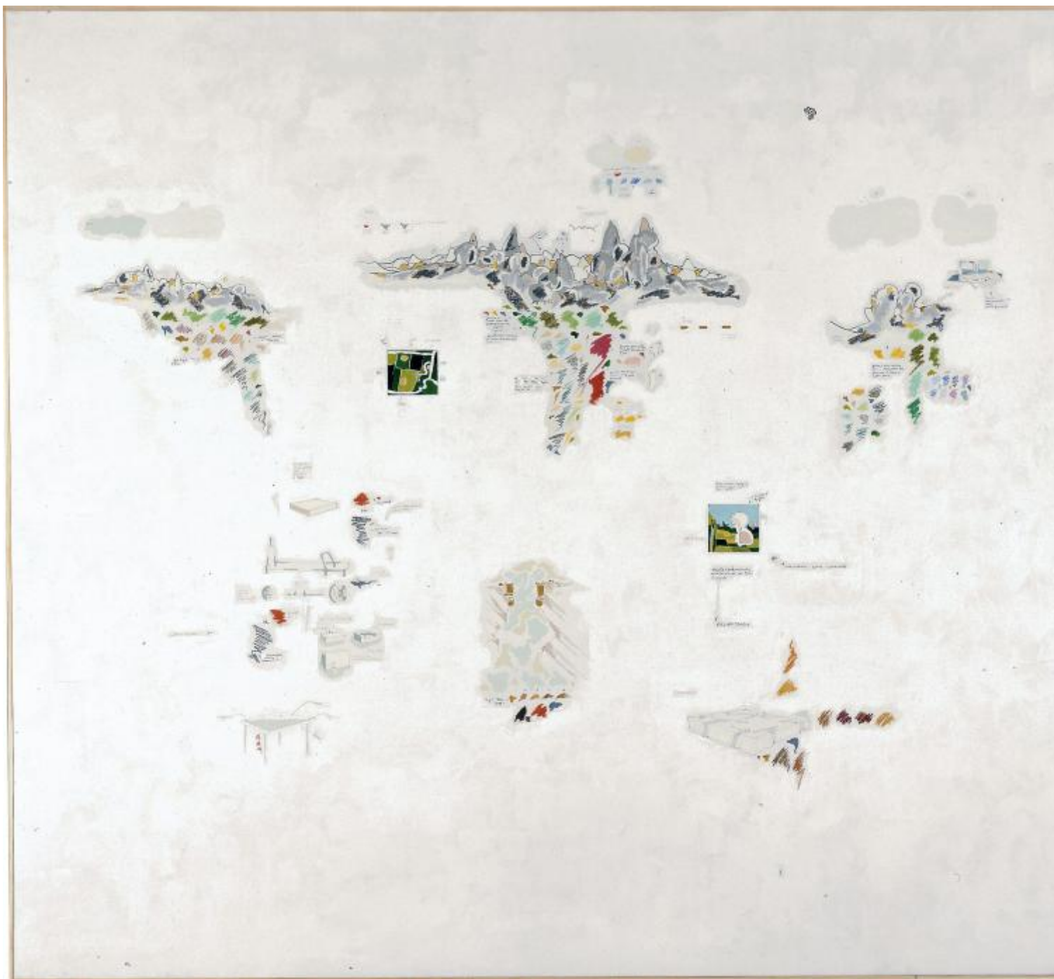
Gianfranco Baruchello, Nei giardini del dormiveglia, III , 1984

Le superfici bianche, mai uniformi, possono così accogliere umori, proiezioni, associazioni inconsce, schegge di quotidianità, dérives dell'immaginazione, fantasmi erotici, visioni grottesche o surreali, sino a comporre una sorta di cosmo senza centro: in un va-e-vieni obbligato, lo spettatore deve avvicinare l'occhio alla superficie per cogliere i dettagli e leggere i testi e allontanarsi per far emergere i percorsi labirintici che li connettono, come accade in mostra ad esempio nel ciclo Nei giardini del dormiveglia (1984). Ma la lettura non è mai conclusiva, ogni tentativo di decifrazione finisce per generare uno scacco e la necessità di reiniziare da capo. La narrazione, come nei più radicali romanzi sperimentali della neoavanguardia, resta, deve restare, indefinitamente aperta .