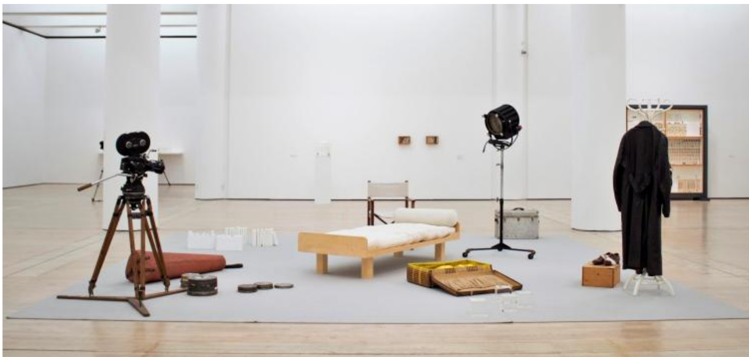
Gianfranco Baruchello, Le Moi fragile, 2018, vista dell'allestimento

Le Tre lettere a Raymond Roussel – con cui termina il percorso dell'esposizione e di cui ha parlato anche Tommaso Isabella qui su doppiozero – riassumono in forma sintetica ed eloquente i modi con cui il lavoro dell'artista, nato a Livorno nel 1924, si è misurato con queste domande, protendendosi cioè verso le regioni dell'inconscio e simultaneamente verso il mondo degli oggetti quotidiani e verso la sfera mediale, ovvero quel tessuto connettivo di immagini, parole, comportamenti, che nella società contemporanea danno forma all'esperienza collettiva, ne sono per così dire insieme il basamento e il sintomo. Assemblage, ready-made e montaggio – metodologie moderniste, ormai ampiamente storicizzate, rivolte all'appropriazione diretta del “reale”, o meglio alla creazione di un effetto di reale – definiscono così sin dagli inizi una vicenda creativa che dialoga con le correnti più innovative del proprio tempo, in primo luogo new dada e nouveau réalisme , e con personalità idiosincratiche e congeniali come Öyvind Fahlström (di cui Baruchello è per molti versi un corrispondente segreto), ma guarda simultaneamente all'indietro, con occhio prensile, alla cultura surrealista e alla fondamentale lezione di Marcel Duchamp, individuando una posizione molto personale in cui convivono, come ha scritto Carla Subrizi, movimento dinamico e azione sulle cose, coscienza e reazioni arcaiche, percezione e informazione.