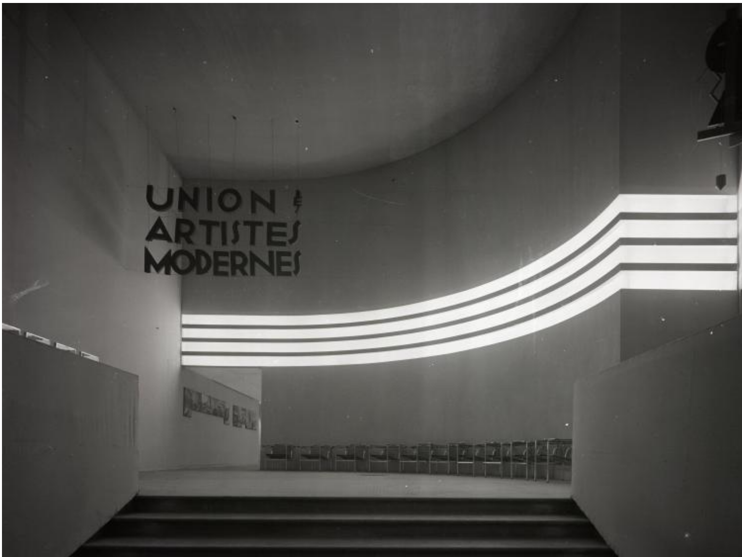
Robert Mallet-Stevens, Ingresso della III Exposition de l'Union des Artistes Modernes, Paris, 1930

Come altre che l'hanno preceduta negli stessi spazi, L'Envol presenta in effetti il mondo, la sua storia, come una democrazia magica, anarchica, illimitata, senza conflitti e senza negativo, dove lo spettatore-consumatore si sente libero di cedere alla meraviglia, libero da ogni pedagogia, libero di immaginare, evadere, godere: si può guardare tutto e dimenticare tutto. Un confronto immediato è con un'altra mostra, di ben più ampie proporzioni e ambizioni, in corso a Parigi in queste settimane: UAM. Une aventure moderne (Centre Georges Pompidou, fino al 27 agosto), dedicata alle origini e alle vicende della Union des Artistes Modernes, il gruppo-faro del modernismo francese. Con i suoi nomi eccellenti, da Eileen Gray, Le Corbusier, Mallet-Stevens, a Charlotte Perriand e Jean Prouvé, la mostra è ricchissima di opere, modelli, immagini, documentazione, che misurano anno dopo anno l'evoluzione di architettura, design e arti decorative in Francia, dal gusto Art Nouveau del primo decennio del XX secolo al razionalismo modernista di cui il gruppo UAM, fondato nel 1929, fu tra i maggiori interpreti.