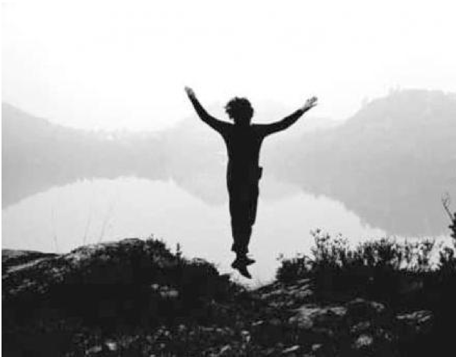
Gino De Dominicis, Tentativo di volo, 1970

Ma il Tentativo , come ha notato Michele Dantini, è anche la puntuale parodia di quel Salto nel vuoto (1960) con cui Yves Klein celebrava il suo singolare ingresso in uno “spazio” dell’arte tutto immateriale e mentale, così come un altro lavoro di De Dominicis, Il tempo, lo sbaglio, lo spazio (1970) – uno scheletro umano steso al suolo con dei pattini a rotelle ai piedi, che con una mano porta al guinzaglio lo scheletro di un cane e con l’altra regge in bilico un’asta verticale –, espone il rovescio immobile e mortale del mito della velocità, abbattendo ironicamente il pattinatore dotato di paracadute impersonato da Robert Rauschenberg nella performance Pelican (1963).