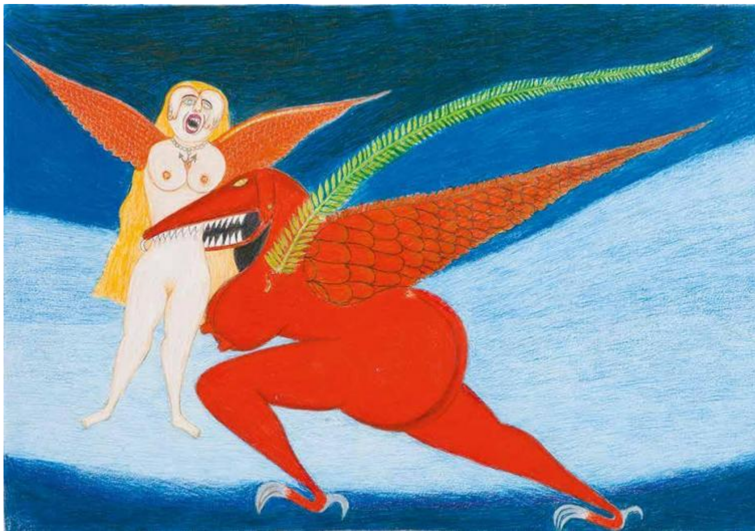
Friedrich Schröder-Sonnenstern, Der Friedens Habich, 1960