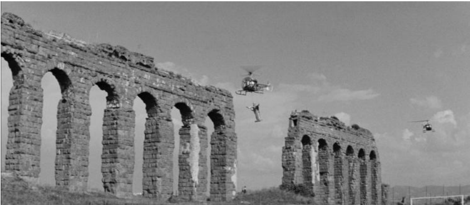
La dolce vita , 1960

Alla fine, pur con tutti i suoi evidenti difetti, occorre però riconoscere a L'Envol una qualità dolorosamente assente in troppe mostre recenti, piccole e grandi. La capacità cioè di attingere a immagini considerate come eventi in sé, più che come supporti di petizioni moraliste o di schedature erudite. Immagini che sembrano essersi imposte quasi già fatte a chi le ha realizzate, per quanto strane, perturbanti, impreviste, non evolute, e che a dispetto della loro sempre contingente, storica e dialettizzabile novità , appaiono pretendere da chi le guarda anzitutto il riconoscimento, sempre in bilico tra adesione irragionevole e clinico distacco, del loro essere impreviste e imprevedibili.