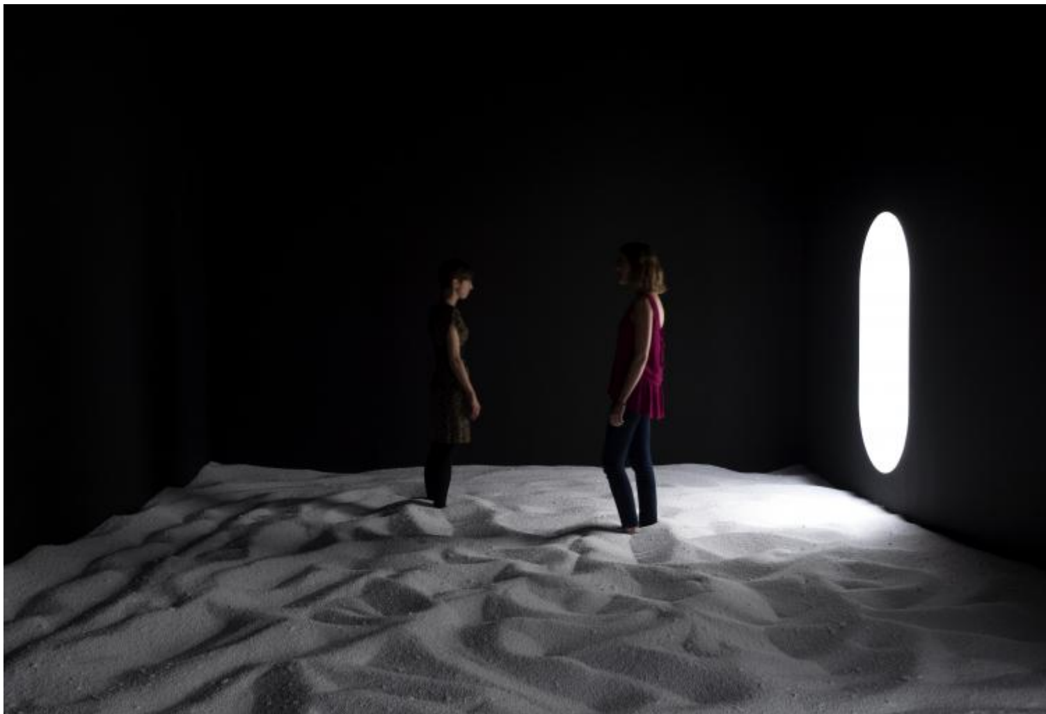
Fabio Mauri, La Luna, 1968

sferica in caucciù di Nobuko Tsuchiya ( 11 Dimension Project 2 , 2011).