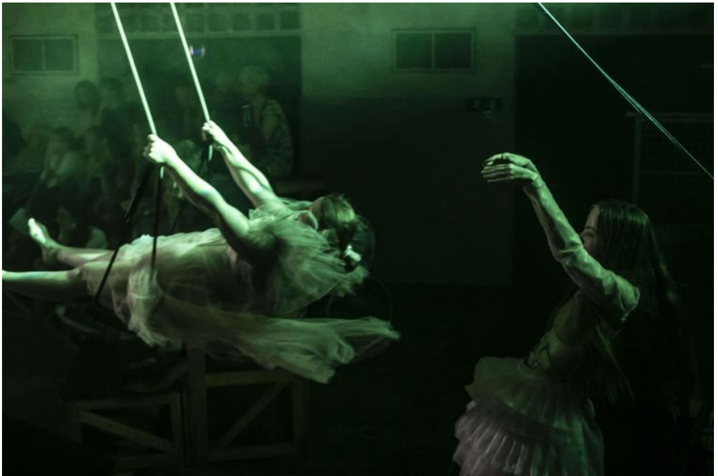
Otello, Allegro Moderato, ph Vasco Dell'Oro.

Antonio Viganò del Teatro alla Ribalta – prima Compagnia teatrale costituita da uomini e donne in situazione di “handicap” che, dopo dodici anni di attività di creazione e formazione, sono diventati attori e attrici professionisti – ha messo in scena un Otello rivisitato, in cui, come è lui stesso a dirci, non è Rodrigo, l'attore, che si è adattato a Otello, il personaggio, ma Otello che si è adattato a Rodrigo.