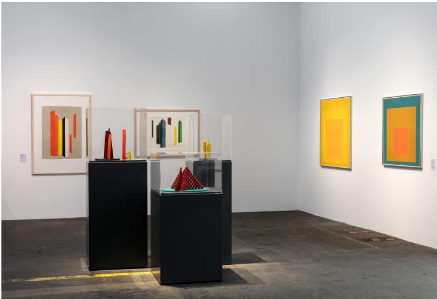
Hello World, Hamburger Bahnhof, Berlino, vista dell'allestimento

La risposta di Hello World potrebbe essere riassunta così: rendiamo leggibili anzitutto i conflitti rimossi, le narrazioni cancellate o emarginate, gli scenari politici e sociali remoti o invisibili nel museo tradizionalmente inteso come “deposito”, come immacolato riparo dallo sporco della Storia. Per una collezione le cui vicende riflettono la tragedia tedesca – dall’epoca guglielmiana al nazismo, dalla partizione Est/Ovest alla riunificazione post-1989 – questa esigenza di nuova storicità si traduce nella sistematica contestazione delle tradizionali gerarchie di valori, dei concetti di “periferia” e “centro”, di high e low , nella sottolineatura di ibridazioni e scambi inediti tra culture.