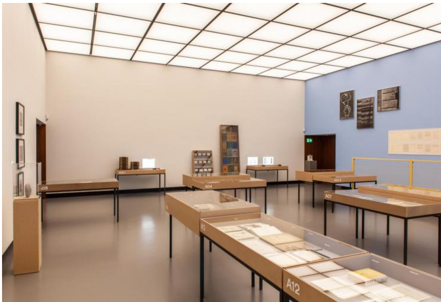
Neolitische Kindheit, Haus der Kulturen der Welt, vista dell'allestimento

Pur con premesse simili, assai diversa appare la strada percorsa alla Haus der Kulturen der Welt dalla mostra che prende il titolo da un'espressione dello storico e teorico tedesco Carl Einstein, figura essenziale del panorama culturale tedesco tra le due guerre, per il quale quella dell'"infanzia neolitica" è la condizione di un'arte che si misura con un mondo sempre più ostile e frammentato e ricerca una possibile rifondazione dell'umano guardando alle forme di vita collettiva e all'immaginario della preistoria. La mostra esplora così le connessioni e gli intensi scambi tra arti visive e discipline diverse (etnologia, psicoanalisi, filosofia, ecc.) tra anni Venti e Trenta del Novecento come forme di inquieta ricerca di vie di uscita dalla spirale imperialista, totalitaria e razzista, dalla vera e propria crisi di civiltà che attanaglia l'Europa. Su questo sfondo, le esperienze artistiche, in particolare quelle legate al surrealismo, vanno alla ricerca di un orizzonte alternativo, ritrovandolo nelle culture premoderne, "primitive", negli strati profondi della psiche e del linguaggio, nell'"animismo" – come lo chiamò ancora Einstein rovesciando di segno un classico termine dell'etnologia evoluzionista ottocentesca – cioè una forma di percezione sensibile a una pluralità di forze prive di un riferimento "centrale", di un fondamento identitario, in senso tanto estetico che politico.