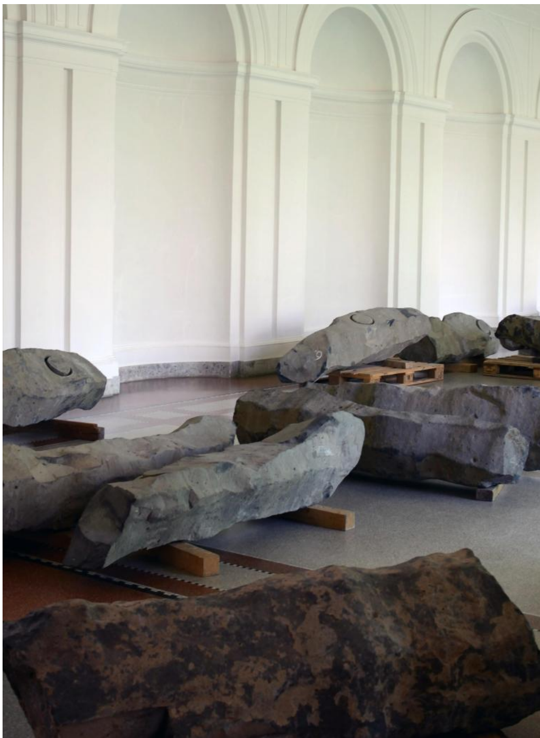
Joseph Beuys, Das Ende des 20. Jahrhunderts (‘La fine del XX secolo’), 1982–83, particolare dell’installazione

I momenti migliori di Hello World restano così quelli in cui più difficile si dimostra la costruzione di un frame ideologico generale: la sezione dedicata all’uso degli strumenti di comunicazione come medium artistici tra anni ’60 e ’70, a partire dal progetto Three Country Happening (1966) di Marta Minujín, Allan Kaprow e Wolf Vostell, o gli Interludes con opere maggiori di On Kawara (il grande ciclo Date Paintings ) o Bruce Nauman (l’installazione My Soul Left Out, Room That Does Not Care , 1984), e il sempre straordinario insieme di opere e installazioni di Joseph Beuys, e in particolare Das Ende des 20. Jahrhunderts (‘La fine del XX secolo’) (1982–83), con i suoi grandi monoliti di basalto posati sul pavimento, la cui minerale, misteriosa impassibilità continua a turbare i nostri tentativi di scioglierci finalmente dai legacci con l’oscurità novecentesca.