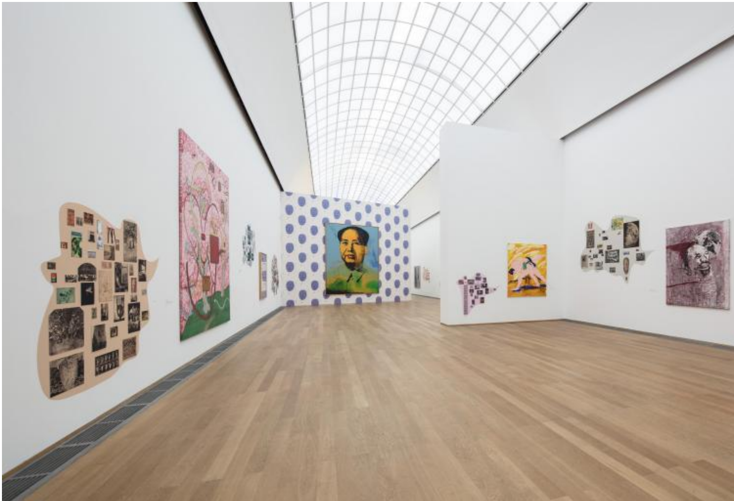
Hello World, Hamburger Bahnhof, Berlino, vista dell'allestimento della collezione Marx

Stesso discorso può valere per la sala dedicata alle culture indigene dell'America del Nordovest e al loro impatto sulla pittura americana o per gli ampi insiemi dedicati alle esperienze artistiche di opposizione nei paesi dell'Europa orientale e in Unione Sovietica nel periodo della Guerra fredda, in cui le difficoltà e i rischi di un dissenso tanto culturale che politico trovava spesso forme alternative e complementari alla produzione di opere, come azioni collettive, pubblicazioni o forme di scambio internazionale. In un'altra sezione, le connessioni tra il gruppo dada giapponese Mavo e la scena artistica berlinese dei primi anni Venti vengono indagate come un caso di precoce e originale appropriazione delle strategie più radicali dell'avanguardia in un contesto culturale remoto.