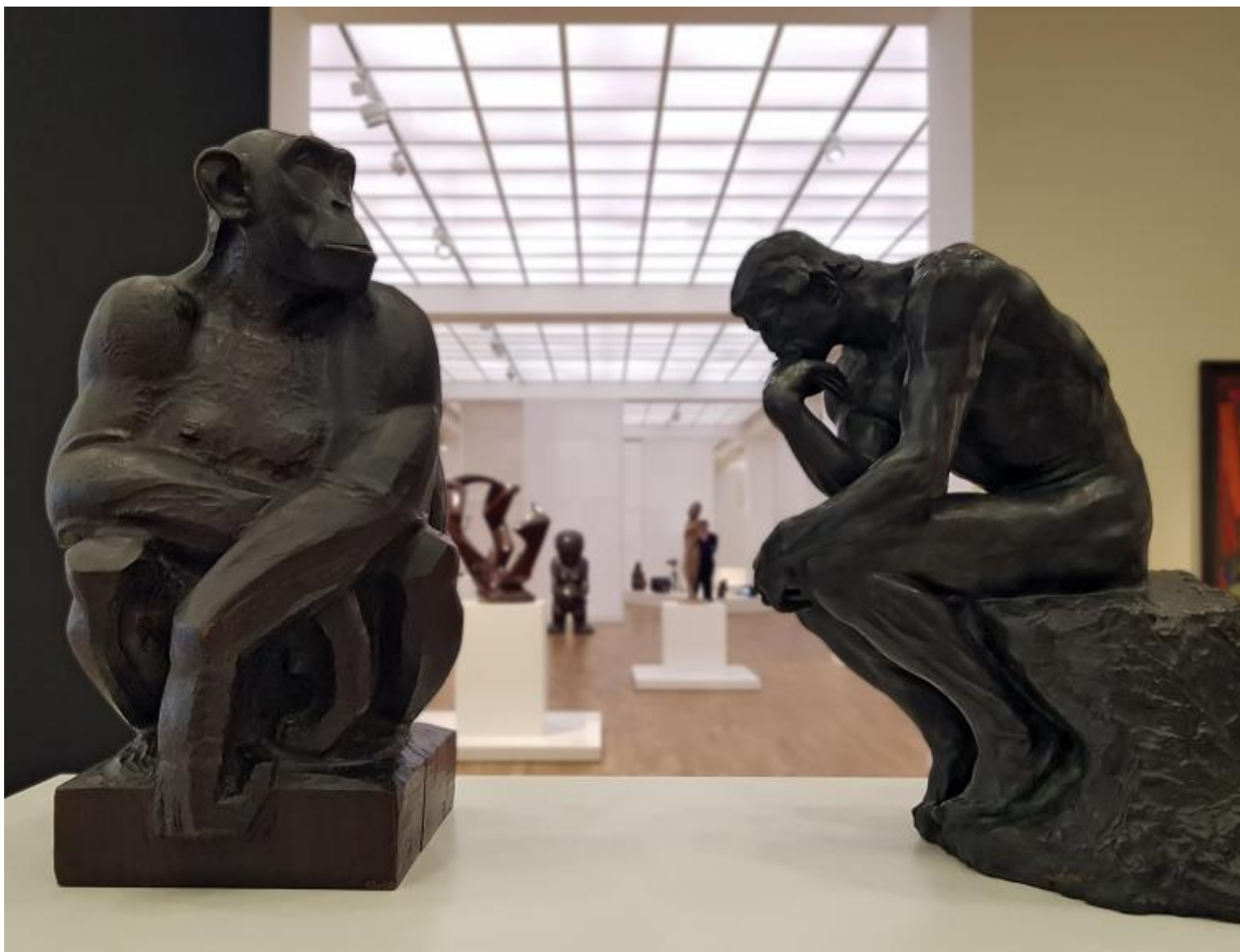
Hello World, Hamburger Bahnhof, Berlino, vista dell'allestimento