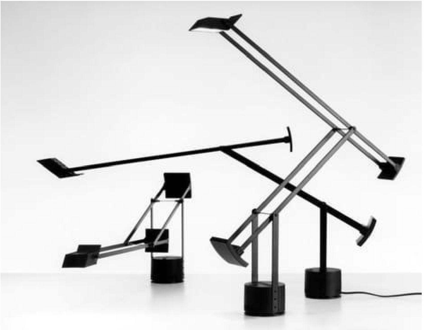
Lampada Tizio, Artemide. Design di Richard Sapper, 1972. Premio Grand Prix XV Triennale, 1974; Medaglia d'oro XV Triennale, 1974; Selezione Compasso d'Oro, 1979.

Tra i suoi oggetti più famosi, spicca la lampada da tavolo Tizio , da lui progettata nel 1970 e messa in produzione da Artemide nel 1972, uno dei suoi pezzi più noti e in assoluto uno dei più venduti al mondo. Nata da una sua esigenza personale, poiché desiderava: “ una lampada da disegno che avesse un ampio raggio di movimento e che, nonostante questa caratteristica, fosse poco ingombrante ”, la Tizio è un prodigio di illuminotecnica, che era assolutamente innovativo quando fu progettata e rimane insuperato ancora oggi.