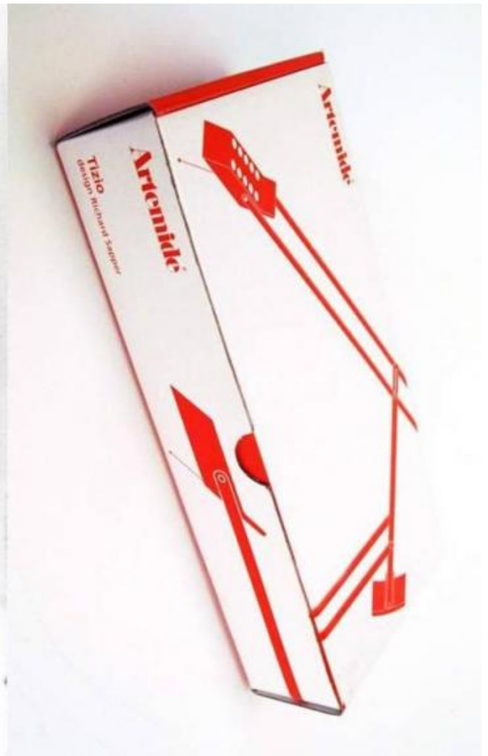
Richard Sapper, tavola di progetto della lampada Tizio, firmata e datata 12 maggio 1970; a destra: packaging originale della Tizio.