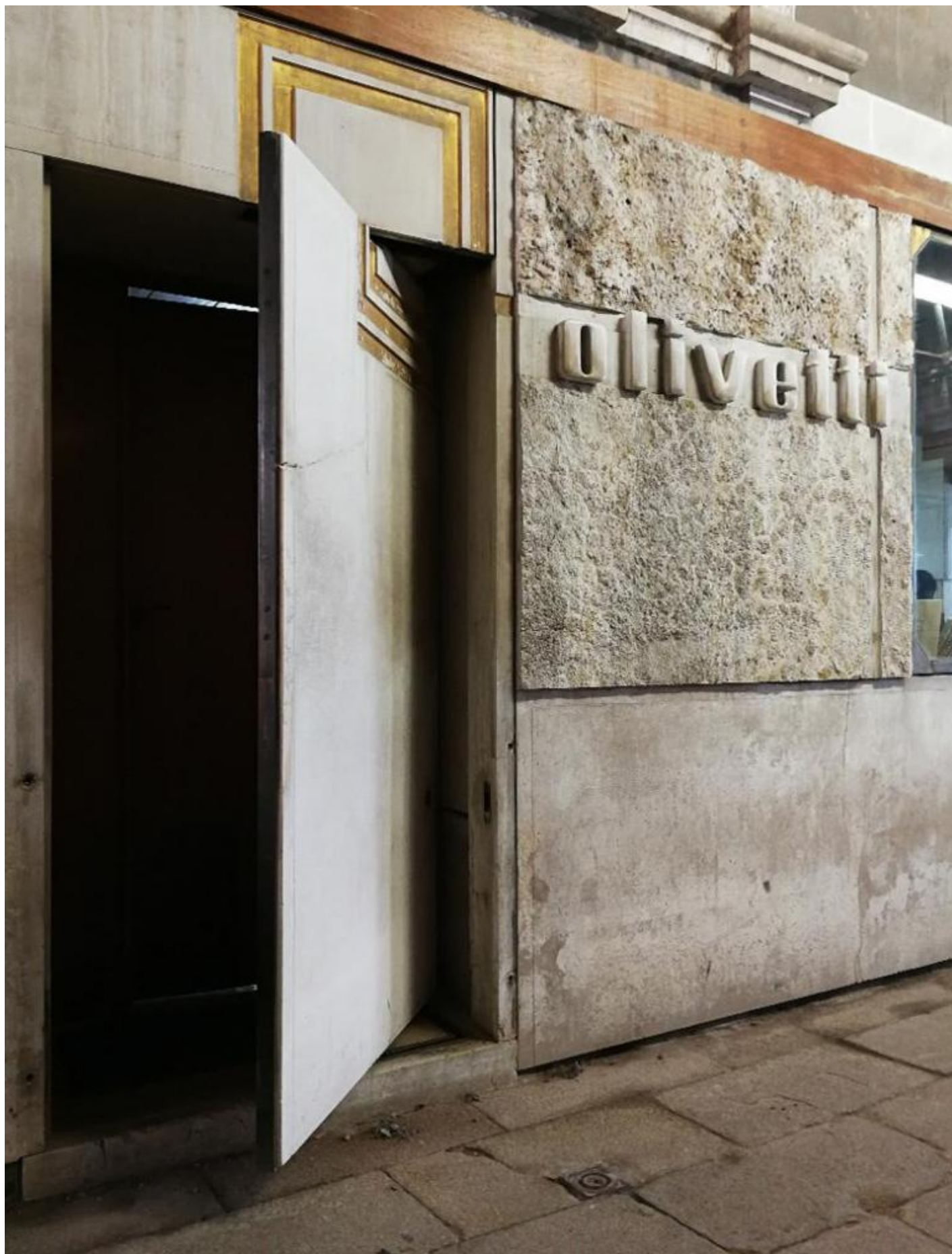
Carlo Scarpa, negozio Olivetti, 1957-58. Venezia, piazza San Marco. Ingresso laterale.