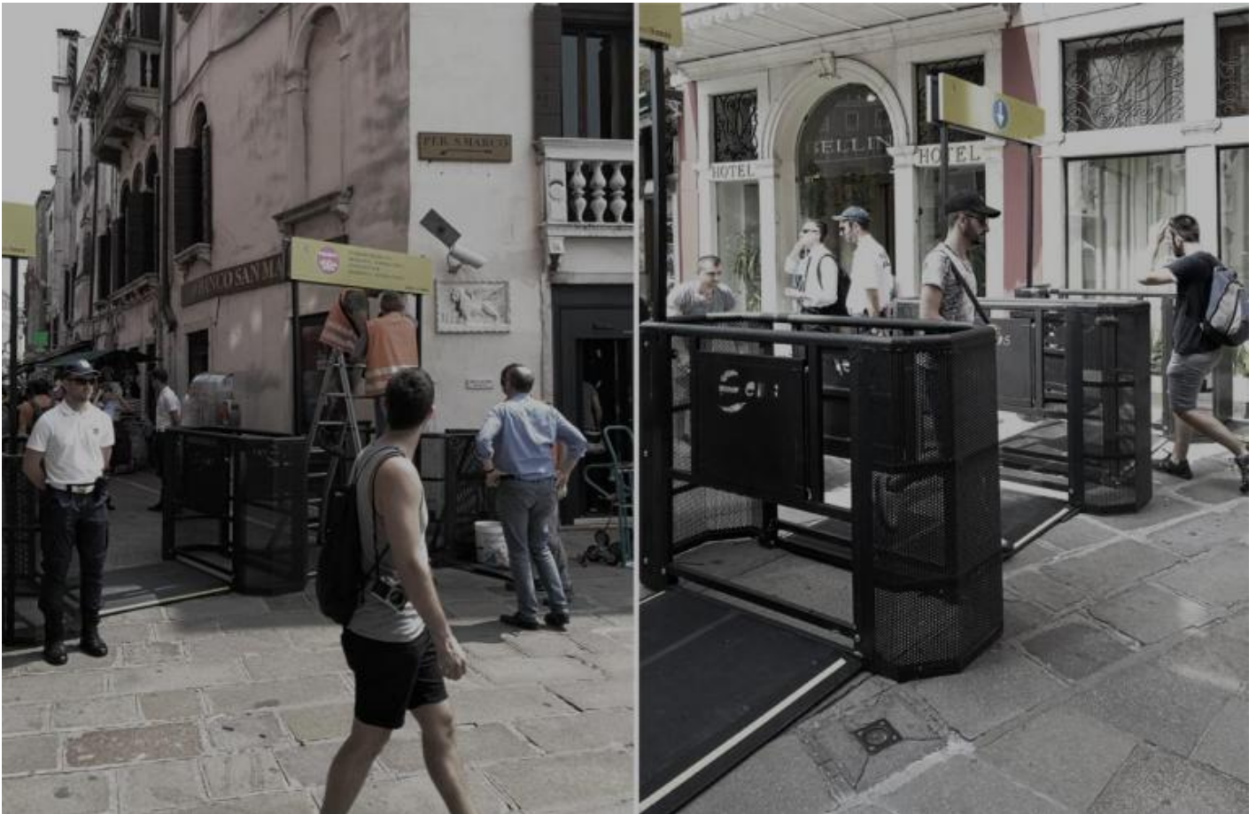
Varco posto ai piedi del Ponte degli Scalzi.