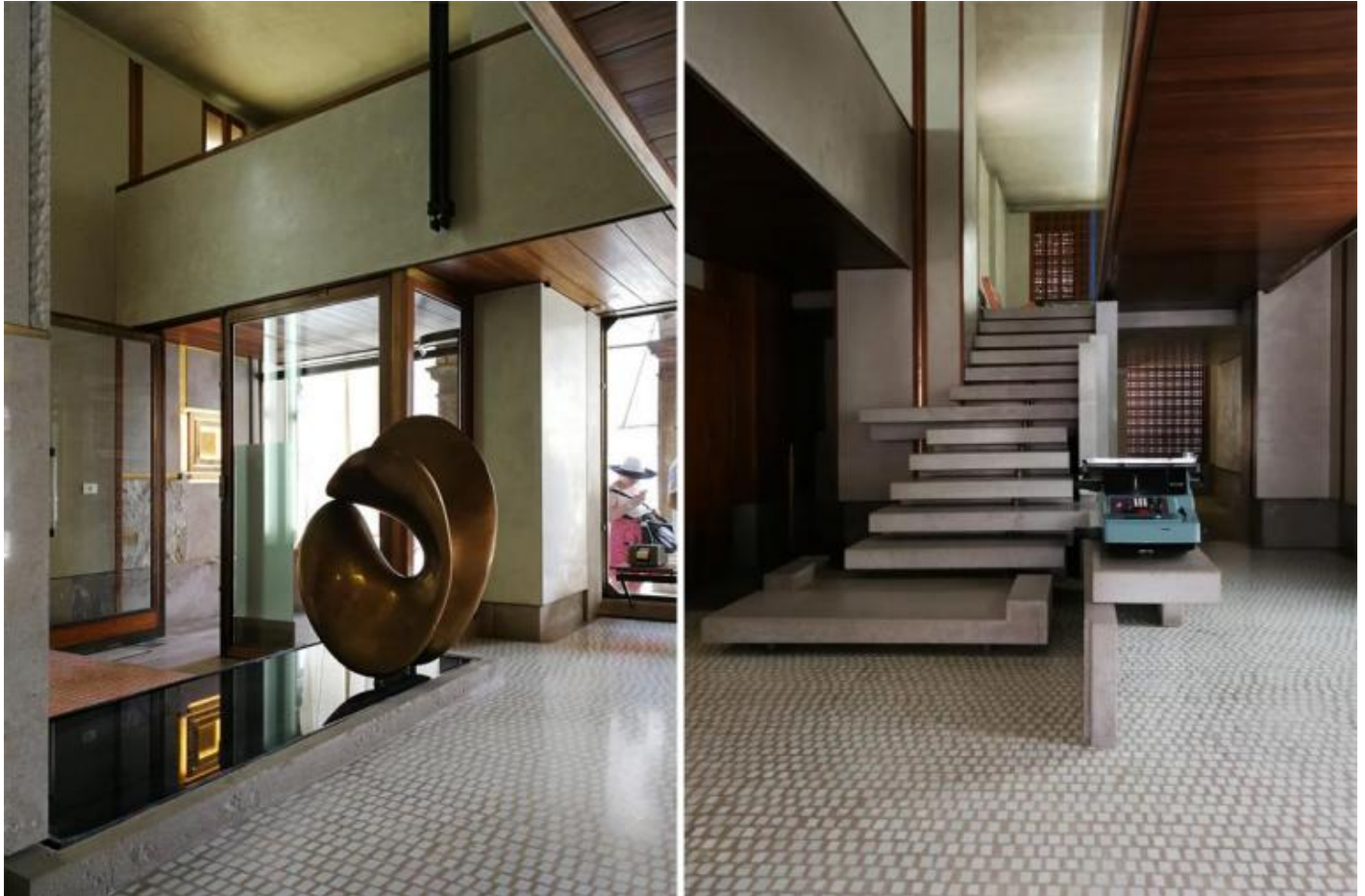
Carlo Scarpa, negozio Olivetti, 1957-58. Venezia, piazza San Marco. Vedute dell'interno.

L'architettura del negozio, nel quale sono entrato dall'incredibile e bellissimo ingresso laterale, ha due centri di generazione dello spazio. Il primo è la scala che mette geometricamente in moto un sistema di piani e volumi, il secondo è la scultura Nudo al sole di Alberto Viani che "galleggia" sullo specchio d'acqua raccolta in una vasca di marmo nero. Lo storico dell'arte Ludovico Ragghianti ricorda che "Tra le poche cose che Scarpa mi ha detto nel presentarmi la sua architettura del negozio Olivetti è questa: che egli l'ha fatto come ambiente per la statua di Viani" ( La Crosera de piazza di Carlo Scarpa , in Zodiac , n°4, 1959, pp.134-137). In realtà, osserva Ragghianti, la scultura era una componente necessaria alla soluzione architettonica proposta da Scarpa.