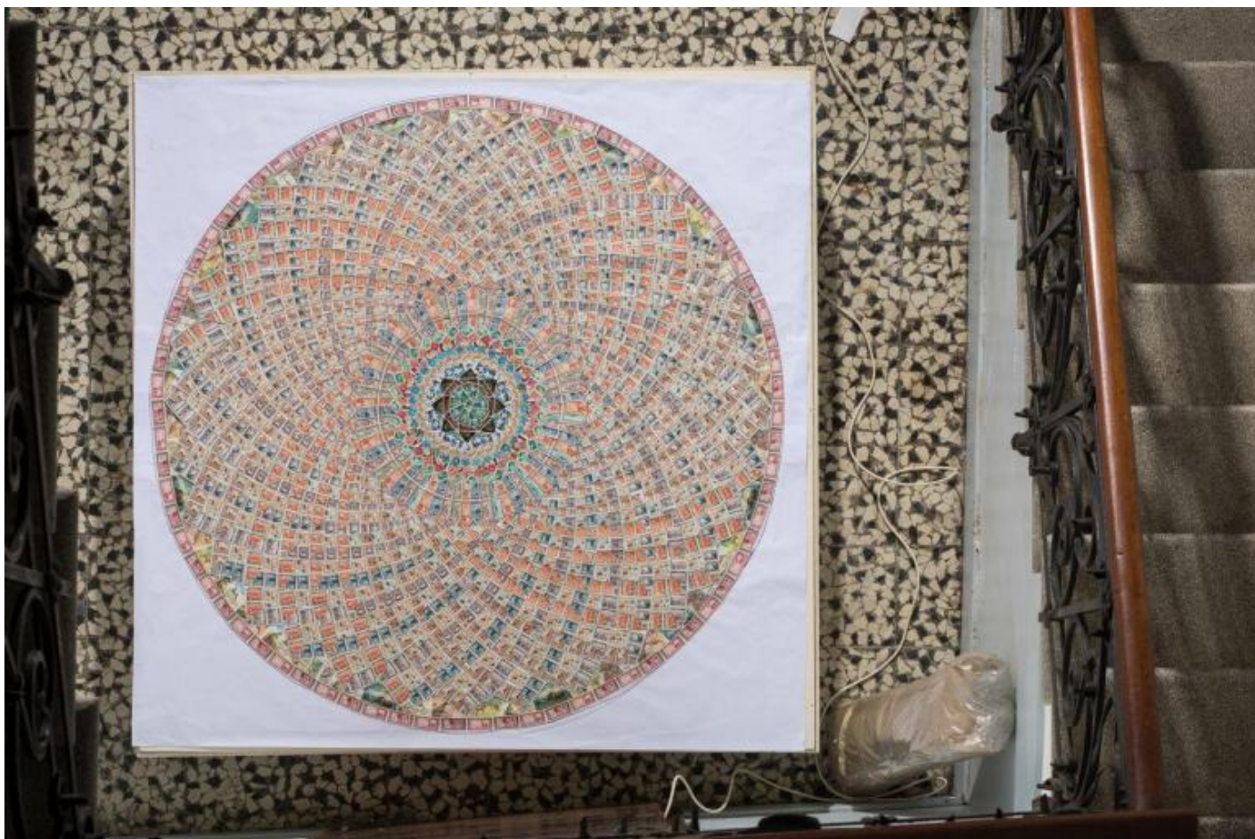
Greetings from Venice