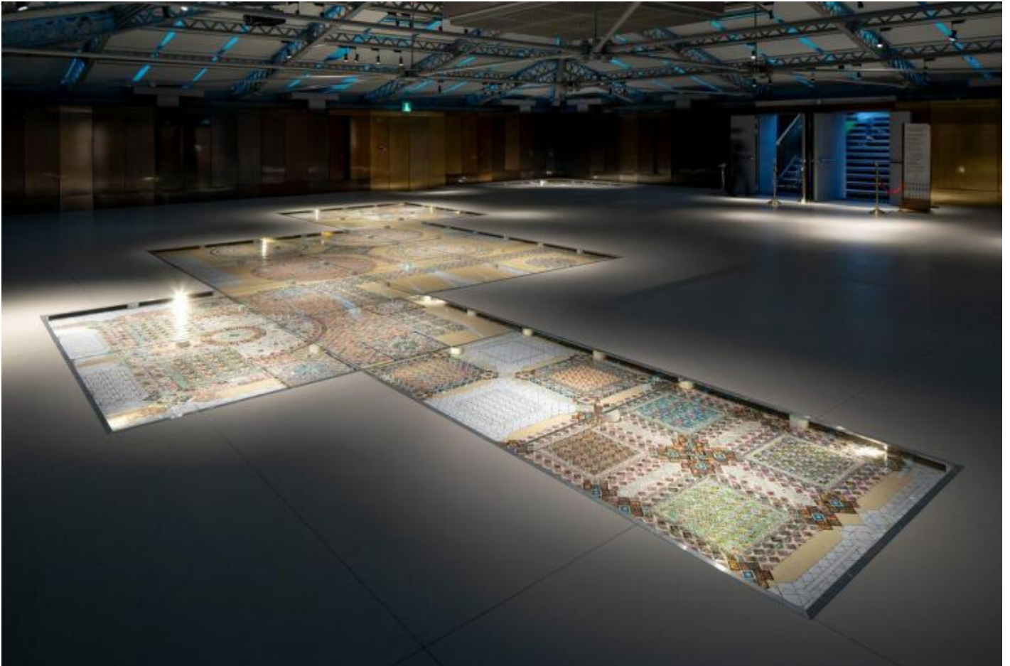
Greetings from Venice.

Già le sedi dei rispettivi interventi la dicono lunga sulla distanza fra i due temperamenti, prima che fra le loro opere. Lo scenario di Bazzano, dimesso e pressoché dismesso, allude a una storia opacizzata e “rientrata”, sconfitta e denegata, che ci appare come un revenant persecutorio; il décor squillante di colori e cartellini di prezzi del centro commerciale, che per raggiungere il lavoro di Venezia tocca attraversare (un po’ come il serpentone in autogrill, per guadagnare la zona dei bagni), dice di un presente assoluto e ostentatamente spensierato. Il titolo di Favelli è tetramente suprematista e rinvia a una storia tragica, quello di Di Maggio ironizza sull’ exploitation a stereotipo turistico di un territorio non meno carico di storia.