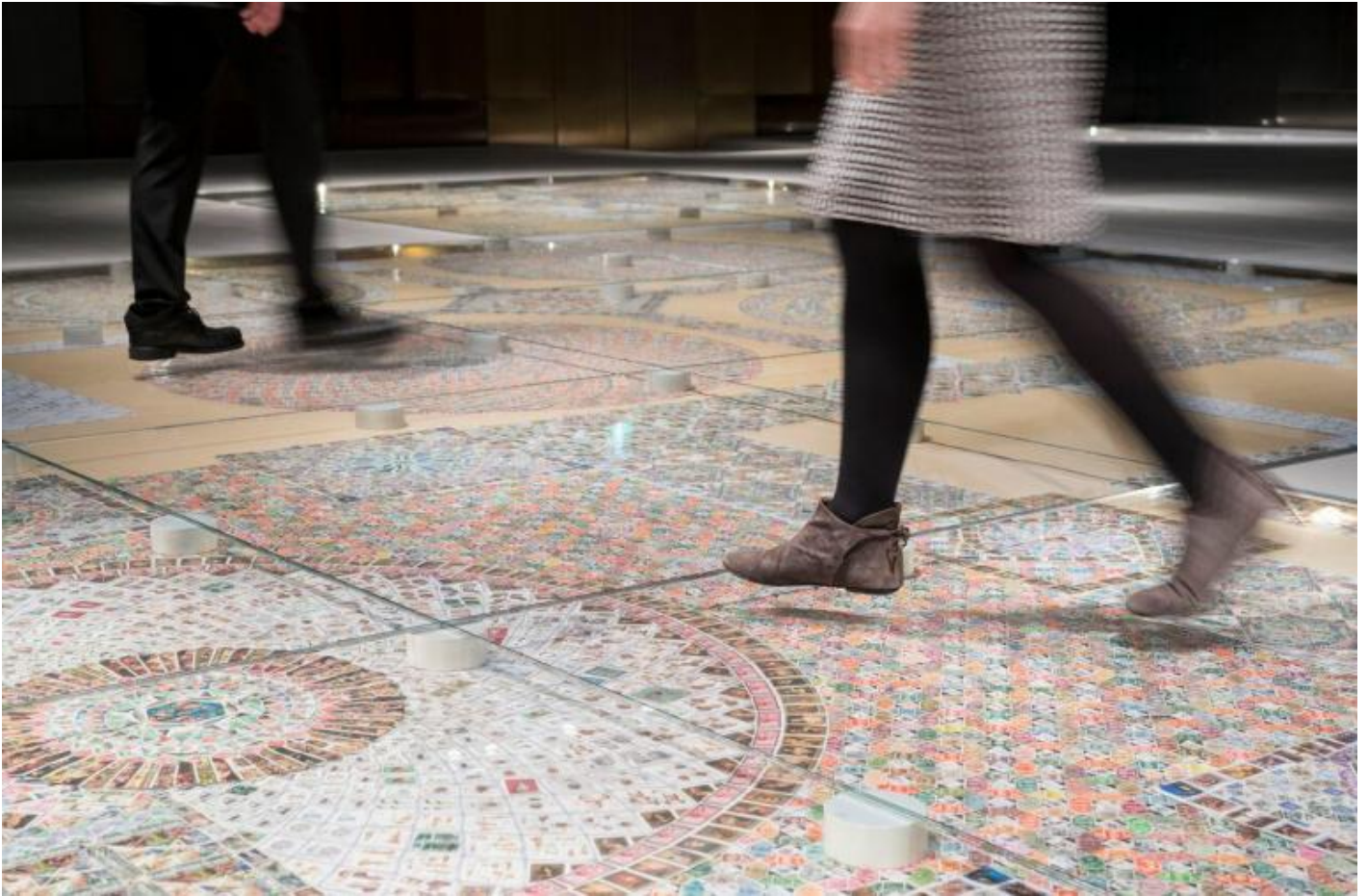
Greetings from Venice.

pretendere di catalogare il mondo, in formato ridotto: a partire dalle sue categorie fondanti, la storia e la geografia.