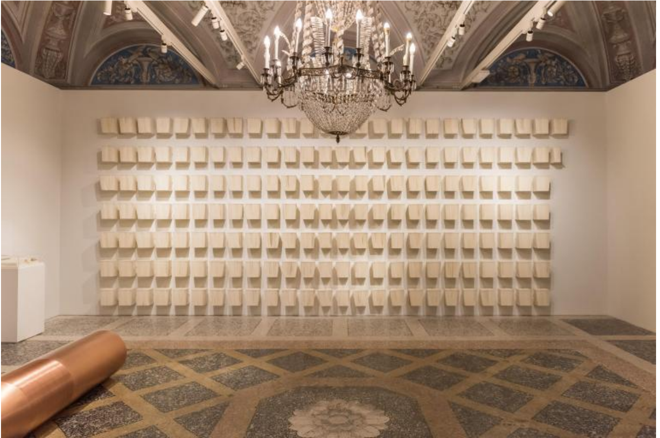
Joana Hadjithomas and Khalil Joreige, 2015.

da scoprire, conoscere, e accogliere; un tono che annulla, di fatto, molteplici identità, additando così a una radicale distanza e differenza - alterità assoluta di un essere che, straniero , ci fa sentire esposti, vulnerabili e insicuri a dispetto di tutti i doni e gli insegnamenti che per primi questi arabi ci hanno dato nei secoli.