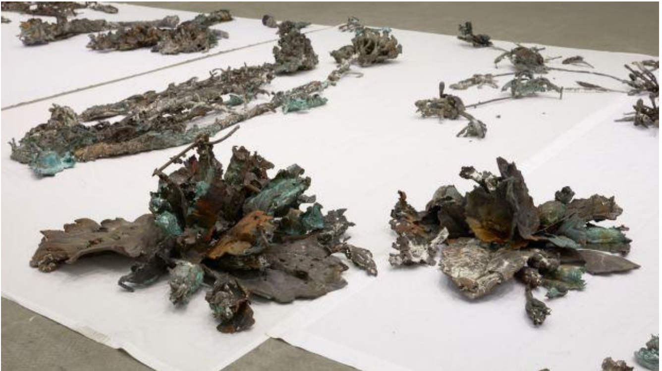
Abbas Akhavan, Study for a monument , 2016.

secolo breve e feroce, sono realizzati con diverse tecniche e linguaggi che aderiscono a quelli dell'arte globale più contemporanea, decisamente lontani dagli stereotipi preconcepi della rappresentazione tradizionale mediorientale - pittura e collage , sculture, fotografie, mixed-media , video, performance e installazioni che hanno significati diversi e una preghiera comune: non guardarmi soltanto, immaginami . Il valore poetico di ogni opera è indiscutibile, il suo significato è nascosto, come un segreto intrappolato a fior di labbra, che non può diffondersi di bocca in bocca .