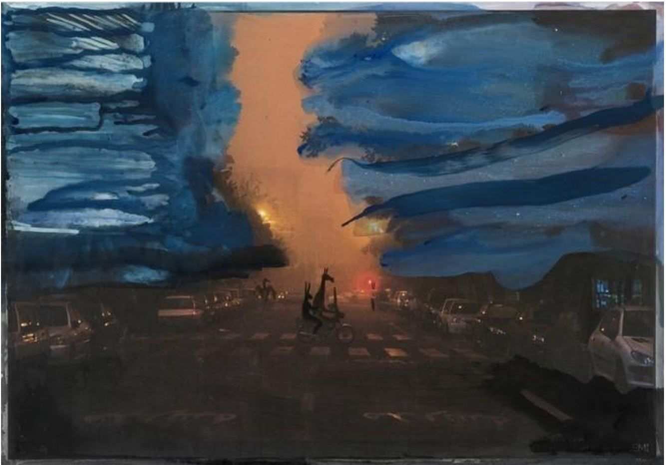
Rokni Haerizadeh, But a storm , 2014.

Ciò che conta è il tentativo di dire e, in questo caso, di fare; nonostante le difficoltà e i limiti irriducibili, la balbuzie di un linguaggio, poetico e artistico che sia: senza dubbio qualcosa andrà perso, ma anche molto, di quel gesto, si salverà. La bellezza salverà questa terra martoriata e benedetta? Tutta questa arte, sarà finalmente utile?