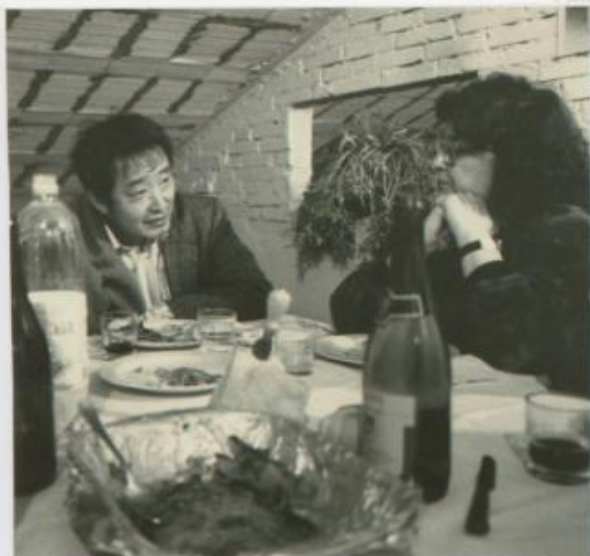
PAIK a Calviago 1990 Febbraio Incontro per organizzazione in ordine Reggio Emilia Spazio: la particolare - per porcere, inaugurare - organize