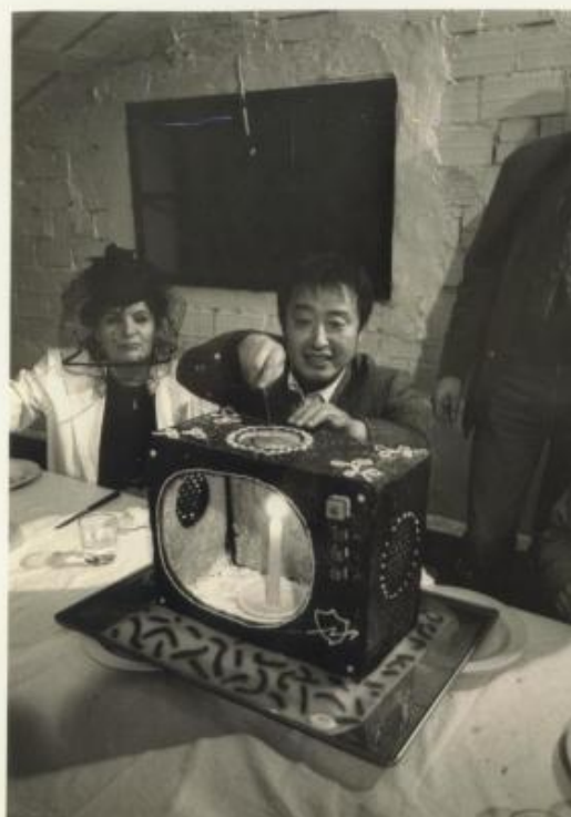
Calviago inventa il taglio del televisione in cioccolato