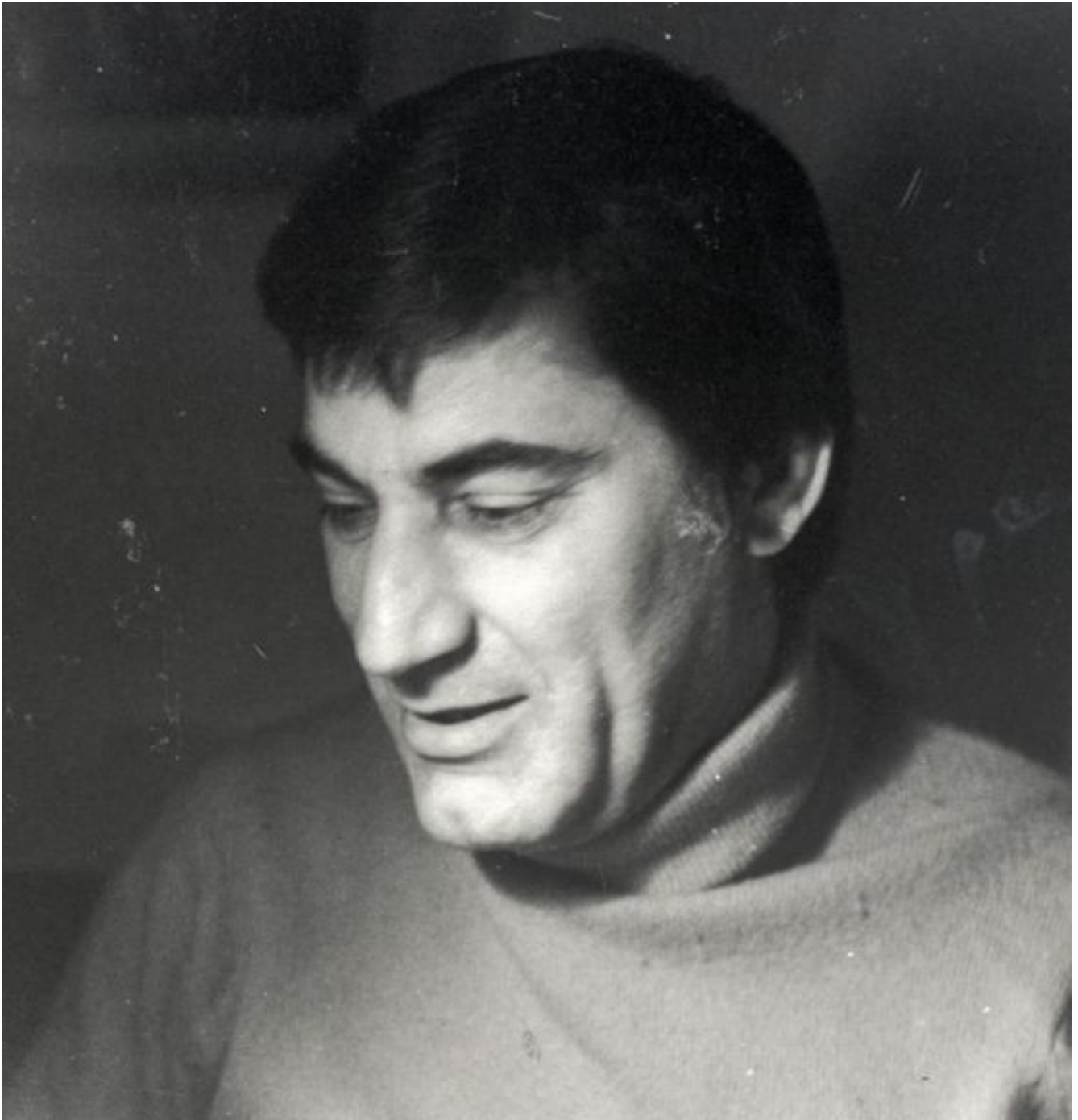
Ritratti di Plinio de Martiis.

Si chiude così un capitolo fondamentale della storia dello spazio espositivo ma anche un capitolo importante delle vicende dell'arte italiana di cui in effetti La Tartaruga è uno specchio fedele. A provarlo è il recente libro di Ilaria Bernardi La Tartaruga. Storia di una galleria (Postmedia 2018, 16,90, 141 pagine): un piccolo volume, illustrato dalle bellissime fotografie dello stesso De Martiis, in cui vengono ripercorse le vicende dello spazio espositivo tra gli anni Cinquanta e Sessanta, e citati i relativi documenti attualmente conservati presso L'Archivio di