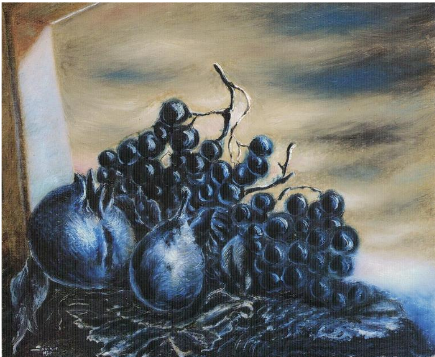
Alberto Savinio, Nature morte bleue , 1930, olio su tela, Collezione privata.

Nell' Autopresentazione a una mostra alla Galleria Il Milione a Milano nel 1940 Savinio descrive il suo lavoro di pittore. Afferma di voler dipingere sempre meglio, ma non per descrivere in modo più aderente la realtà fenomenica, «anzi per sempre più staccare la "cosa" dipinta dalla cosa reale, per implicarla in sé, per isolarla», vuole «dipingere sempre più forte», «portare con ogni mezzo la "cosa" dipinta al suo massimo di intensità», «far "cantare" la parola pittorica». Di tale impostazione teorica antinaturalistica fanno dunque parte gli uomini con teste di animali, ispirati alla metafisica ironica di Weininger, e la possibilità di dipingere una natura morta blu. Il fondo dei quadri deve essere per lo più nero, e il nero ha, secondo Savinio, la stessa funzione dell'oro nei quadri medievali: nel bellissimo Objets dans la forêt dipinto nel 1927-28 gli oggetti colorati si stagliavano sullo sfondo inquietante di una foresta grigia.