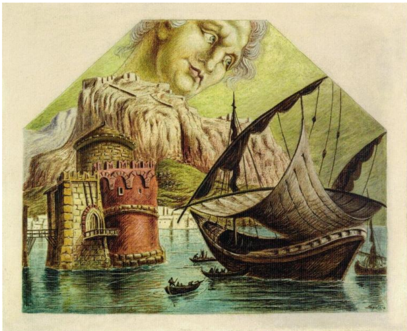
Alberto Savinio, Partenza degli Argonauti , 1933, olio e tecnica mista su tela, Mart, Rovereto.