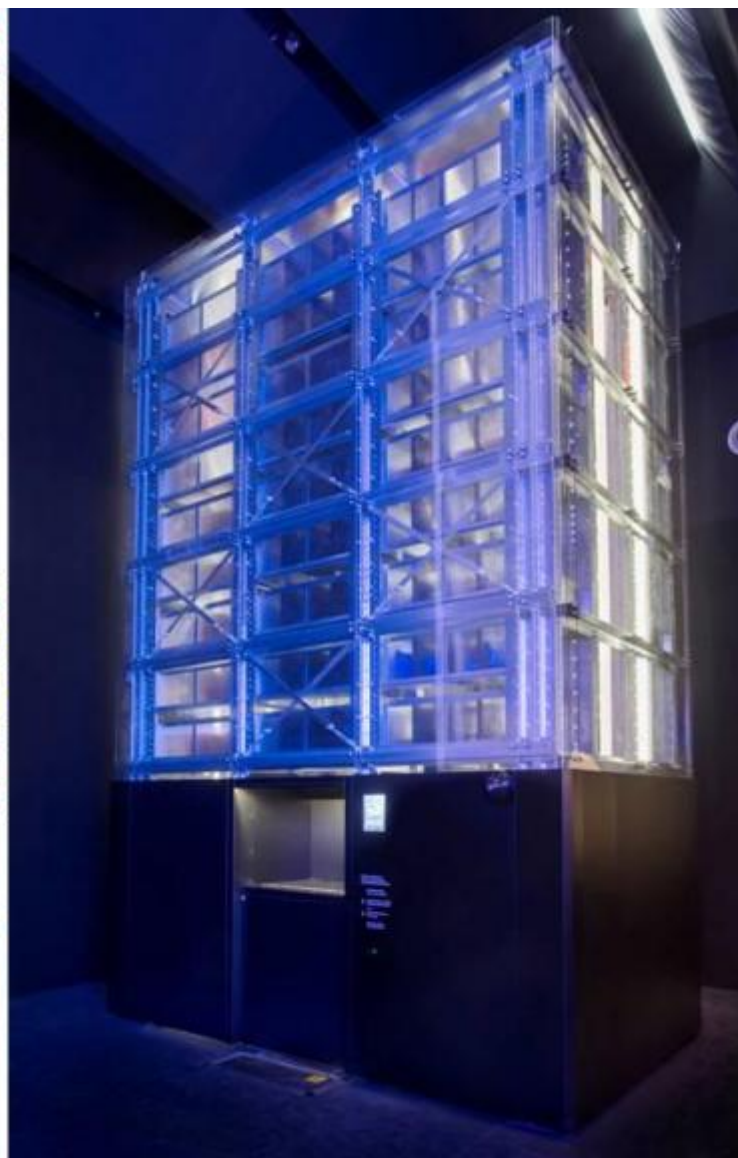
Milano. XI Triennale Design Museum, Storie. Il design italiano ..

Quasi fossero emergenze architettoniche, case e non cose, tra auto parcheggiate, dalla 202 Coupé (di Giovanni Savonuzzi e Pinin Farina per Cisitalia, 1947), alla Ferrari 125S (di Gioacchino Colombo per Enzo Ferrari, 1947), dall' Isetta (di Ermenegildo Preti per Iso Rivolta, 1953), alla mitica 500 (di Dante Giacosa per Fiat, 1957), alla Panda (di Giorgetto Giugiaro per Fiat, 1980); biciclette, dalla Graziella (di Rinaldo Donzelli per Teodoro Cinelli, 1964), alla Laser (di Antonio Colombo, Paolo Erzegovesi, Gianni Gabella per Cinelli, 1980); moto e motorini, dalla Vespa (di Corradino d'Ascanio per Piaggio, 1946), alla Lambretta (di Pier Luigi Torre e Giacomo Pallavicino per Innocenti, 1947), dal Ciao (di Bruno Gaddi per Piaggio, 1967), fino al Monster 900 (di Miguel Galluzzi per Ducati, 1993), che chiude il percorso, i pezzi si susseguono con un andamento cronologico; emergono, ma anche si celano, l'uno dietro all'altro, per lasciarsi scoprire, farsi riconoscere, tetragoni e al contempo lievi nella loro conclamata iconicità.